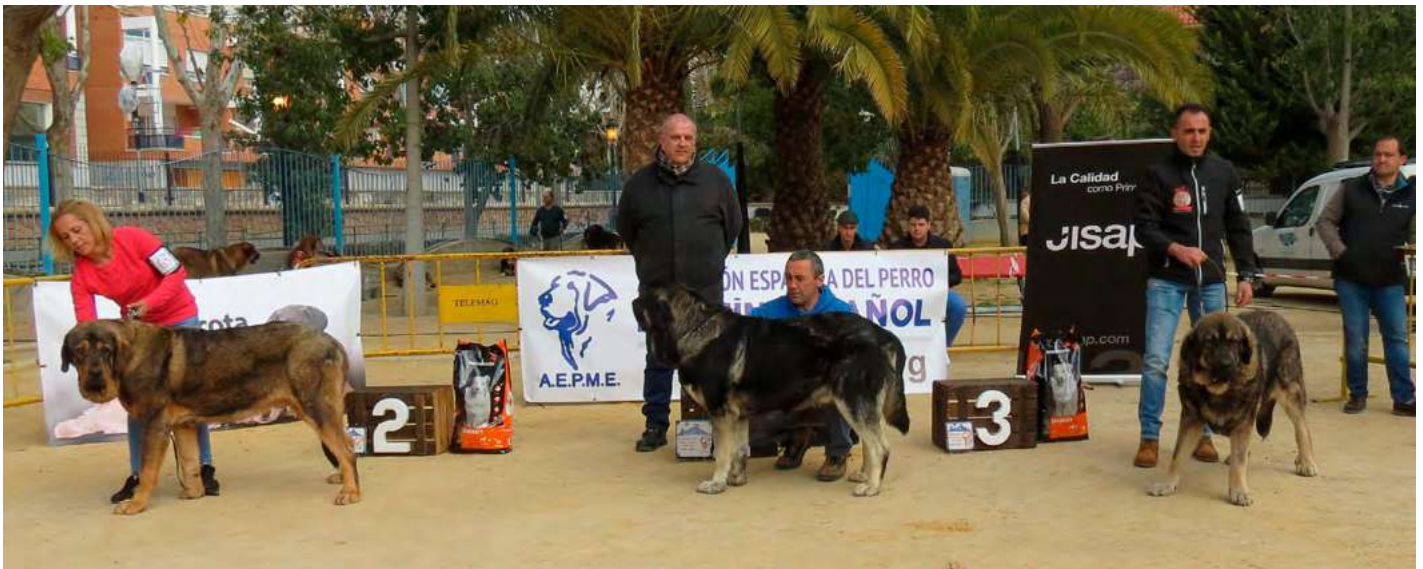
PODIUM JÓVENES MACHOS