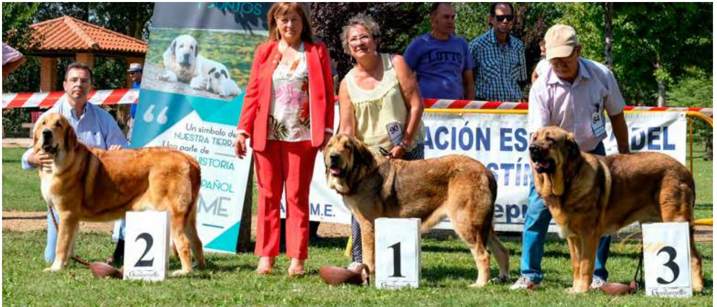
PODIUM JOVEN HEMBRA