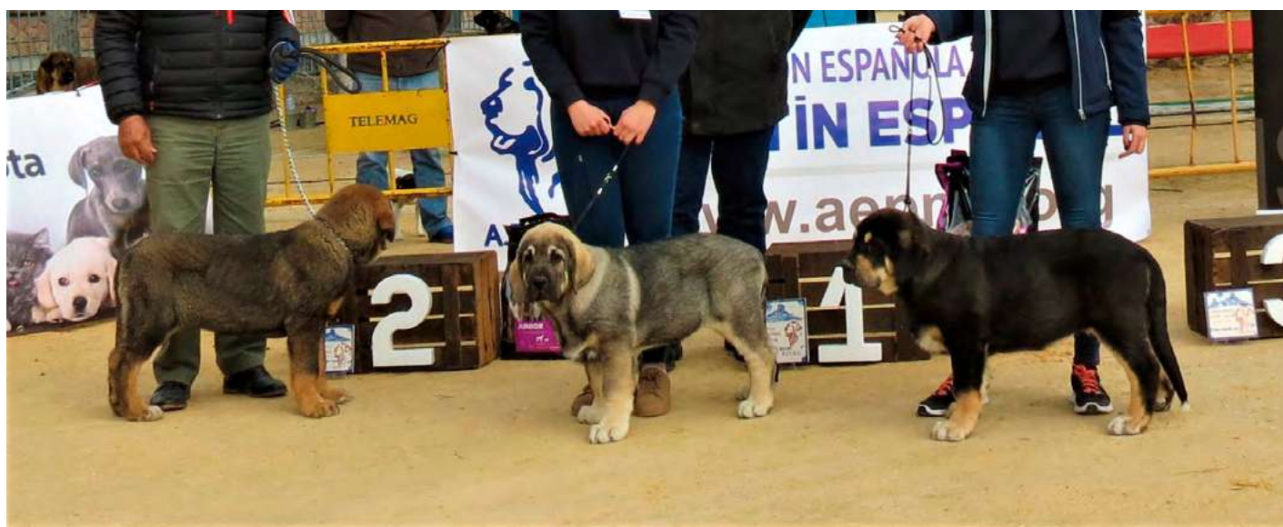
PODIUM MUY CACHORROS MACHOS