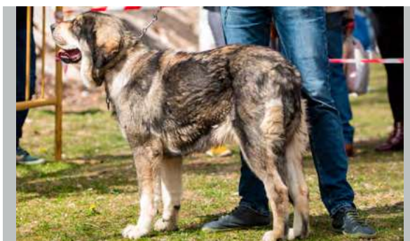
B - SELVA

15 meses. Buena talla, excelente hueso, perra suficientemente larga, exceso de pieles, muy buenas proporciones de cabeza, mordida en tijera pero un poco estrecha. Oreja muy grande y de mala forma.