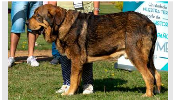
EXC 2º R.C.C.J. - MILTON DE FONTE XUNQUERA

Boca, ojos, oreja y pelo correctos. Proporciones correctas. Cabeza y expresión óptima. Extremidades correctas. Movimiento correcto.