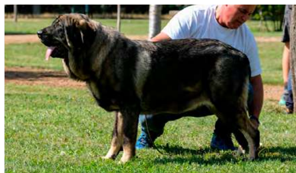
EXC 4º- BERTA VALLE DEL PISUEÑA

Boca óptima. Ojos, oreja y pelo correctos. Proporciones óptimas. Cabeza y expresión típica. Cuerpo óptimo. Extremidades óptimas. Movimiento correcto