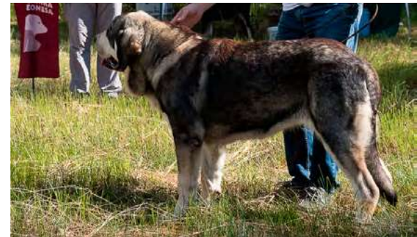
MB 1° - MAYA DE LOS ARÁNDANOS

8 meses, típico, masculino, dentadura correcta y completa, buen color de ojos, buena línea dorsal y grupa; muy buen hueso y aplomos delanteros; buen carácter, angulaciones traseras un poco rectas. Movimiento correcto.