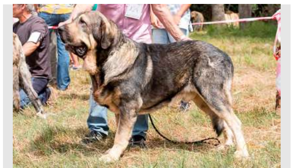
EXC 6º - TUNO DE AUTOCAN

3 años, dentadura correcta, masculino, cabeza típica, ojos algo claros, buena línea superior, grupa OK, buenas angulaciones, excelente línea inferior, movimiento correcto, muy buen pelo.