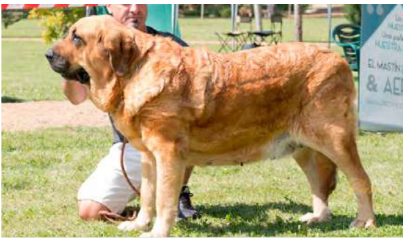
EXC 11º - LESLIE TORNADO ERBEN

Boca, ojos, oreja y pelo correctos. Proporciones correctas, deseable línea superior más recta. Cabeza y expresión típica. Cuerpo correcto. Extremidades correctas. Movimiento correcto.