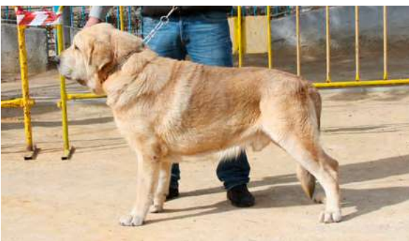
MB - JACINTO DE FUNEGRA

4 Años y medio, buena boca, muy buena talla, buena cabeza pieles hueso angulaciones, línea dorsal muy buena, abre manos en parado y movimiento algo flojo.