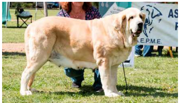
NIKE CHARLEY TORNADO ERBEN