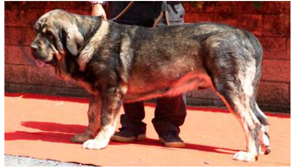
EXC 2° - GENTO DE MONTAÑAS DE LEÓN

23 meses. 23 meses. MB aspecto general. Muy equilibrado. EXC. hueso. MB cabeza, EXC. hocico, costilla y angulaciones