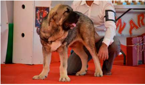
MB 1º - CALORRO DE FUENTE DEL GRAJERO