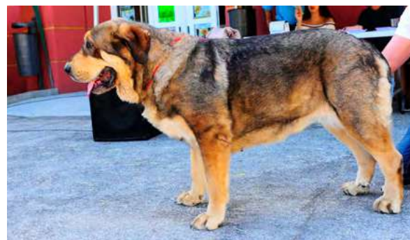
EXC 24° - ADA DE CUATRO ELEMENTOS

2 años.- optima oreja en tamaño y colocación. MB construida talla y hueso correcto. EXC. hocico y angulaciones. B costillar y movimiento.