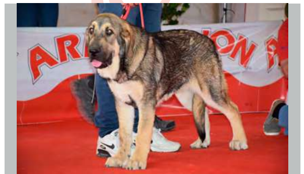
MB 2º - VESTA DE FINCA NOBLE