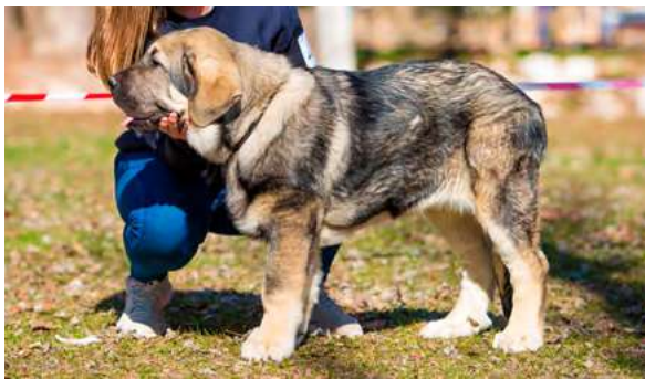
MB 3º - ORIÓN DE FINCA NOBLE

5 meses. Buen tamaño, la cabeza me gustaría un poco más desarrollada, buenas proporciones, los ojos suficientemente oscuros y boca buena en tijera, la oreja podría ser más pequeña y triangular, movimiento típico de cachorro.