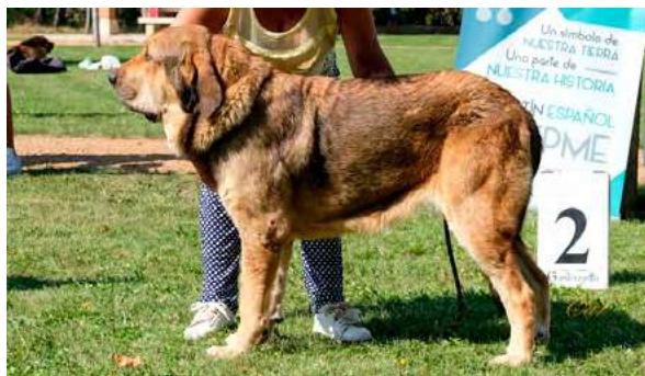
EXC 1º C.C.J M.J - JADE DE FONTE XUNQUERA

Boca, ojos, oreja y pelo correctos. Proporciones óptimas. Cabeza y expresión muy típicas. Cuerpo óptimo. Extremidades óptimas. Movimiento óptimo