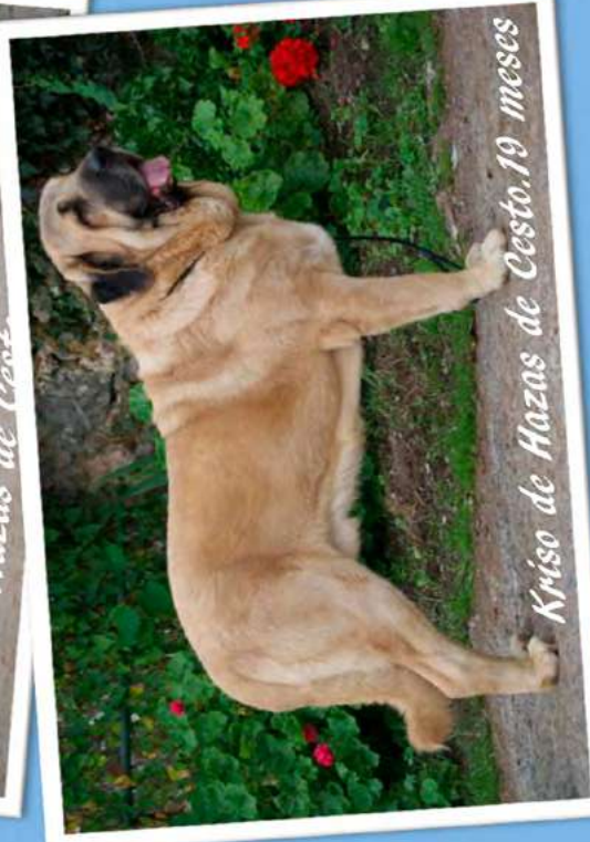
Kriso de Hazas de Cesto. 19 meses