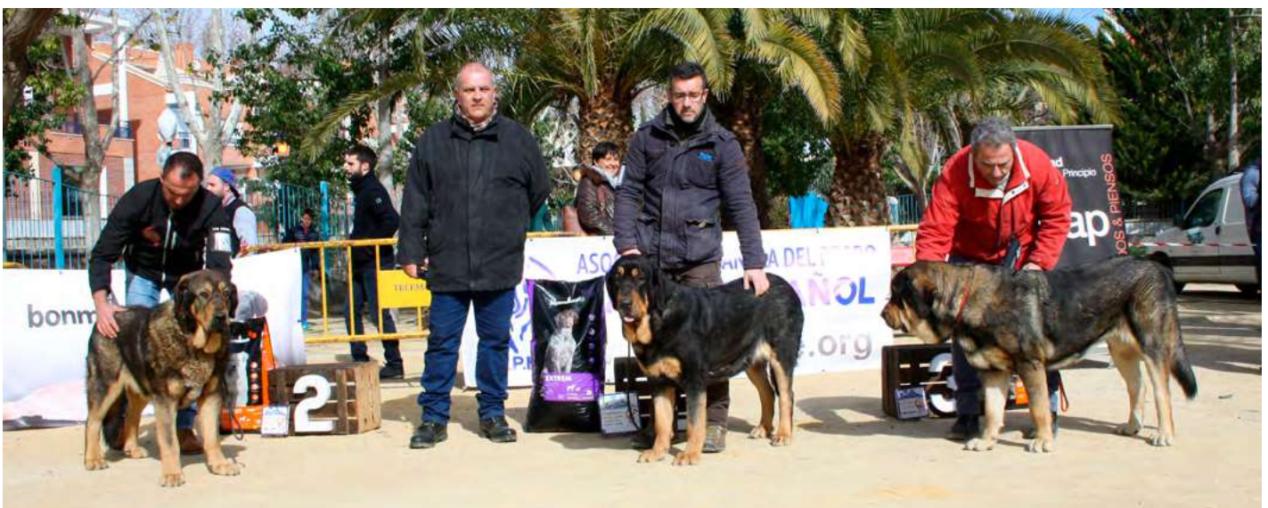
PODIUM JÓVENES HEMBRAS