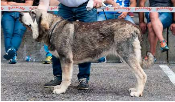
MB 1º M.C. - MAYA DE LOS ARÁNDANOS

8 meses, MB construcción, talla, proporciones cráneo/hocico, línea dorsal y pieles, ojos avellana, tijera, B angulación delantera y trasera, oreja ligeramente grande, MB movimiento con gran amplitud.