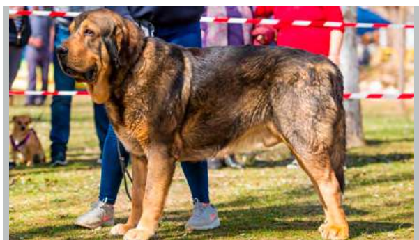
MB - BALAM DE AMDECE DE NAVA

2 años. Excelente talla y hueso, cabeza con buenas proporciones, ojos suficientemente oscuros, mordida en tijera, la oreja podría ser un poco más pequeña, excelente línea dorsal, angulaciones buenas las delanteras y blandas las traseras, el movimiento no lleva bien la línea dorsal y corvejones.