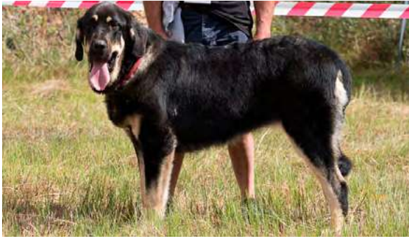
EXC 4° - SENDA DEL TERDÁN

9 meses, femenina, típica, buen color de ojos, boca ok, cabeza correcta, línea superior ligeramente hundida, angulaciones OK, aplomos delanteros correctos, no así los traseros; , movimiento correcto.