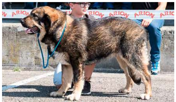
MB 2º- BRACO DE FILANDON

7,5 meses, MB construcción, MB proporciones cabeza –cráneo- hocico, ojos color avellana, B forma y tamaño orejas, piel suelta, MB calidad de pelo, MB angulaciones delanteras y trasera, pinza, MB empuje trasero.