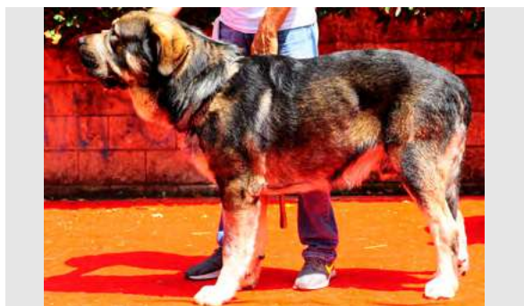
EXC 16º - SOLO DE RECIECHO

2,5 AÑOS. Boca correcta, ojos claros, MB cabeza. Pecho un poco estrecho, grupa derribada. No se puede valorar el movimiento.