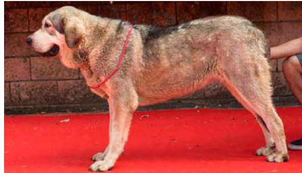
EXC 12° - CHALANA DE FILANDON

9 meses. Boca optima, ojos, orejas y pelo correcto. Típica, Buen aspecto general. B cabeza, EXC. hocico, cráneo un poco estrecho. MB cuello. B angulaciones, hueso y movimiento