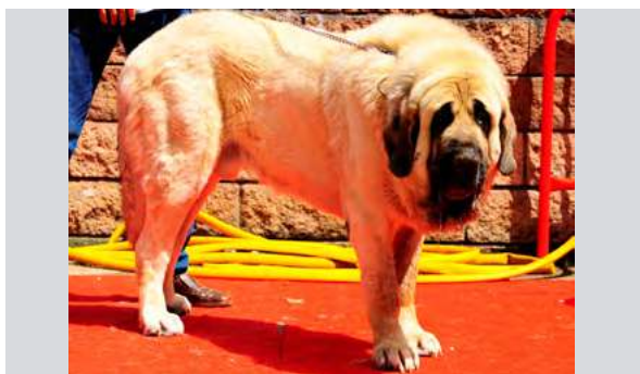
EXC 9º JARO DE GALISANCHO

3 años. Muy masivo, bien construido, EXC pieles. MB cráneo y hocico. MB angulaciones, movimiento correcto. Callo de bursitis, perro en mala condición física.