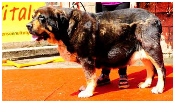
EXC 15° - TURBA DE BUXIONTE

3,5 años. Boca y ojos correctos. Talla correcta, buen hueso. EXC. hocico, costilla, línea dorsal y angulaciones. B., cráneo, y MB movimiento.