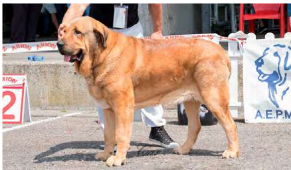
EXC 4º - IROCO DE LA CALELLA DE OTUR

3 años, EXC. proporciones generales y cabeza. Pinza incisivos vigilante. Ojo ligeramente claro. EXC. orejas colocación y forma. EXC. Aplomos y angulaciones con manos y pies de gato. EXC. línea dorsal y ventral, EXC. movimiento con gran empuje y amplitud.