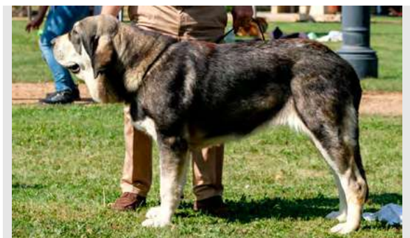
EXC 5º - MAYA DE ARÁNDANOS

Boca, ojos, oreja y pelo correctos. Proporciones óptimas. Cabeza y expresión típica. Cuerpo óptimo. Extremidades correctas. Movimiento óptimo.