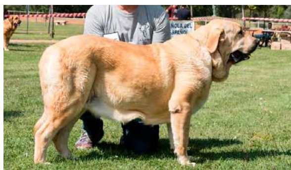
EXC 7º - CALA DE PICU MORU

Boca correcta, Ojos con buena pigmentación. Oreja y pelo correctos. Proporciones óptimas. Cabeza y expresión típicas. Cuerpo óptimo. Extremidades óptimas. Movimiento óptimo.