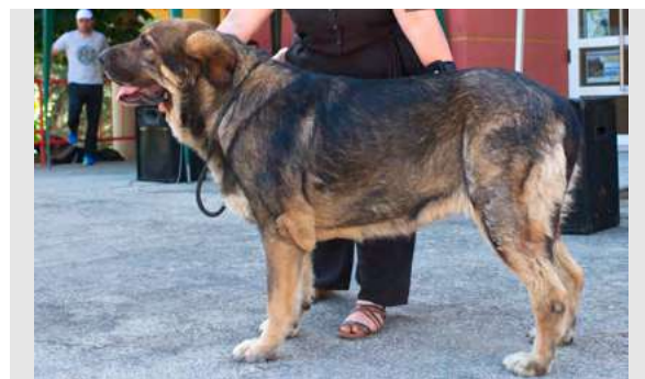
EXC 25° - KIMBA DE LA CAMPERONA

4 años. Boca en pinza. Bien construida, MB hueso, línea dorsal, angulaciones y movimiento. Cráneo ligeramente plano, hocico un poco largo.