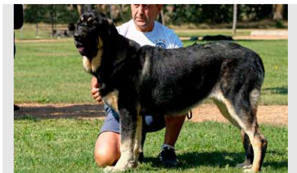
EXC 6º- SERRANA DE MOMATTI

Boca, ojos, oreja y pelo correctos. Proporciones correctas. Cabeza y expresión muy típica. Cuerpo óptimo. Extremidades óptimas. Movimiento óptimo.