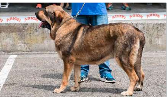
EXC 2° - LUNA I DE LOS PISCARDOS

18 meses, EXC. proporciones corporales y proporciones cráneo/hocico, desearía cráneo más ancho, tijera, ojo ligeramente claro, EXC. oreja en implantación y forma, EXC. angulación delantera y trasera, línea dorsal y ventral, aplomos delanteros y traseros, pieles y movimiento.