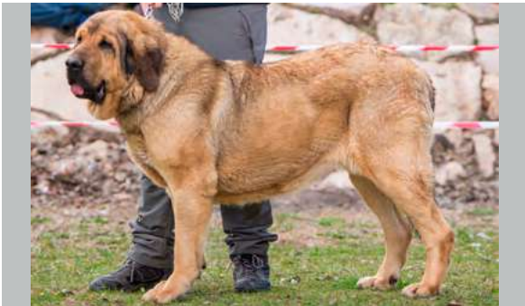
EXC - DULCINEA DEL PESEBRILLO

4 años. Talla un poco justa, con un hueso acorde, cabeza con buenas proporciones, cráneo limpio, el ojo podría ser un poco más oscuro, mejor porte de orejas y mordida en pinza, costillar suficientemente abierto, angulaciones correctas delanteras y traseras, grupa un poco inclinada, movimiento trasero flojo.