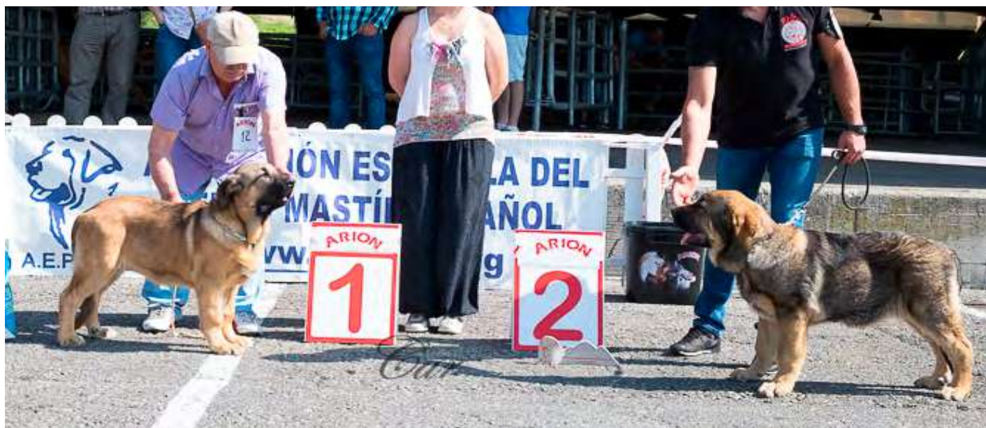
PODIUM MUY CACHORROS HEMBRA