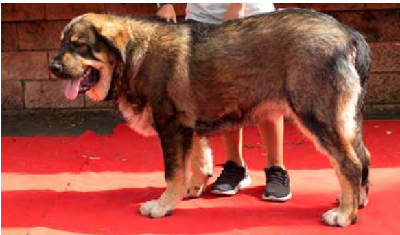
MB 3° - BRACO DE FILANDÓN

7 MESES, Boca, ojos, oreja y pelo correcto, B talla, cabeza, hueso y movimiento, MB angulaciones, línea dorsal encarpada, movimiento B