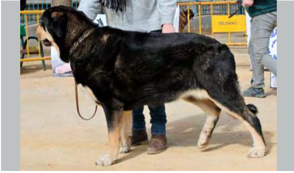
EXC - HADA DEL VIEJO PARAMO

21 Meses, boca correcta, buen tamaño, línea lateral, aplomos y pecho, en el rectángulo, movimiento trasero más potente.