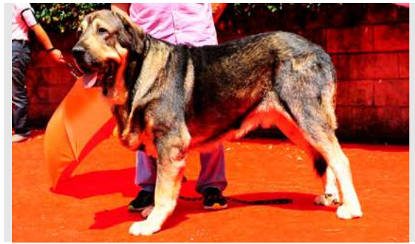
EXC 18° - TUNO DE AUTOCAN

2 años. Boca correcta. Exc hocico, cráneo ancho y algo plano. B angulaciones delanteras y traseras. Movimiento correcto.