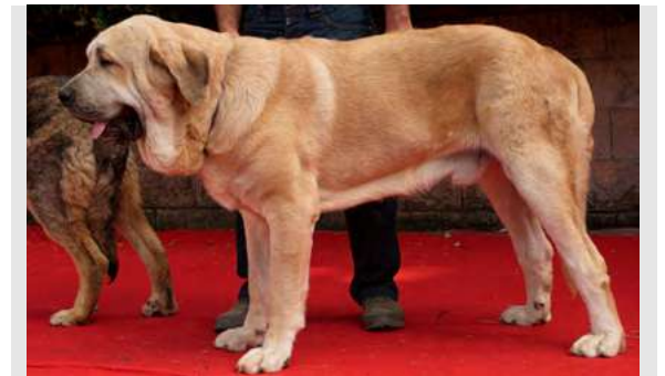
EXC 2º - KINTERO DE LA VEGA DEL PORMA

11 meses. Boca completa, típico y bien construido, cabeza típica, ojo un poco claro, EXC. línea dorsal y ventral, angulaciones delanteras y traseras. Movimiento EXC.