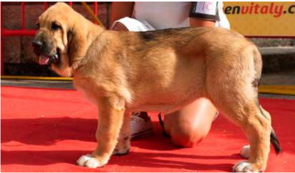
MB 6° - TORCA DE LA REGUERA

Boca, ojos, oreja y pelo correcto, MB proporciones, cuerpo y extremidades con MB hueso, movimiento correcto.