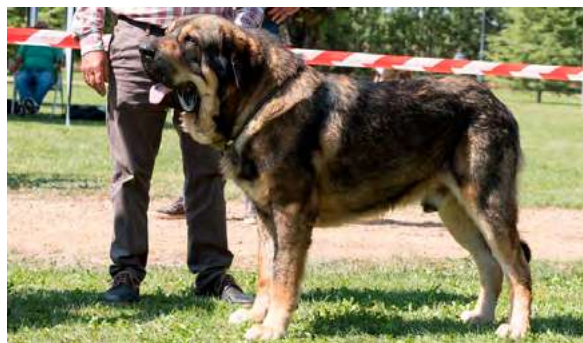
EXC 6° - CESTO DE FILANDÓN

Boca, ojos, oreja y pelo correctos. Proporciones óptimas. Cabeza y expresión óptimas. Cuerpo óptimo. Extremidades correctas. Movimiento correcto.