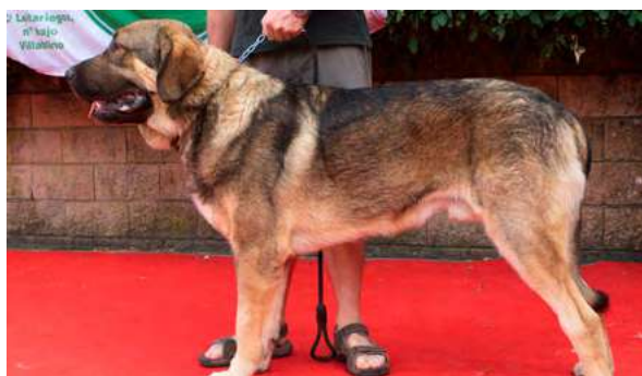
EXC 7° - VALLE DE LOS PISCARDOS

9 meses, boca completa, prolapso 3° parpado ojo izquierdo, típico, largo, delgado, MB cráneo, hocico, hueso, oreja algo retrasada, cuello largo. MB angulaciones.