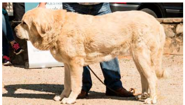
B - DUQUE DE RIOALLER

6 meses, tijera, MB proporciones y cabeza, pieles sueltas, optimas angulaciones delanteras y trasera, pelo de verano, manos ligeramente blandas, buen movimiento con gran empuje, desearía más sustancia en general y ojos más oscuros.