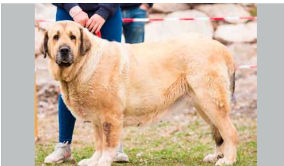
EXC - SELVA DE MONTES DEL PARDO

23 meses. Perra de buena talla, hueso suficiente, le falta anchura del costillar, la cabeza tiene buenas proporciones, la oreja un poco grande y alta, ojo muy oscuro, mordida en pinza, movimiento trasero un poco flojo.