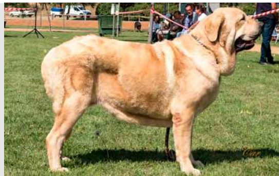
EXC 2º R.C.C. - LUCÍA DE FUENTE DEL GRAJERO

Boca, ojos, oreja y pelo correctos. Proporciones óptimas. Cabeza y expresión óptimas, muy típicas