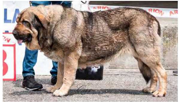
EXC 4° - TURKA DE SALGUEIRON

4 años, masiva, EXC. proporción corporal y osamenta, EXC. proporción cráneo/hocico, cabeza potente, tijera, ojo avellano, EXC. orejas, línea superior, angulaciones, pieles y movimiento.