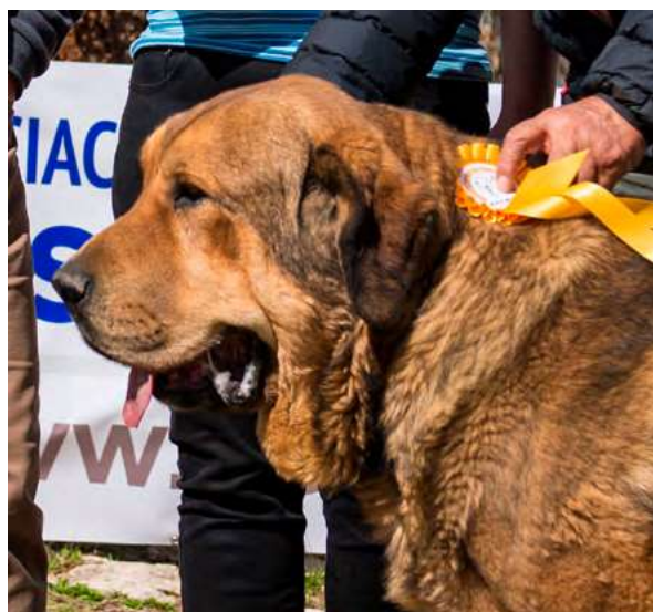
ZARPAS DE LA VICHERIZA