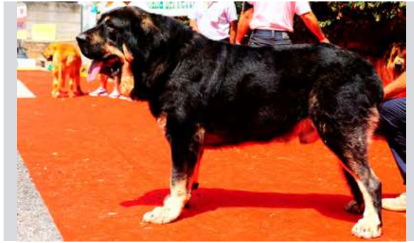
EXC 1º M.C. B.I.S. - CAÍN

3 años. Boca correcta, muy típico, MB construido. EXC cabeza y expresión. EXC. línea dorsal y ventral, EXC. angulaciones, movimiento correcto.