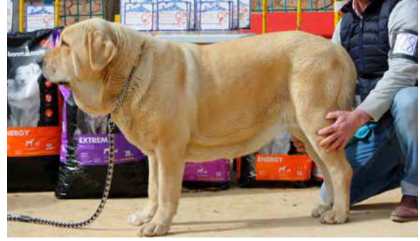
EXC - LUCIA DE FUENTE DE GRAGERO

21 Meses, boca correcta, buen tamaño, línea lateral, aplomos y pecho, en el rectángulo, movimiento trasero más potente.