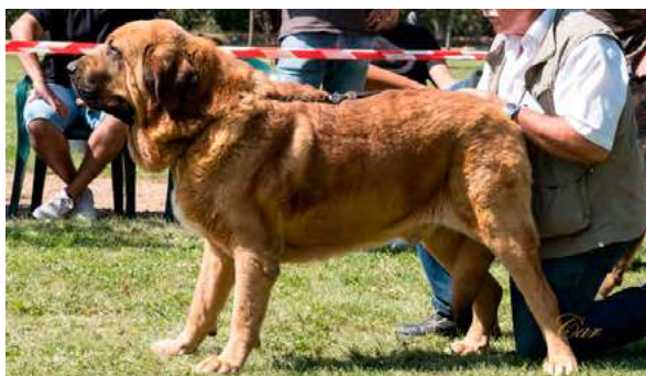
EXC 7° - HIGH T-BONE DE TIERRA DE ÓRBIGO

Boca, ojos, oreja y pelo correctos. Proporciones correctas. Cabeza y expresión muy típicas. Cuerpo correcto. Extremidades correctas. Movimiento correcto.