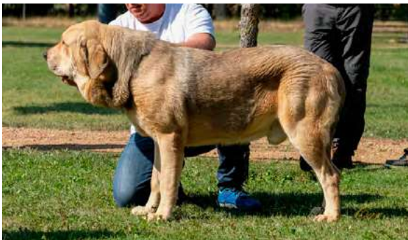
EXC 1º C.C.J. - ARMANI VALLE DEL PISUENA

Boca, ojos, oreja y pelo correctos. Proporciones correctas. Cabeza y expresión óptima. Extremidades correctas. Movimiento correcto.