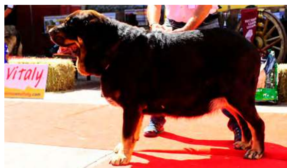
EXC 9° - CHERZA DE RECHIECHO

Boca completa, ojos oscuros, oreja correcta, perra larga, buena talla, EXC. hocico y línea dorsal. Costilla un poco planta, MB angulaciones y movimiento.