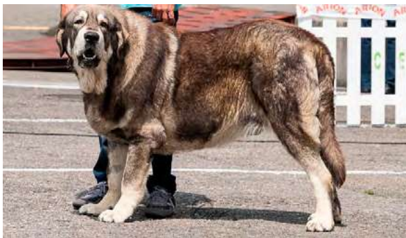
EXC 3° - CHARCO DE LOS PISCARDOS

18 meses, masivo, EXC. proporciones, cráneo/hocico. Tijera, incisivos desgastados, falta P2, desearía ojos más oscuros, EXC. orejas, MB línea dorsal, EXC. angulaciones. Se presenta en excesiva condición corporal lo que perjudica su movimiento y aplomos posteriores.