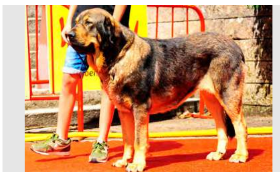
EXC 4° - SEVERA DE FILANDÓN

19 meses. Boca completa, ojo oscuro. B aspecto general. Cráneo un poco estrecho B cabeza. EXC. línea dorsal y ventral y angulaciones traseras. Angulaciones delantera justa. EXC. movimiento.