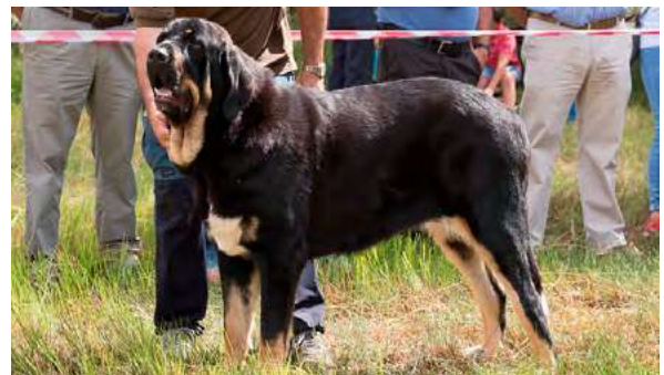
EXC 3° - KONGA DE PICU SAN MARTÍN

15 meses, boca ok, típica, muy buena cabeza, oreja de forma correcta de inserción algo alta, buen pecho, buenas angulaciones, buen pelo, buen movimiento con buen empuje trasero.