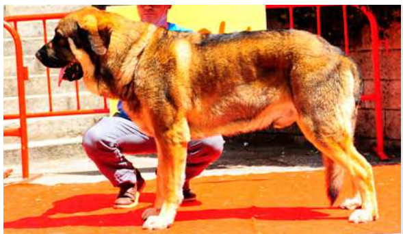
EXC 11º - HIELO DE ALZAVARAN

6 años. Tamaño correcto, muy masivo, EXC. cráneo, línea dorsal y ventral, costillar. Stop un poco marcado. MB angulaciones delanteras, escasa la trasera. Movimiento correcto, saca codos.