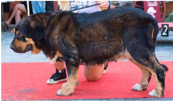
EXC 1º - UNICA DE CUATRO ELEMENTOS

9 años- Boca completa y tjera. Perra típica, talla correcta, mucho hueso, bonita cabeza, excelentes angulaciones y muy buen movimiento.