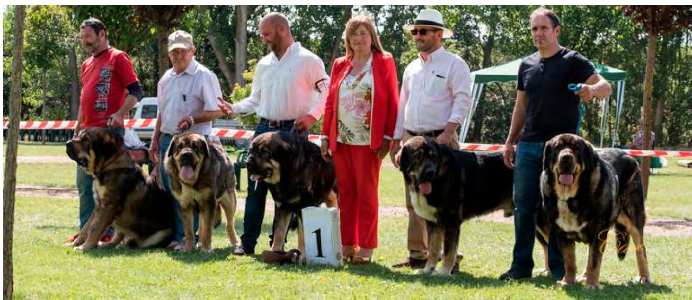
MASTINES DE FILANDÓN