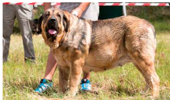
EXC 4° - LUPE DE FILANDÓN

3 años, dentadura correcta, femenina, expresión típica, muy buena cabeza, oreja algo plegada hacia atrás, buena cruz y línea dorsal e inferior, grupa algo corta, angulaciones y pecho muy buenos, aplomos delanteros buenos, buen pelo y pieles, buen movimiento.