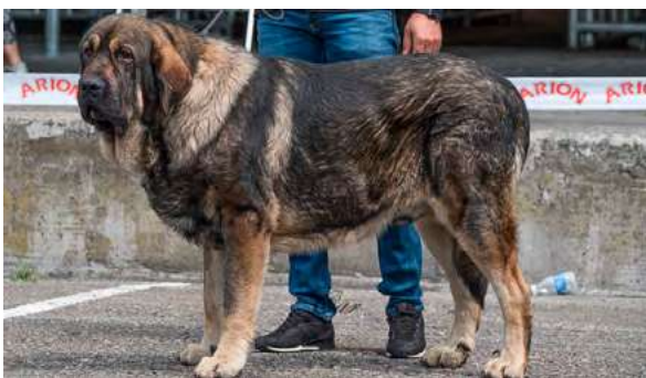
EXC 1° M.M. - BARRO DE LOS PISCARDOS

18 meses, EXC. tamaño y proporción, EXC cráneo y hocico, mordida en tijera, ojos color avellana, vigilar parpado superior, EXC. pelo, línea dorsal y ventral, aplomos, angulaciones, orejas y movimiento con amplitud y empuje.