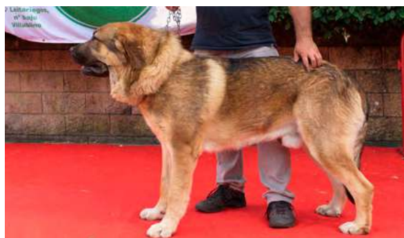
EXC 8° - SAN DE SALGUEIRON

11 meses, boca completa, EXC. talla, parpado desprendido, demasiado bello, exc. hocico. EXC. angulaciones delatera, MB la trasera. Movimiento correcto con línea superior algo débil.