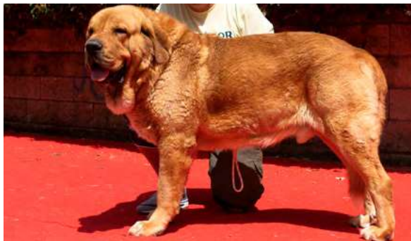
EXC 3º - CARDENAL DE ARASANZ

Boca correcta, EXC. Aspecto general y talla, largo, con cuello. EXC. Cabeza y expresión, pecho, líneas dorsal y ventral, angulaciones. Movimiento MB saca un poco codos.