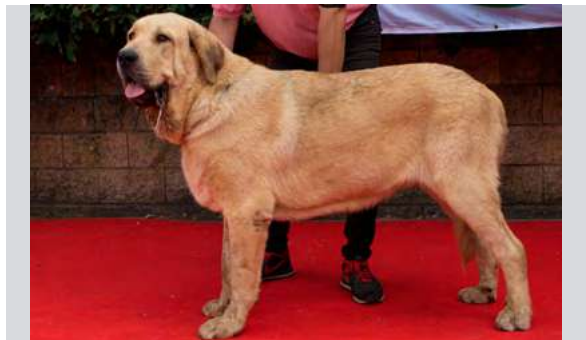
EXC 1º M.J. - JORGITO DE SERYLU

11 meses. Boca completa, típico y bien construido, cabeza típica, ojo un poco claro, EXC. línea dorsal y ventral, angulaciones delanteras y traseras. Movimiento EXC.