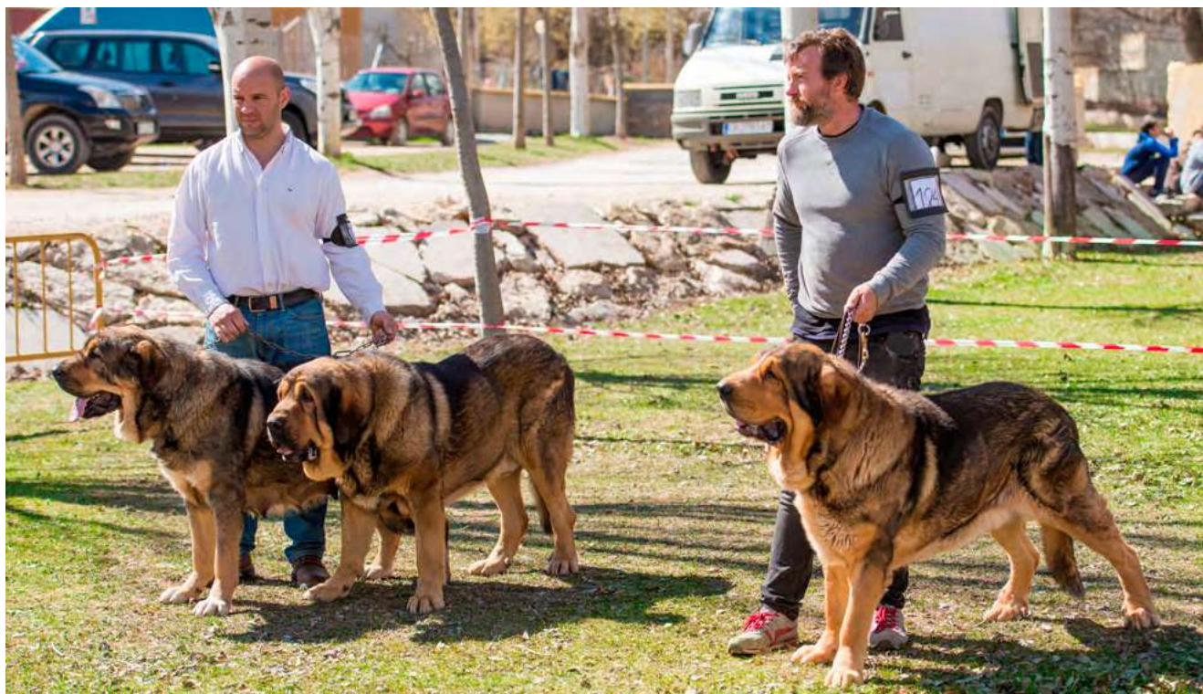
MASTINES DE FILANDÓN