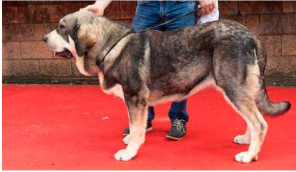
MB 1º M.C. - MAYA DE LOS ARÁNDANOS

8,5 meses. Boca correcta y completa, Buena talla, cabeza muy típica, MB línea dorsal y ventral, MB angulaciones, MB movimiento.