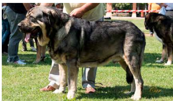
EXC 1° C.A.C. - TOFU DE ANTALMUHEY

Boca, ojos, oreja y expresión correctos. Proporciones óptimas. Cabeza y expresión correctas. Cuerpo óptimo. Extremidades óptimas. Movimiento óptimo