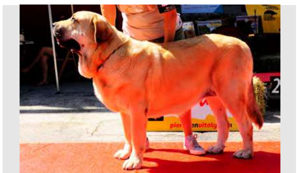
EXC 5° - CAMPERA DE PICU MORU

4 años. Boca correcta, ojos oscuros, oreja un poco alta, EXC. hocico, aspecto general, línea dorsal y ventral, costilla y hueso. MB angulaciones y movimiento. Falta empuje tren posterior.