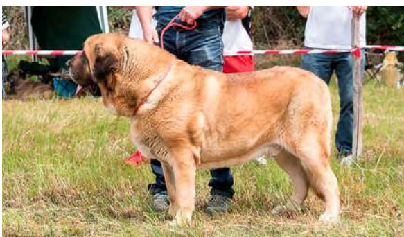
EXC 5º - FARAÓN DE LA RABIZA

Dentadura ok, típico, masculino, bien proporcionado, muy buena cabeza, línea superior e inferior OK, buena grupa y angulaciones, buen pecho, muy buen movimiento, deseable algo más de hueso. Muy buen movimiento.