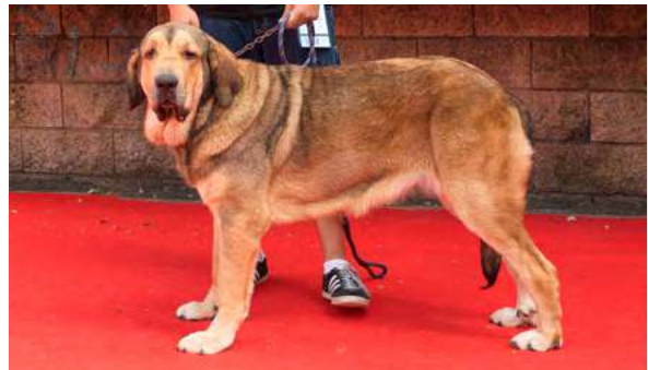
EXC 14° - JADE DE FONTEXUNQUERA

11 meses, boca completa, ojos claros. Cráneo un poco plano, EXC. costilla y angulación delantera, angulación trasera justa. Movimiento correcto.