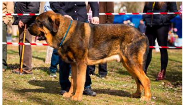
EXC 5° - RAMÓN DE ALZAVARÁN

13 meses. Buenas talla y pelo, me gustaría un poco más largo, excelente hueso, los aplomos un poco blandos, la cabeza con buenas proporciones, mordida en tijera, ojos podrían ser más oscuros, la oreja buen tamaño, movimiento un poco flojo.