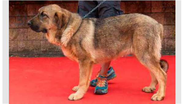
MB 4º - TORMENTA DE LOS PISCARDOS

6 MESES, perra larga, MB pieles, MB cabeza, oreja algo grande y de inserción baja, MB costillar, pecho y línea dorsal, MB angulaciones, B movimiento.