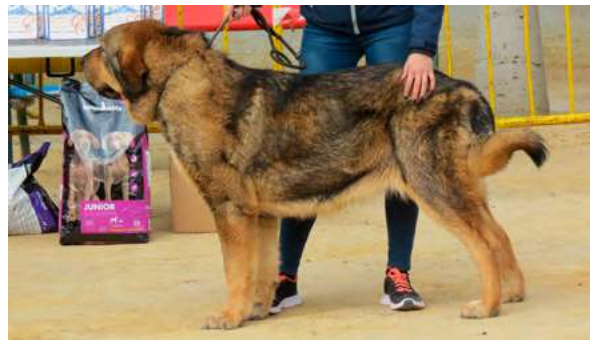
EXC - COLEA DE FILANDÓN

14 Meses, buena boca, tamaño, muy masiva, piel abundante hueso fuerte, angulaciones algo justas, movimiento bueno y aplomos delanteros flojos.