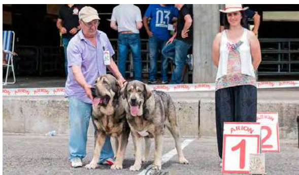
IROCO DE LA CALELLA DE OTUR