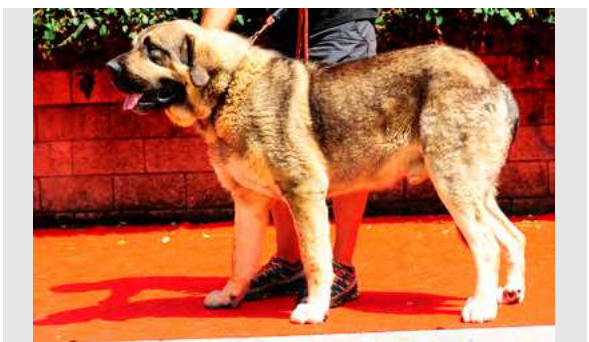
EXC 15º - HISPANO DE LOS PISCARDOS

2,5 años. Boca completa, ojos oscuros, talla correcta, largo, hocico algo largo, cráneo un poco plano. EXC. angulaciones delanteras, justas las traseras, MB movimiento.