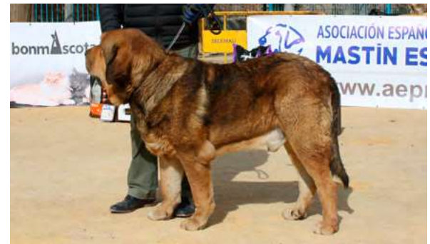
EXC 2º - ZARPAS DE LA VICHERIZA

42 Meses, boca tijera, dos dientes en pinza, muy fuerte buena talla, cabeza y hocico típico, buenas pieles y pelo, excelente angulaciones, movimiento muy bueno.