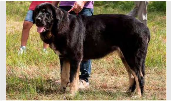
MB 7° - BRAÑA

3 años, cabeza femenina, ojo algo claro, líneas cráneo/faciales OK, línea dorsal correcta, grupa poco descendida y corta, buen pecho, buen pelo. Movimiento justo.