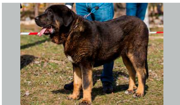
B - TEO DE PICUXIANA

9 meses. Un poco justo de talla, hueso suficiente, muy buena estructura general, la cabeza con buenas proporciones, oreja grande, ojos muy claros, boca correcta, movimiento correcto. El ojo tan claro desfigura totalmente la expresión de la dulzura que debe tener.