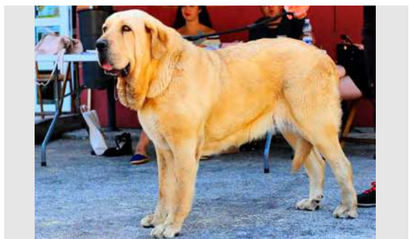
EXC 3° - FABIOLA DE SERYLU

2,5 AÑOS. Boca correcta, ojo claro. MB aspecto y construcción. EXC. cabeza y movimiento. MB angulación delantera y muy justa la trasera.