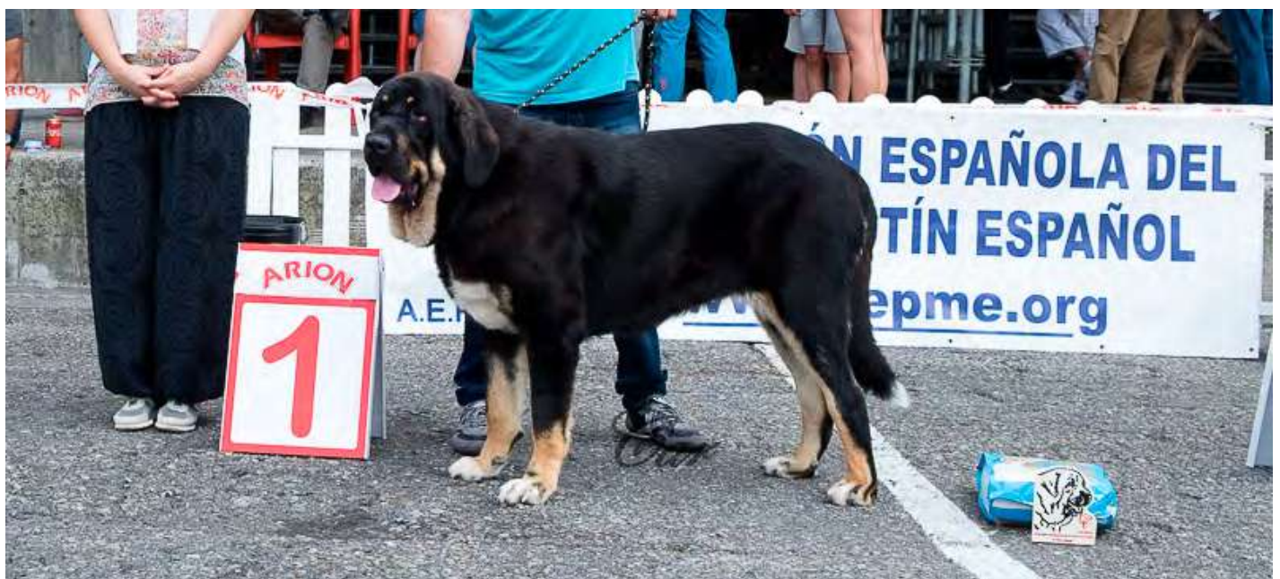
PODIUM JOVENES ABSOLUTA