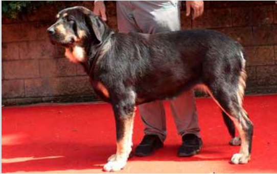
EXC 9° - LIBERTAD DE LA PORTIECHA

13 meses. Boca completa, ojo oscuro. B aspecto general. B oreja un poco grande, costilla plana, EXC, angulación delantera y trasera. B movimiento.