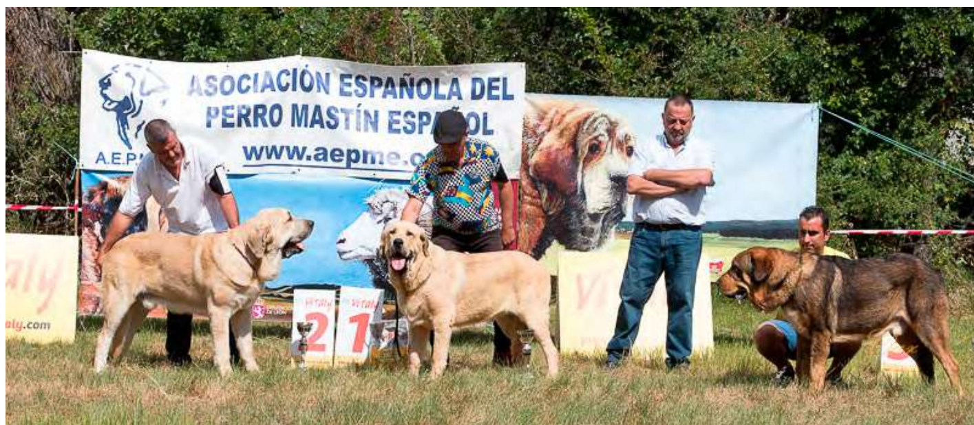
PODIUM IOVEN MACHOS