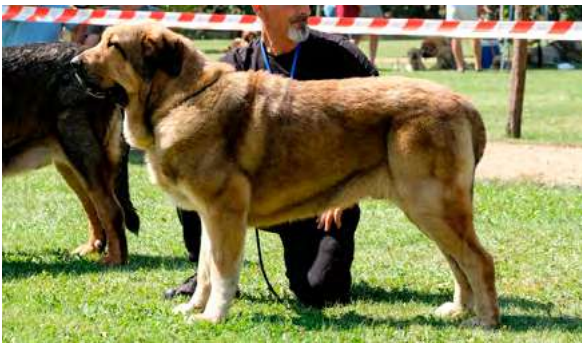
EXC 1° - CRISTU DEL RAIGUSU

Boca, ojos, orejas y pelo correctos. Proporciones óptimas. Cabeza y expresión muy típicas. Cuerpo óptimo. Extremidades óptimas. Movimiento óptimo.