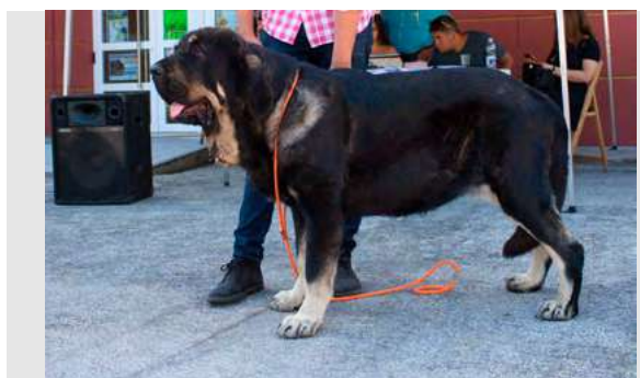
EXC 6° - ROCA DE GRITSANDANA

2 años y 11 meses. Boca correcta, ojos óptimos, muy oscuros, EXC. aspecto general, MB talla, EXC. hueso y sustancia, cabeza, cráneo, hocico, costilla y calidad de pelo. Angulaciones un poco justas. MB movimiento.