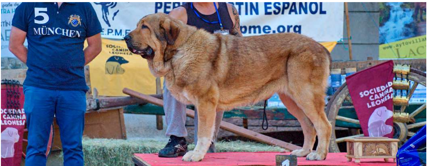
PODIUM MEJOR MOVIMIENTO