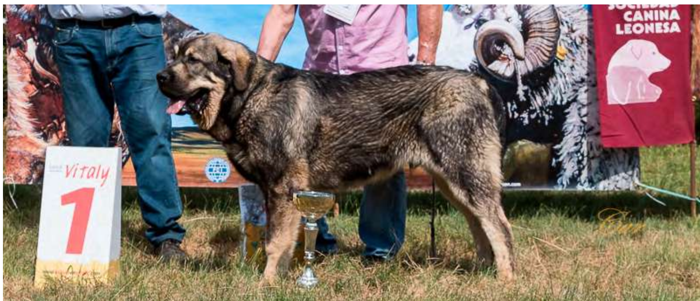
PODIUM CACHORRO ABSOLUTO