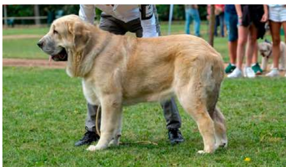
MB 1º M.C. - ARES DE HAZAS DE CESTO

Boca correcta, ojos óptimo, oreja óptimo, pelo óptimo. Proporciones correctas. Cabeza y expresión Óptima, óptima pigmentación. Cuerpo correcto. Extremidades óptimas, movimiento óptimo.