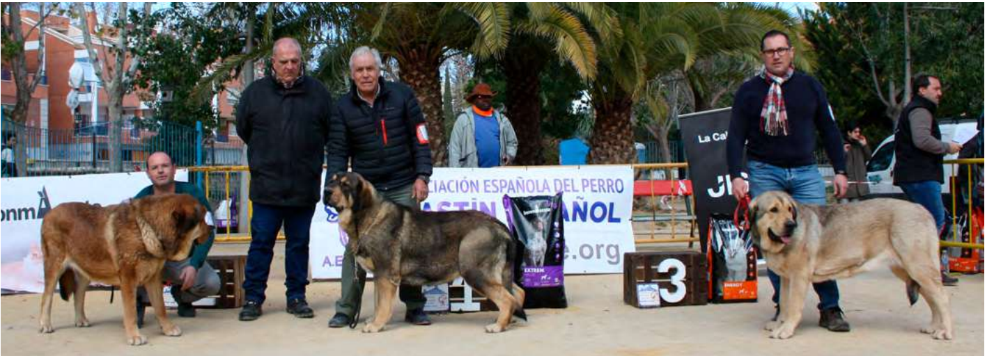
PODIUM INTERMEDIA HEMBRAS