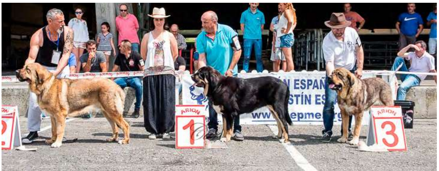
PODIUM JOVENES HEMBRAS