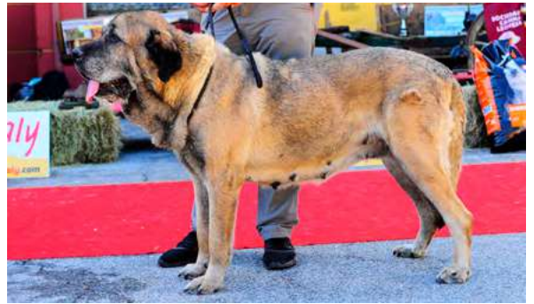
EXC 2º - BRUTA I DE AUTOCÁN

9 años- Boca completa y tjera. Perra típica, talla correcta, mucho hueso, bonita cabeza, excelentes angulaciones y muy buen movimiento.