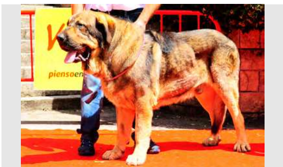
EXC 7º - SULTAN DE CASATRONES

2,5 años. Boca en pinza, Bien construido B talla, MB hueso. Cráneo un poco plano. EXC. línea dorsal y ventral. MB pecho. EXC. angulación delantera, MB la trasera. MB movimiento.