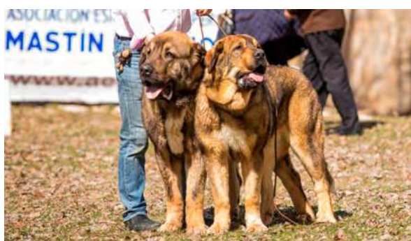
JAKO Y JARA DE LOS ARÁNDANOS