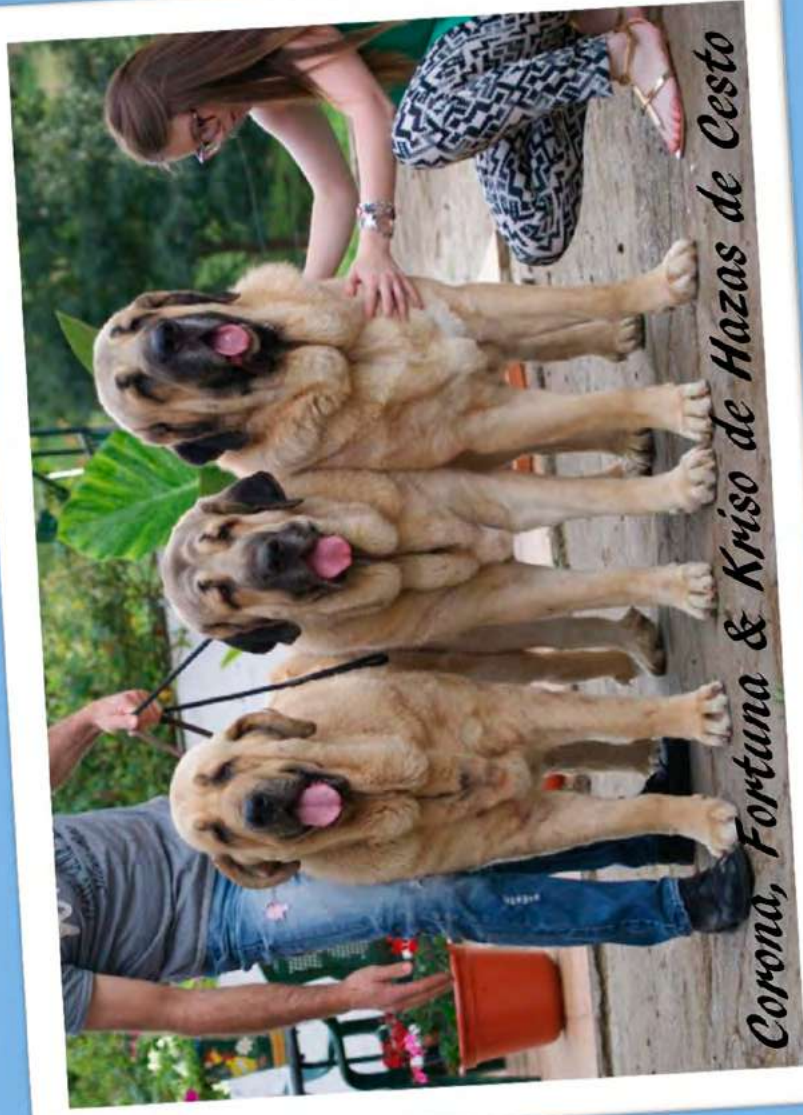
Corona, Fortuna & Kriso de Hazas de Cesto