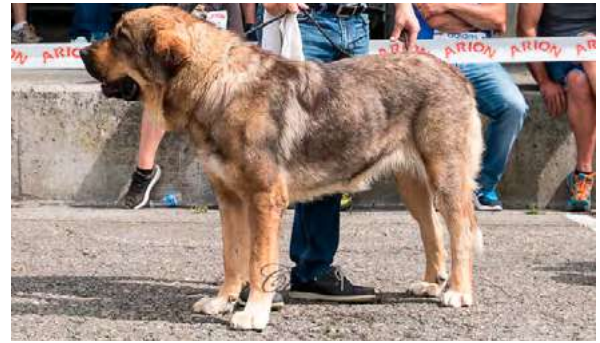
EXC 3° - JARA DE LOS ARANDANOS

10 meses, EXC. Tamaño y aspecto general, EXC proporciones cráneo/hocico, tijera, desearía ojo más oscuro, EXC. Oreja, línea dorsal ventral, angulaciones delanteras y traseras, aplomos y movimiento.