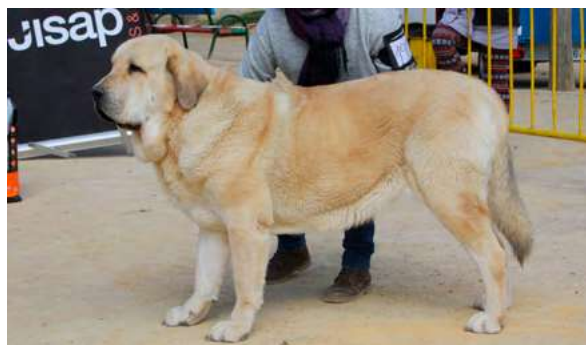
EXC 2º- CAMPERA DE PICU MORU

24 Meses, boca en tenaza, buena masa hueso y línea dorsal, muy buenas angulaciones movimiento muy bueno.