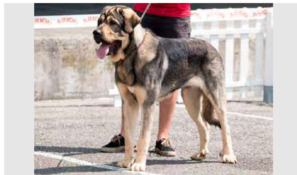
EXC 4°- DUQUE

18 meses, masivo, EXC. proporciones, cráneo/hocico. Tijera, incisivos desgastados, falta P2, desearía ojos más oscuros, EXC. orejas, MB línea dorsal, EXC. angulaciones. Se presenta en excesiva condición corporal lo que perjudica su movimiento y aplomos posteriores.