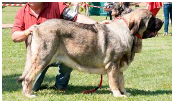
EXC 2° - ALCAZABA DE FUENTE DEL GRAJERO

Boca, ojos, oreja y pelo correctos. Proporciones correctas. Cabeza y expresión típica. Cuerpo correcto. Extremidades correctas. Movimiento correcto