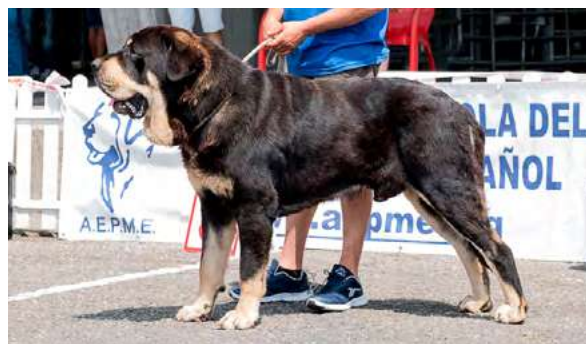
EXC 7º - ECO DE LOS ARANDANOS

2 años, EXC. construcción, proporciones cráneo/hocico y orejas. Boca en pinza, ojos casi color avellana. Línea dorsal ligeramente blanda, EXC. angulaciones delanteras y traseras, aplomos y exc. movimiento con amplitud y empuje.