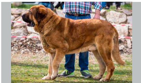
EXC 5° - TIBET

5 años. Excelente talla, hueso y estructura general, le falta un poco de anchura de pecho, buen pelo, cabeza buenas proporciones pero stop un poco marcado. Ojos buen color, párpados un poco cerrados, oreja buena forma pero implantada un poco alta.