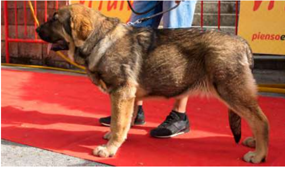
MB 4° - BRAÑA II DE FILANDÓN

Boca, ojos, oreja y pelo correcto, MB extremidades y movimiento, B cabeza, proporciones y cuerpo. Cuello corto.