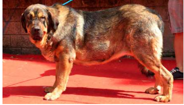
EXC 10° - BRASIL DE FILANDON

13 meses. Boca completa, ojo oscuro. B aspecto general. B oreja un poco grande, costilla plana, EXC, angulación delantera y trasera. B movimiento.