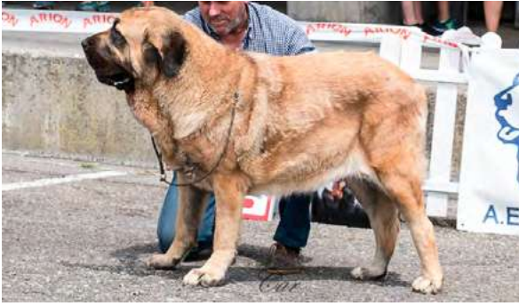
EXC 4° - BORA DE BASILLON

21 meses, armónica, proporcionada. Exc. proporción cráneo/hocico, pinza, ojo ligeramente claro, EXC. orejas, línea dorsal y ventral y angulación delantera. Manos vencidas, B angulación trasera, MB movimiento.