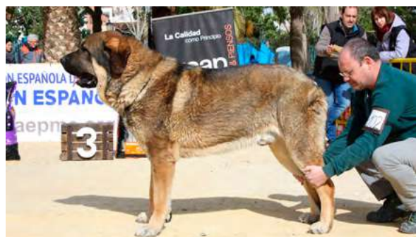
EXC 1º - HIELO DE ALZAVARAN

23 Meses, buena boca, cabeza y pesada, muy buena talla rectángulo, excelente línea dorsal y angulaciones movimiento excelente.