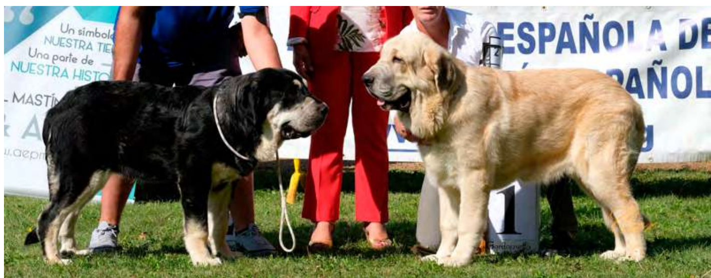
PODIUM CACHORRO ABSOLUTO