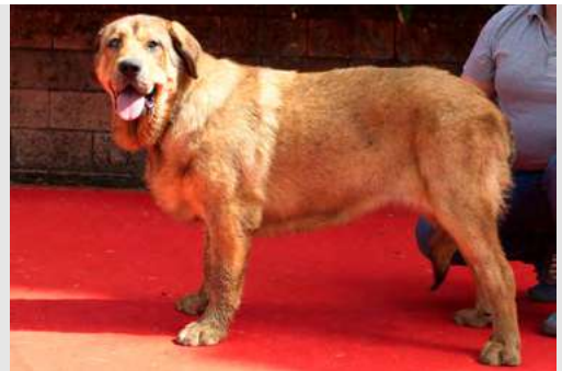
EXC 13° - JORGITA DE SERYLU

14 meses. Boca y ojos óptimos, oreja correcta, buena talla, cráneo algo estrecho. MB costilla. NB angulaciones delanteras, B la trasera, movimiento correcto.