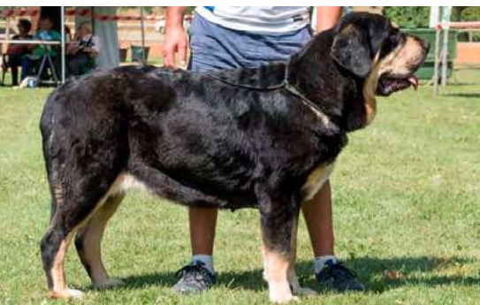
EXC 6º - CARBONERA DE LA RABIZA

Boca, ojos, oreja y pelo correctos. Proporciones óptimas. Cabeza y expresión muy típicas. Cuerpo óptimo. Extremidades óptimas. Movimiento correcto