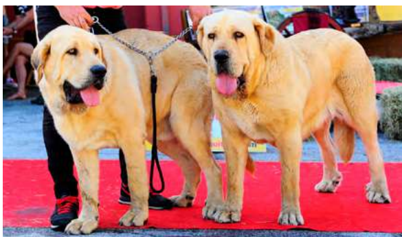
JORGITO Y FABIOLA DE SERYLU