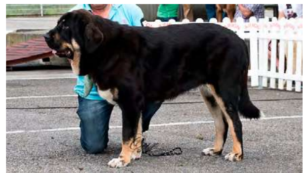
EXC 1º M.J. - KONGA DEL PICU SAN MARTIN

11 meses, EXC. Construcción y proporciones, EXC. Cabeza y proporciones craneo/hocico, boca en tijera, ojo ligeramente claro, controlar parpado superior, EXC. Tamaño de orejas implantación y forma, EXC. Pieles, línea dorsal y ventral y angulaciones delanteras, escasa angulación trasera. EXC. Movimiento.