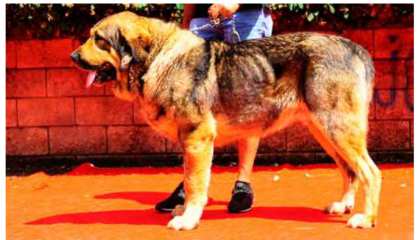
EXC 6º - RANGO DE LOS PISCARDOS

4 años. Boca y ojos correctos, oreja óptima, típico, bonita cabeza y expresión, correcto costillar, MB angulaciones delanteras y justas las traseras B movimiento. EXC. pigmentación.