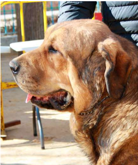
ZARPAS DE LA VICHERIZA