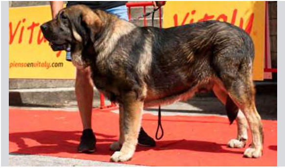
EXC 1° - BARRO DE LOS PISCARDOS

23 meses. 23 meses. MB aspecto general. Muy equilibrado. EXC. hueso. MB cabeza, EXC. hocico, costilla y angulaciones