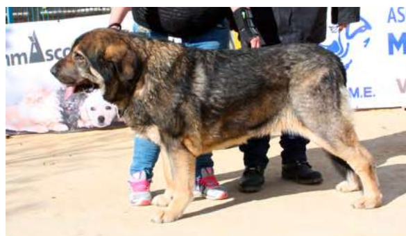
KIMBA DE LA CAMPERONA