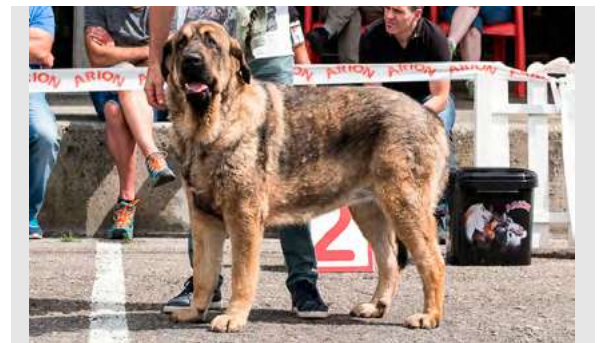
EXC 5° - ASIA DE LA GRITSANDANA

15 meses, construcción armónica, EXC proporciones cráneo-hocico, ojos color avellana, tijera, Buena oreja ligeramente grande, con EXC. inserción y forma, pelo de verano, buenas pieles, EXC. angulación delantera, trasera. EXC. movimiento con B empuje.