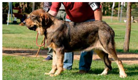
MB 5º - XENA DE GUADALENTÍN

Boca, ojos, oreja y pelo correctos. Proporciones correctas, cabeza y expresión correctas. Cuerpo óptimo. Extremidades y movimiento correctos.