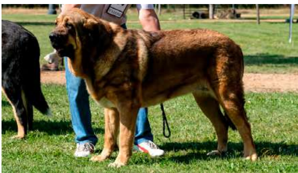
EXC 3º - XENA DE PICU SAN MARTÍN

Boca, ojos, oreja y pelo correctos. Proporciones óptimas. Deseable cráneo mas ancho. Cuerpo óptimo. Extremidades óptimas. Movimiento óptimo.