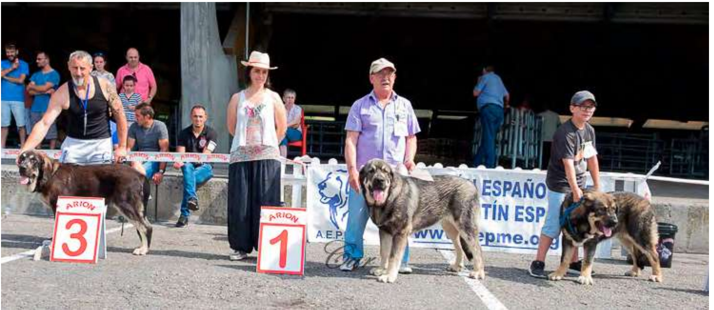
PODIUM CACHORROS MACHOS