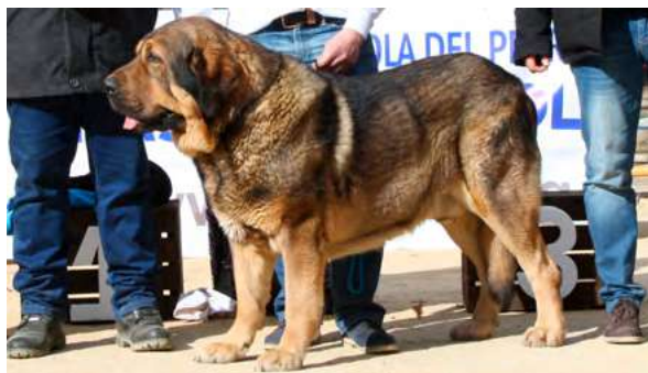
TRECHO DE FILANDÓN