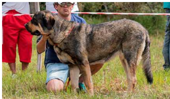
EXC 1° - LOLA DE PARAMERAS Y ALCARRIAS

21 meses, deseable expresión más típica y líneas cráneo-faciales más divergentes, inserción oreja ligeramente trasera; grupa algo elevada; buen pecho, hueso y angulación delantera; buenas pieles. Movimiento correcto.