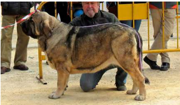
EXC - ALCAZABA DE FUENTE GRAGERO

12 Meses, buena boca, cabeza, oreja, manto, angulaciones, femenina atlética, excelente línea dorsal, movimiento alegre.