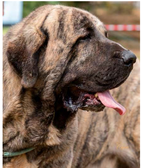
ORGAZ DAS UCES