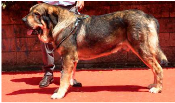
EXC 17° - CESTO DE FILANDON

2 años. Boca correcta. Exc hocico, cráneo ancho y algo plano. B angulaciones delanteras y traseras. Movimiento correcto.