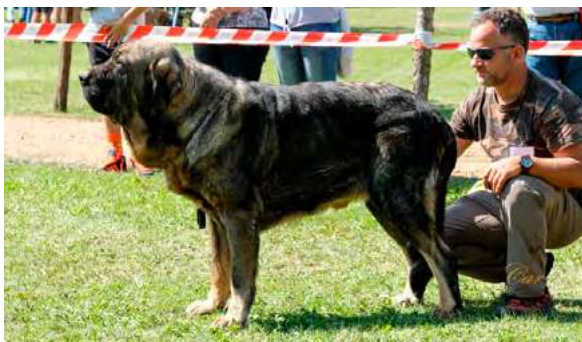
EXC 3° - JUANÓN DE TIERRA DE ORBIGO

Boca, ojos, oreja y pelo correctos. Proporciones óptimas. Cabeza y expresión correcta. Se deja ver parte de la conjuntiva. Cuerpo óptimo. Extremidades correctas. Movimiento correcto.