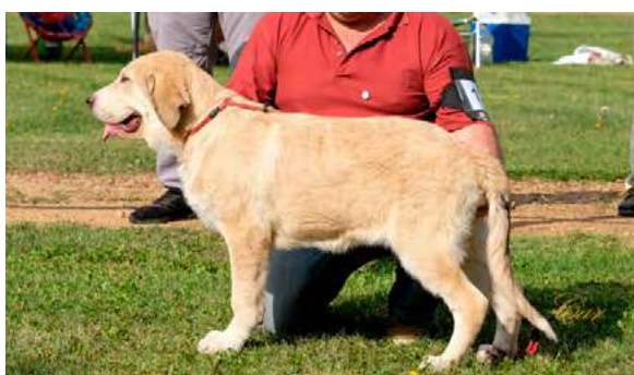
B 4° - MARGARITA DE SERLYU

Boca correcta. Ojos correctos. Oreja correcta. Pelo correcto. Proporciones correctas. Cabeza y expresión típica. Cuerpo correcto. Extremidades correctas. Movimiento deseable más fluido