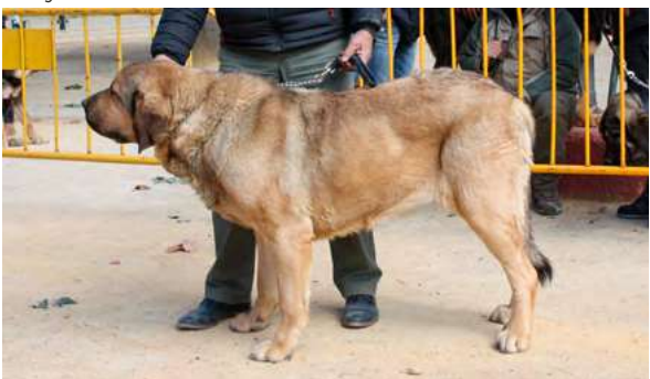
EXC - DULCINEA DEL PESEBRILLO

3 Años buena boca, cabeza muy típica y expresión, muy buenas pieles, frente aplomos y manto, excelente línea superior, angulación trasera algo abierta, movimiento muy bueno.