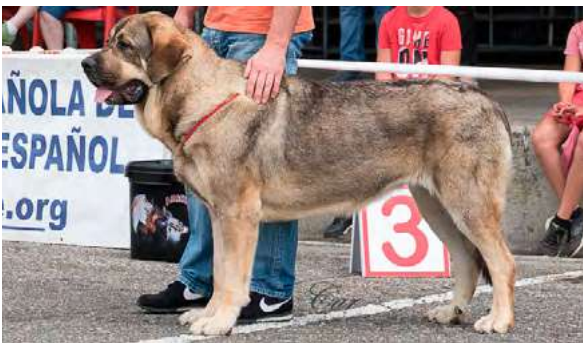
EXC 4° - GALA DE ENTREXALDAS

14 meses, EXC proporciones general, proporciones cráneo/hocico. Boca en pinza, ojos ligeramente claros, EXC. Forma e inserción orejas, EXC. Angulación delantera y trasera, desearía algo más de sustancia. Movimiento EXC