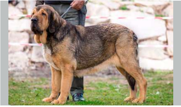
EXC 5° - ASTURICA DE BUXIONTE

4 años. Un poco justa de talla, excelente hueso, cabeza con buenas proporciones aunque me gustaría un poco más limpia de arruga en los ojos, ojos de excelente color y mordida en pinza, la oreja podría ser un poco más pequeña.