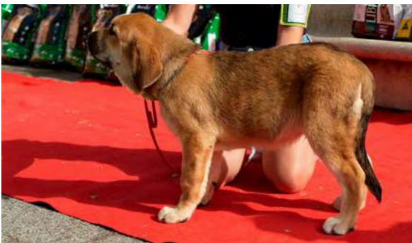
MB 3° - FLOKY DE AMDECE DE NAVA

Muy buena cabeza y expresión, MB boca, ojos, oreja, pelo, angulaciones delanteras y traseras, y MB movimiento. Cachorro largo, muy típico.