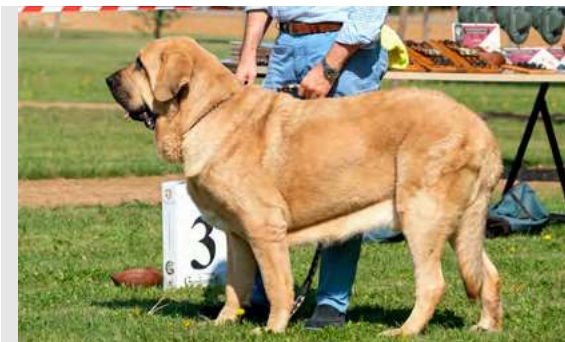
EXC 3º- TORMES DE FUENTE GRANJERO

Boca, ojos, orejas, pelo correctos. (ojo deseable más oscuro). Proporciones correctas. Cabeza y expresión muy típicas. Cuerpo correcto. Extremidades correctas. Movimiento correcto