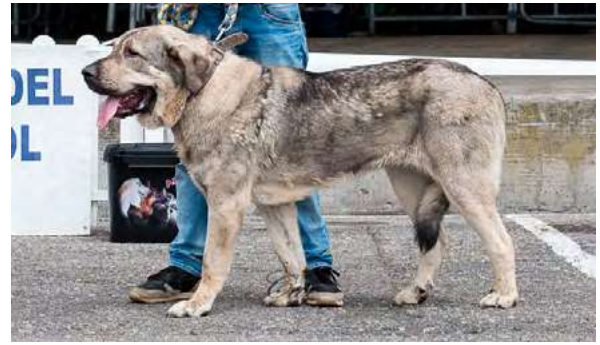
EXC 5° - LAILA

21 meses, armónica, proporcionada. Exc. proporción cráneo/hocico, pinza, ojo ligeramente claro, EXC. orejas, línea dorsal y ventral y angulación delantera. Manos vencidas, B angulación trasera, MB movimiento.