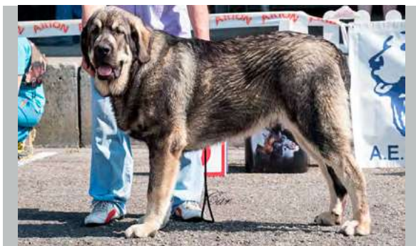
MB 1º - OSO DE AUTOCAN

7,5 meses, MB construcción, MB proporciones cabeza –cráneo- hocico, ojos color avellana, B forma y tamaño orejas, piel suelta, MB calidad de pelo, MB angulaciones delanteras y trasera, pinza, MB empuje trasero.