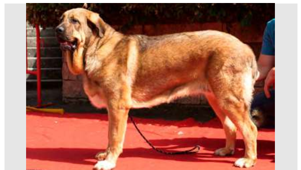
EXC 8° - XENA DEL PICU SAN MARTÍN

16 meses. Boca correcta, típica, bien construida, MB pieles y MB costillar. Hocico un poco largo. EXC. angulaciones. Hueso correcto. B movimiento, con línea superior algo débil.