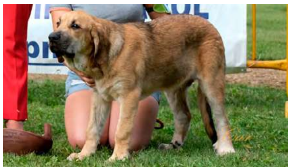
MB 1° - FLOKY DE AMDECE DE NAVA

Boca correcta. Ojos correctos. Oreja correcta. Pelo correcto. Proporciones correctas. Cabeza y expresión típica. Cuerpo correcto. Extremidades correctas. Movimiento correcto.