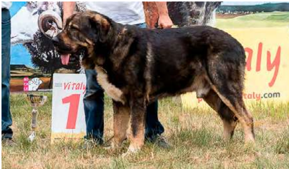
VALLE DE FILANDÓN