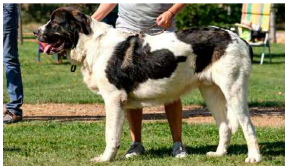
B 7º - KAISER DE ARANDANOS

Boca correcta. Ojo tercer parpado visible. Oreja y pelo correctos. Cabeza y expresión típica. Cuerpo correcto. Extremidades correctas. Movimiento fluido con carpos débiles.