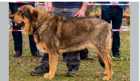
EXC 3° - DIANA DE LA RABIZA

3 años. Perra de buena talla con excelente hueso, excelente cabeza con buena expresión, la oreja triangular y bien implantada, ojos suficientemente oscuros y mordida en tijera, excelentes angulaciones delanteras y traseras, cuando se relaja se mueve bien.