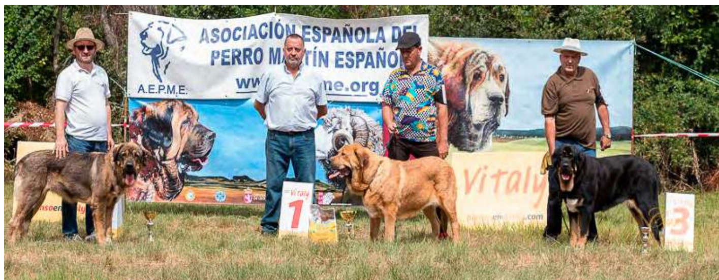
PODIUM JOVEN HEMBRAS