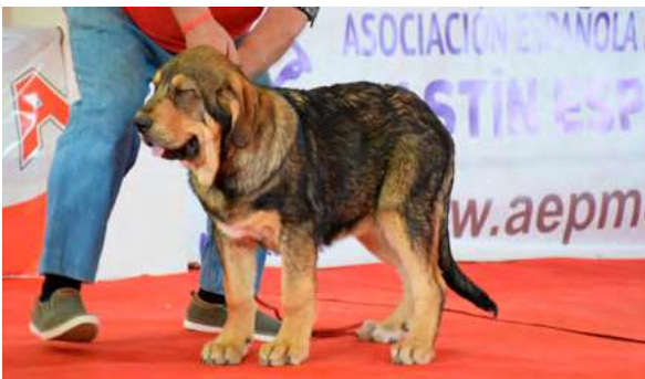
MB 1º M.M.C. - XENA DE GUADALENTIN