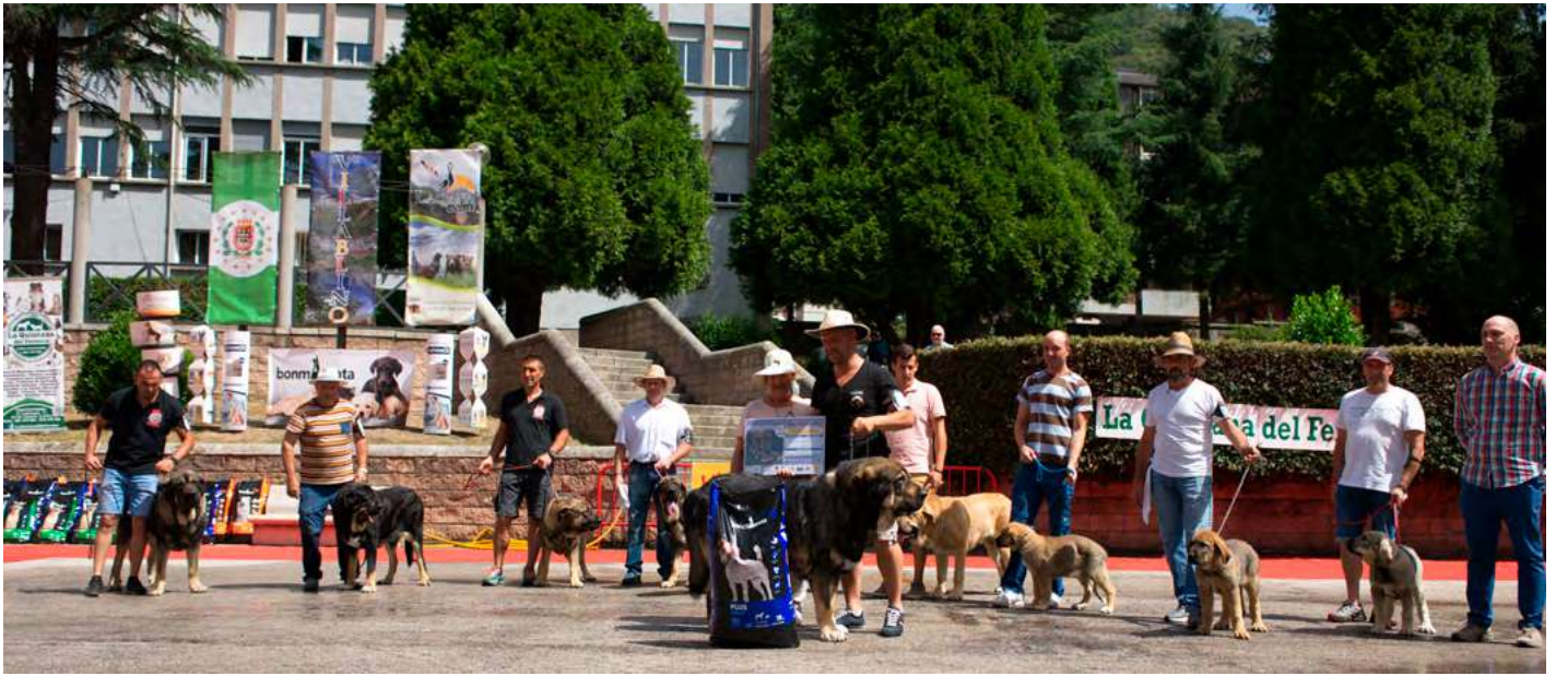
PODIUM LOTE DE CRIA