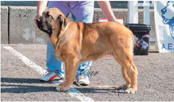
MB 1º M.M.C. - CALA DE AUTOCAN

3,5 meses, MB proporciones y construcción, correcta cabeza, para su edad ojos oscuros, MB implantación y forma de orejas, MB Línea dorsal y ventral, MB angulación anterior y posterior, movimiento con gran empuje. Pelo de verano.