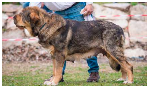
EXC 2° - BRUJA I DE FILANDON

Casi 3 años. Excelente talla y hueso, perra larga bien construida, excelente pelo, excelente color y colocación de ojos, cráneo y hocico potentes, oreja bien implantada pero podría ser más pequeña, angulaciones justas, excelente movimiento.