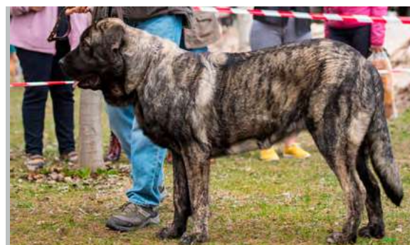
B - QUIS

11 meses. Le falta desarrollo general, es muy corta, cabeza con buen color de ojos, buen hocico, mordida en tijera, la línea dorsal un poco encarpada y la grupa caída.