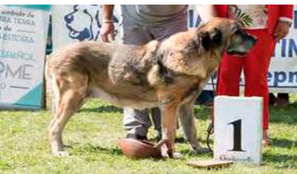
EXC 1º - BRUTA DE AUTOCAN