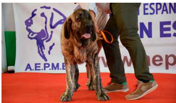
MB 3° - PLOMO DE GUSTAMORES