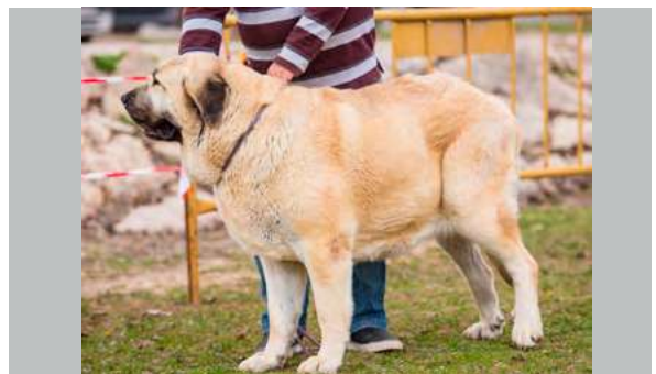
EXC - CANICA DE FUENTE DEL GRAJERO

Talla suficiente, buen hueso, larga con buen costillar, falta un poco de cuello para lo ancho que es, la cabeza podría tener mejores proporciones, buenos ojos, boca correcta, muy buenas las angulaciones delanteras y escasas las traseras.