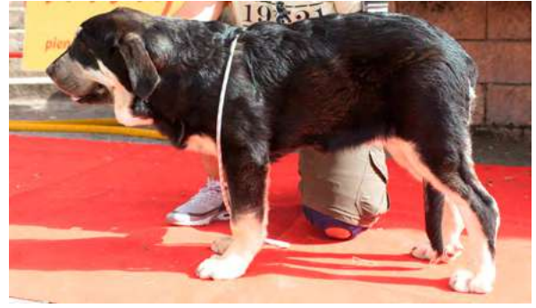
MB 5° - RIVERITA DE ARASANZ

Boca, ojos, oreja y pelo correcto, MB extremidades y movimiento, B cabeza, proporciones y cuerpo. Cuello corto.