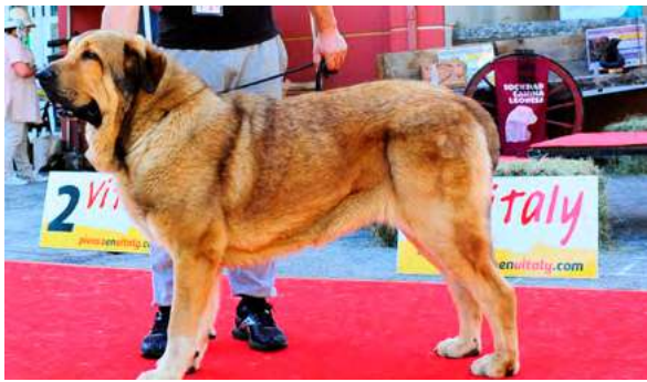
CRISTU DEL RASGO