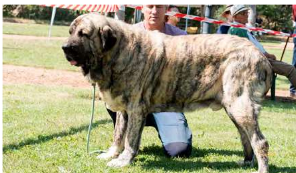
EXC 4° - ORGAZ DAS UCES

Boca, ojos, oreja y pelo correctos. Proporciones óptimas. Cabeza y expresión muy típicas. Cuerpo óptimo. Extremidades correctas. Movimiento óptimo