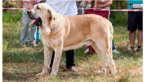
EXC 2° - KINTERO DE LA VEGA DEL PORMA

12 meses, dentadura OK, ojos claros, masculino; muy buena cabeza, línea dorsal y grupa; aplomos traseros correctos, muy buen pecho, excelente pelo y pieles, excelente movimiento.