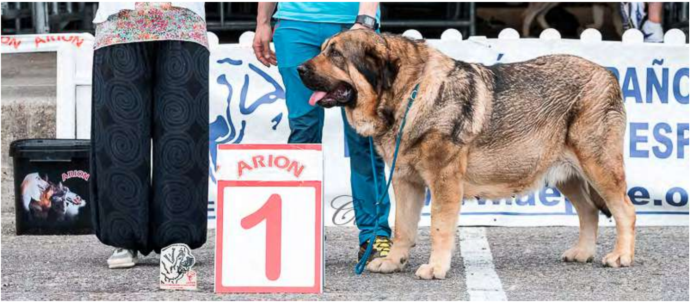
PODIUM MEJOR HEMBRA