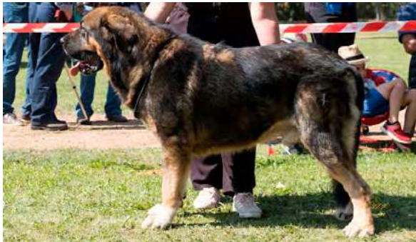
EXC 10° - YACO DE LA CAMPERONA

Boca, ojos, oreja y pelo correctos. Proporciones correctas. Cabeza y expresión típicas. Cuerpo óptimo. Extremidades óptimas. Movimiento correcto. Deseable mas anchura de pecho