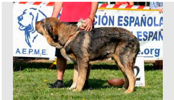
EXC 6º- SEVIL DE LOS PISCARDOS

Boca en pinza. Ojos, oreja y pelo correctos. Proporciones correctas. Cabeza y expresión típica. Cuerpo correcto. Extremidades correctas. Movimiento correcto.