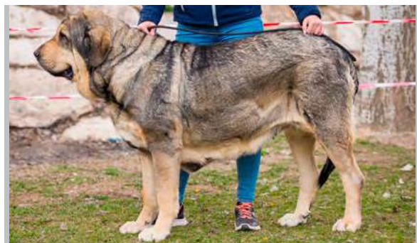
EXC 4° - AFRICA DE GUADARRAMA

3 años. Excelente talla, hueso, estructura y angulaciones, cabeza con buenas proporciones, ojos oscuros, la oreja me gustaría más pequeña y la mordida en tijera muy justa, los párpados me gustaría más pegados, movimiento correcto.