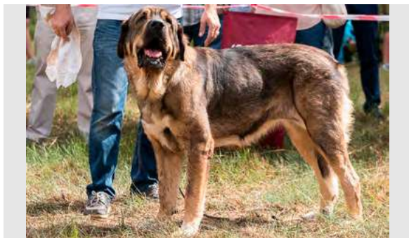
EXC 2° - JARA DE LOS ARÁNDANOS

12 meses, boca ok. típica, femenina, armónica, muy buena cabeza, cruz, grupa, línea superior e inferior, y angulaciones delanteras; excelente pecho, buen pelo y pieles, excelente movimiento abarcando terreno.