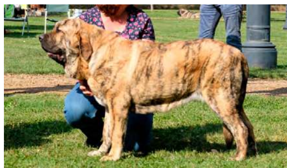
MB 6º - GORGEOUS GIRL TORNADO ERBEN

Boca, ojos, oreja y pelo correctos. Proporciones correctas. Cabeza y expresión: Deseable cráneo más ancho. Cuerpo correcto. Extremidades correctas