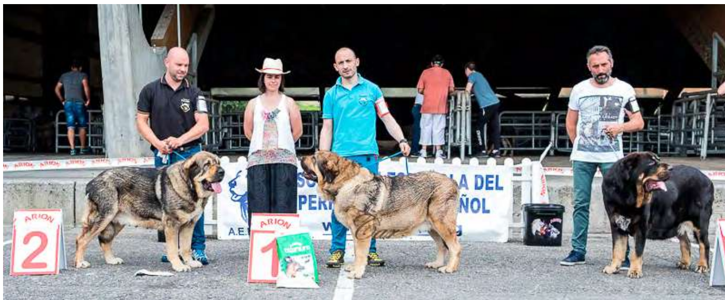
PODIUM ABIERTA HEMBRAS