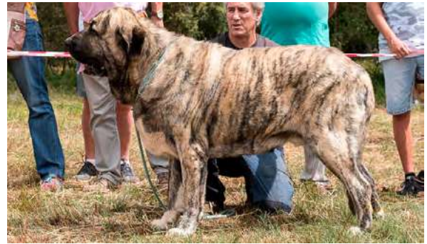
EXC 2º- ORGAZ DAS UCES

3 años, dentadura ok, muy típico, excelente cabeza, masculino, bien construido, buen color de ojos, orejas ligeramente plegadas hacia atrás, muy buenas líneas superior e inferior; buena grupa; excelente pecho, buenos aplomos, angulaciones y pieles, buen movimiento potente y abarcando terreno.