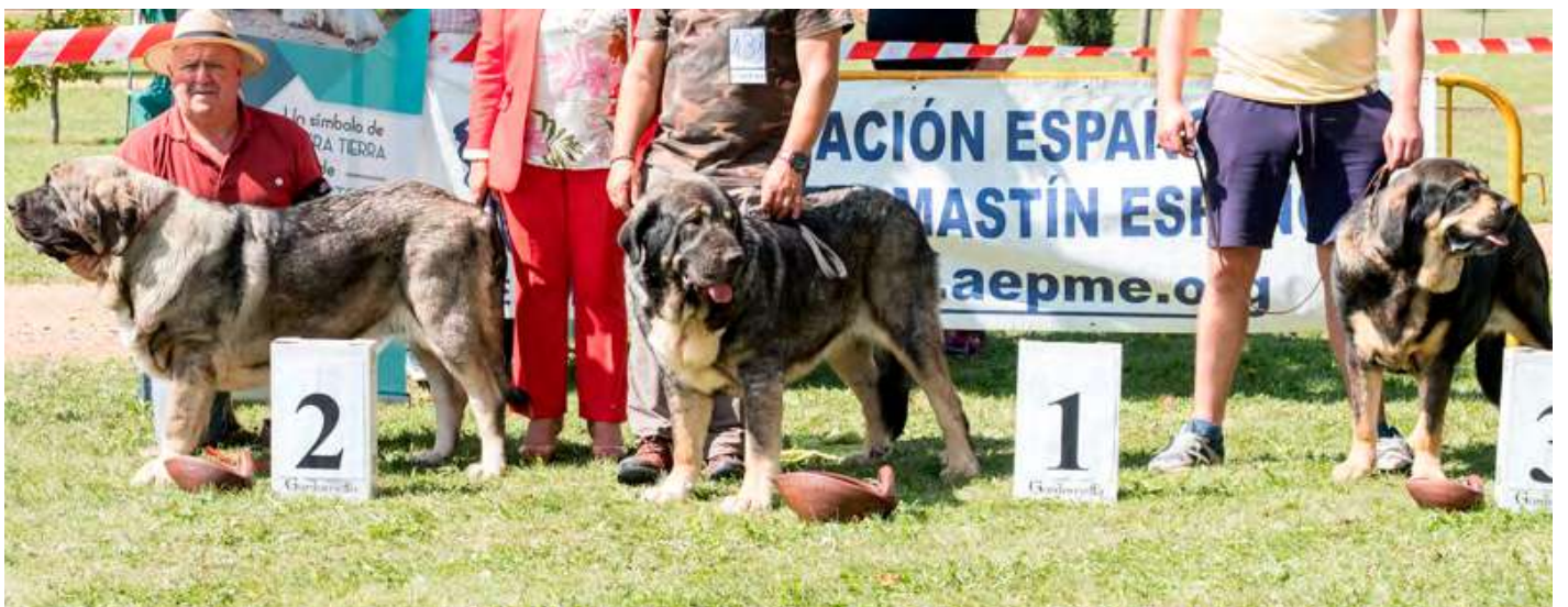
PODIUM INTERMEDIA HEMBRA