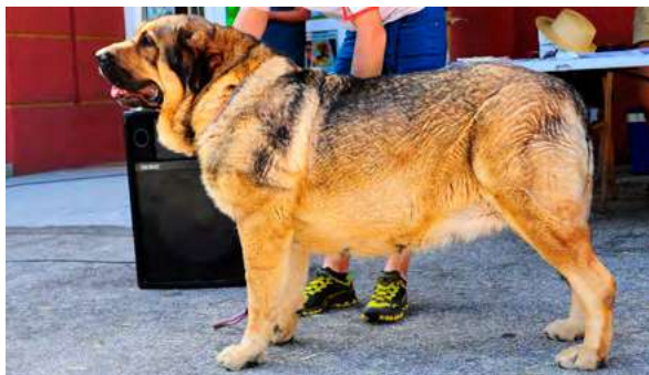
EXC 1° - LUPE DE FILANDÓN

Boca y ojos correctos, óptima oreja, EXC. aspecto general, perra típica, bien construida, Masiva. EXC. hueso, costillar, línea superior e inferior, angulaciones y movimiento. MB cabeza y proporciones cráneo-hocico.