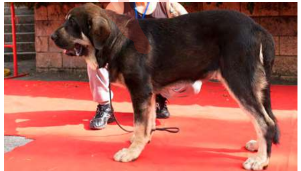
MB 2° - TRASTU DEL RAIGUSU

Boca, ojos, oreja y pelo correcto. Cachorro muy masivo, MB cráneo, costillar y angulaciones, B hocico, stop un poco marcado. B movimiento.