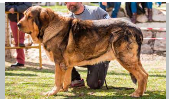
EXC 3º - NEVERO DE FILANDÓN

3 años. Excelente talla, estructura y hueso, ojos suficientemente oscuros, cráneo y hocico potentes, mordida en pinza, buenas orejas, movimiento me gustaría línea dorsal horizontal.