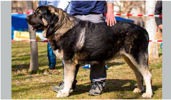
EXC 2° - SANSÓN DE LA PORTIECHA

16 meses. Buena talla, hueso suficiente, buenas proporciones, bonita cabeza, el ojo permitido pero podría ser más oscuro, excelentes líneas dorsal y ventral, las angulaciones un poco justas, movimiento compensado.