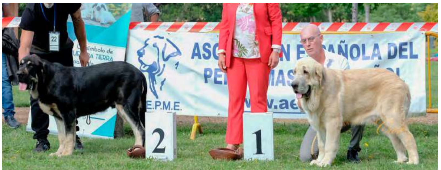
PODIUM CACHORRO MACHO