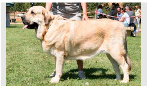
EXC 3º - C.H. J. CAMPERA DE PICU MORU

Boca y ojos correctos. Oreja óptima, muy bien implantada. Pelo correcto. Proporciones óptimas. Cabeza y expresión muy típicas. Cuerpo óptimo. Extremidades óptimas. Movimiento óptimo