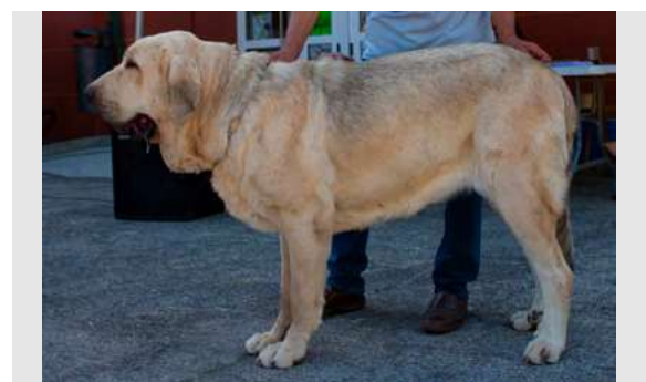
EXC 10° - ZAGUERA DE GALISANCHO

Boca correcta, perra típica y rústica, proporciones cráneo-hocico excelentes. EXC. cabeza y expresión. Masiva, B hueso, línea dorsal, angulaciones y movimiento. Grupa algo derribada.