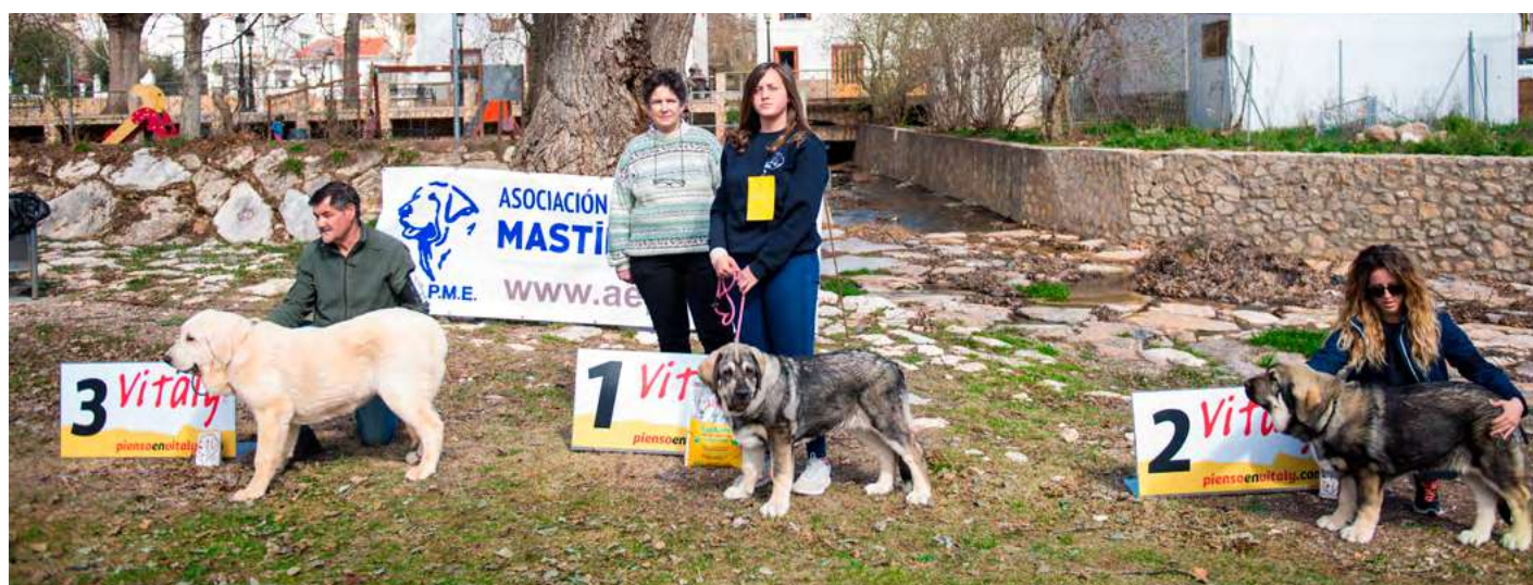
PODIUM MUY CACHORROS HEMBRAS