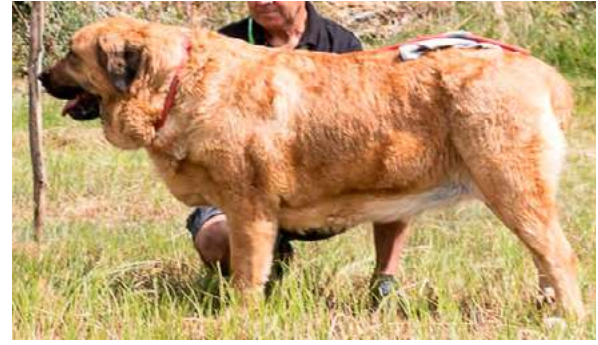
EXC 6° - MINERVA

3 años, dentadura correcta, muy típica, femenina, buena expresión, preferible cráneo más ancho, buena cruz y buenas angulaciones y buen pecho descendido. Bracea y saca codos.