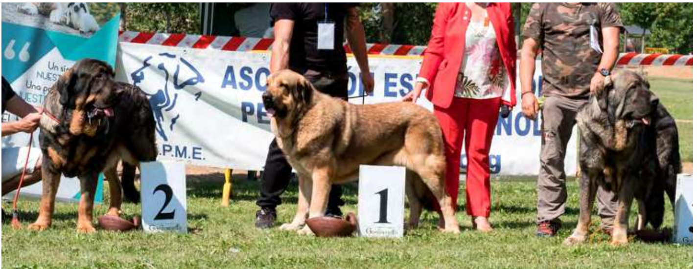
PODIUM INTERMEDIA MACHO