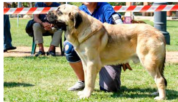
EXC 4° - KAIRO DE ARASANZ

Boca en pinza. Ojos, oreja y pelo correctos. Proporciones correctas. Cabeza y expresión típica. Cuerpo correcto. Extremidades correctas. Movimiento deseable más fluido.