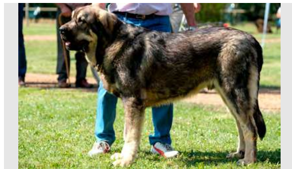
EXC 4º - OSO DE AUTOCÁN

Boca correcta. Ojo deseable más claro. Oreja y pelo correcto. Proporciones correctas. Cabeza y expresión correcta. Cuerpo correcto. Extremidades correctas. Cruza manos. Movimiento fluido