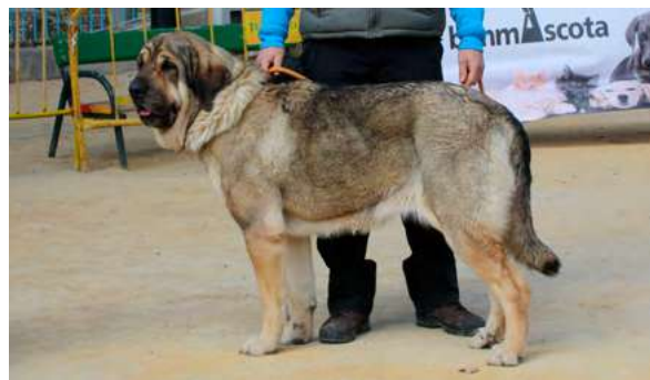
EXC - GRULLA

32 Meses, buena boca, grande masiva pecho ancho, hombros desarrollados podría tener mas pelo, buenas angulaciones, movimiento excelente.