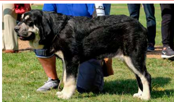
MB 1º - RIVERITA DE ARASANZ

Boca, ojos, oreja y pelo correctos. Proporciones óptimas. Cabeza y expresión óptimas. Cuerpo óptimo. Extremidades óptimas. Carpos débiles