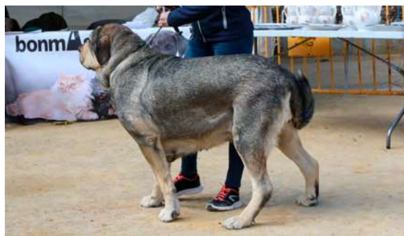
EXC - AFRICA DE GUADARRAMA

3 Años buena boca, buena talla, cabeza típica, pieles, excelente línea dorsal, angulaciones muy buenas, movimiento muy bueno.