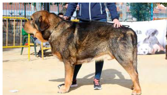
EXC 2º - BALAM DE ANDECE DE NAVA

23 Meses, buena boca, cabeza y pesada, muy buena talla rectángulo, excelente línea dorsal y angulaciones movimiento excelente.