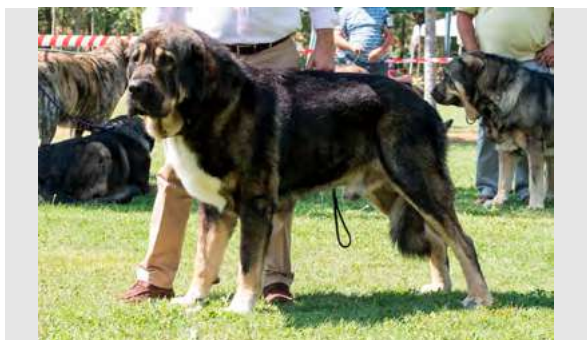
EXC 11° - VALLE DE FILANDÓN

Boca, ojos, oreja y pelo correctos. Proporciones óptimas. Cabeza y expresión muy típicas. Cuerpo óptimo. Extremidades óptimas. Deseable mejor movimiento trasero.