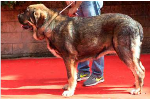
EXC 11° - PESICIA DE CASATRONES

15 meses. Boca y ojos correctos, oreja óptima, Talla correcta, muy larga, típica, cabeza y expresión EXC., MB costillar. EXC. angulación delantera y trasera. B movimiento, líneas superior débil.