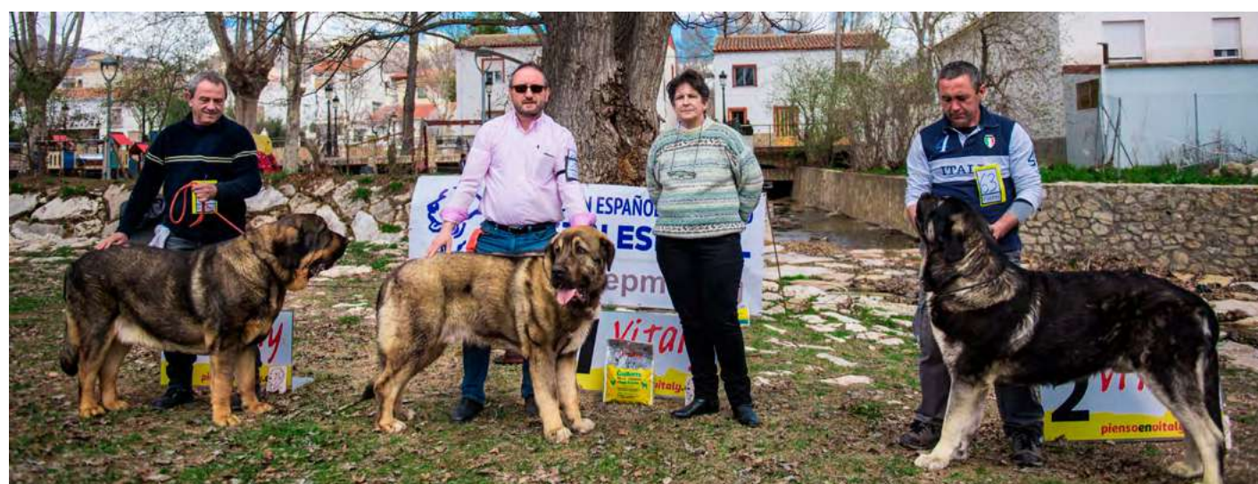
PODIUM JÓVENES MACHOS