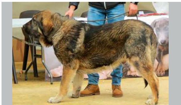
EXC 3° - BARRO DE LOS PISCARDOS

10 Meses buena dentadura talla cabeza bonita y típica, buenos aplomos.