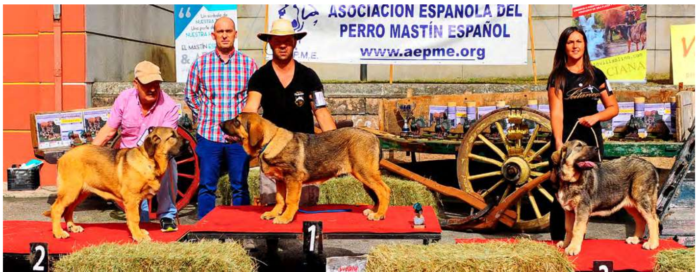
PODIUM MUY CACHORROS HEMBRAS