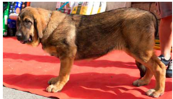
MB 1° M.M.C - BRAÑA III DE FILANDÓN

Boca, ojos, oreja y pelo correcto. Perra larga, MB cabeza y expresión, Cuerpo MB, MB angulaciones y MB movimiento.