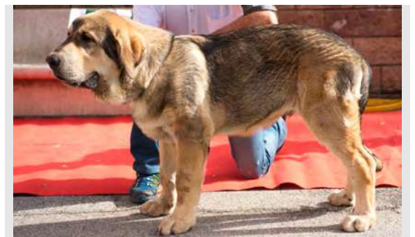
MB 3° - MOCA DE LA FILTROSOSA

Boca, ojos, oreja y pelo correcto. Perra larga, MB cabeza y expresión, Cuerpo MB, MB angulaciones y MB movimiento.