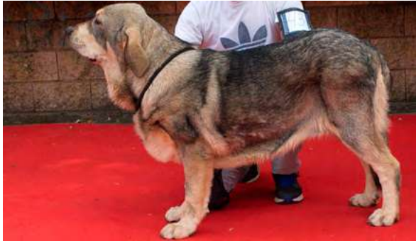
MB 3º - BRAÑA DE BRAÑAS DEL NORTE

Boca, oreja y pelo correcto, ojo un poco claro. Talla correcta, un poco alta de grupa, stop algo marcado. MB angulaciones.