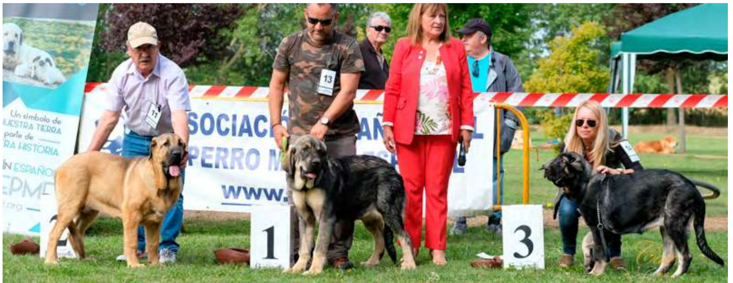
PODIUM CACHORRO HEMBRA