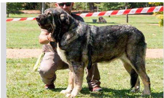
EXC 1° - JARCHA DE TIERRA DE ÓRBIGO

Boca, ojos, oreja y pelo óptimo. Proporciones óptimas. Cabeza y expresión muy típicas. Cuerpo óptimo. Extremidades óptimas. Movimiento óptimo