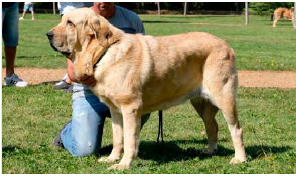
EXC 9° - VENUS DE LA PIRINOLA

Boca, ojos, oreja y pelo correctos. Proporciones óptimas. Cabeza y expresión correcta. Cuerpo óptimo. Deseable más angulación trasera. Movimiento correcto.