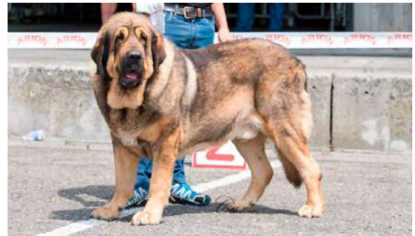
EXC 1° - TRECHO DE FILANDÓN

21 meses, grande, EXC. construcción, grupa ligeramente descendente, proporción cráneo/hocico EXC, tijera, ojo avellana, EXC. oreja, forma tamaño e implantación. EXC., cuello, pieles y pelo, Exc. angulación delantera y Trasera. Movimiento presenta cojera con lesión en almohadilla.