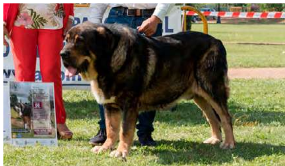
BRIO DE FILANDÓN