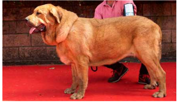
EXC 2° - JULIE DE SERYLU

11 meses. Óptima boca y pelo. Ojos correctos. EXC. talla, perra muy típica. EXC. cabeza, expresión y papada. EXC. angulación delantera, algo justa la trasera, Movimiento Exc.