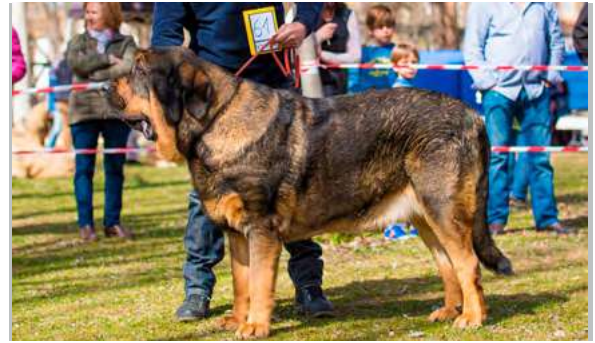
EXC 3° - LOLO DE PANAMERAS Y ALCARRIAS

16 meses. Buena talla, hueso suficiente, buenas proporciones, bonita cabeza, el ojo permitido pero podría ser más oscuro, excelentes líneas dorsal y ventral, las angulaciones un poco justas, movimiento compensado.