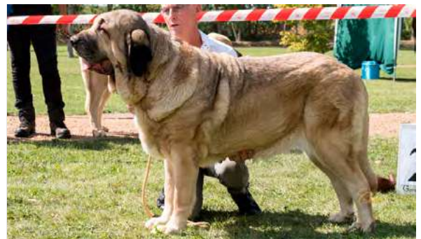
FORTUNA DE HAZAS DE CESTO