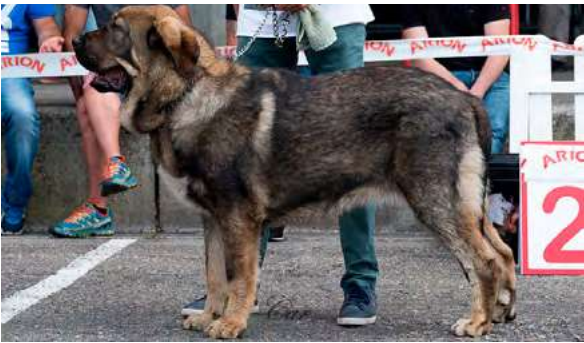
MB 3º - PESICIA DE CASATRONES

7 meses, MB proporciones, hueso, forma, tamaño, pieles y pelo. Tijera, ojo deseable más oscuro. Línea dorsal blanda de acuerdo edad, B movimiento con manos ligeramente blandas.