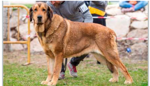
EXC - LLUVIA DE ALZAVARÁN

2 años. Excelente talla y hueso y angulación, cabeza con buenas proporciones, aunque me gustaría hocico más potente, ojos de buen color, mordida en pinza.