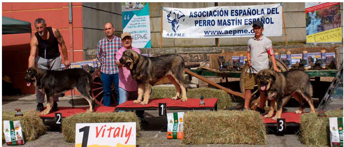
PODIUM CACHORROS MACHOS