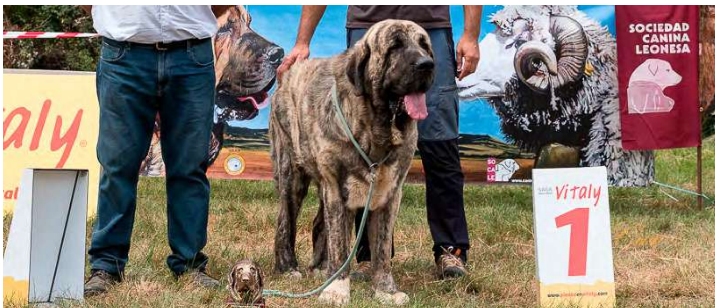
PODIUM MEJOR CABEZA