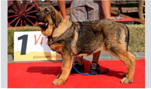
MB 1° - BRUGAL DE FILANDÓN

Muy buena cabeza y expresión, MB boca, ojos, oreja, pelo, angulaciones delanteras y traseras, y MB movimiento. Cachorro largo, muy típico.