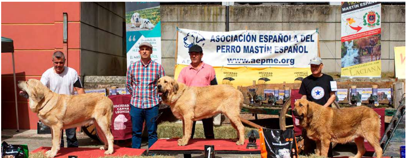
PODIUM JOVENES MACHOS