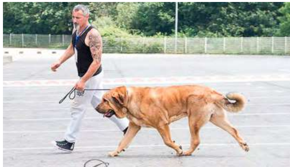
IROCO DE LA CALELLA DE OTUR