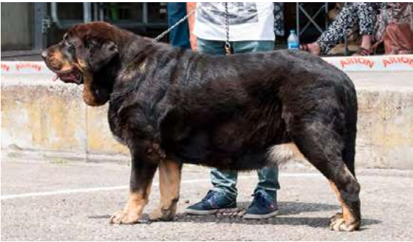
EXC 3° - CHERZA DE RECIECHO

4 años, masiva, EXC. proporción corporal y osamenta, EXC. proporción cráneo/hocico, cabeza potente, tijera, ojo avellano, EXC. orejas, línea superior, angulaciones, pieles y movimiento.