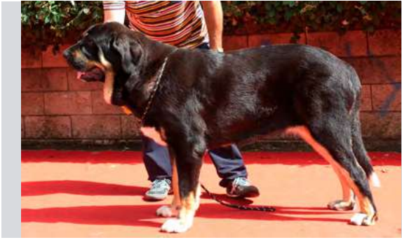
EXC 1° - KONGA DEL PICU SAN MARTÍN

11 meses. Óptima boca y pelo. Ojos correctos. EXC. talla, perra muy típica. EXC. cabeza, expresión y papada. EXC. angulación delantera, algo justa la trasera, Movimiento Exc.