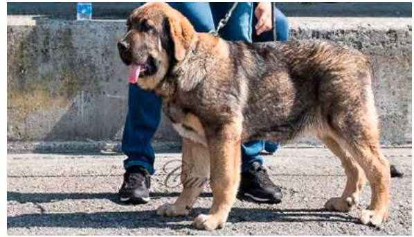
MB 2º - BRAÑA DE FILANDÓN

3,5 meses, MB proporciones y construcción, correcta cabeza, para su edad ojos oscuros, MB implantación y forma de orejas, MB Línea dorsal y ventral, MB angulación anterior y posterior, movimiento con gran empuje. Pelo de verano.