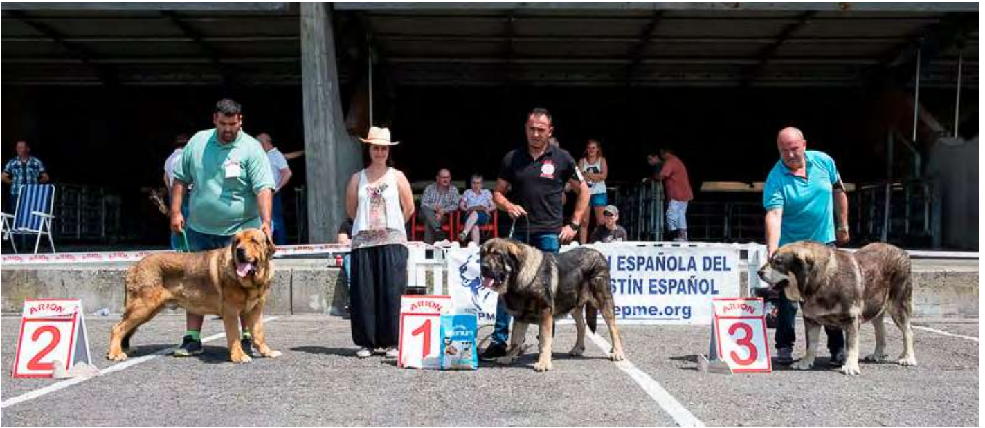
PODIUM INTERMEDIA MACHOS