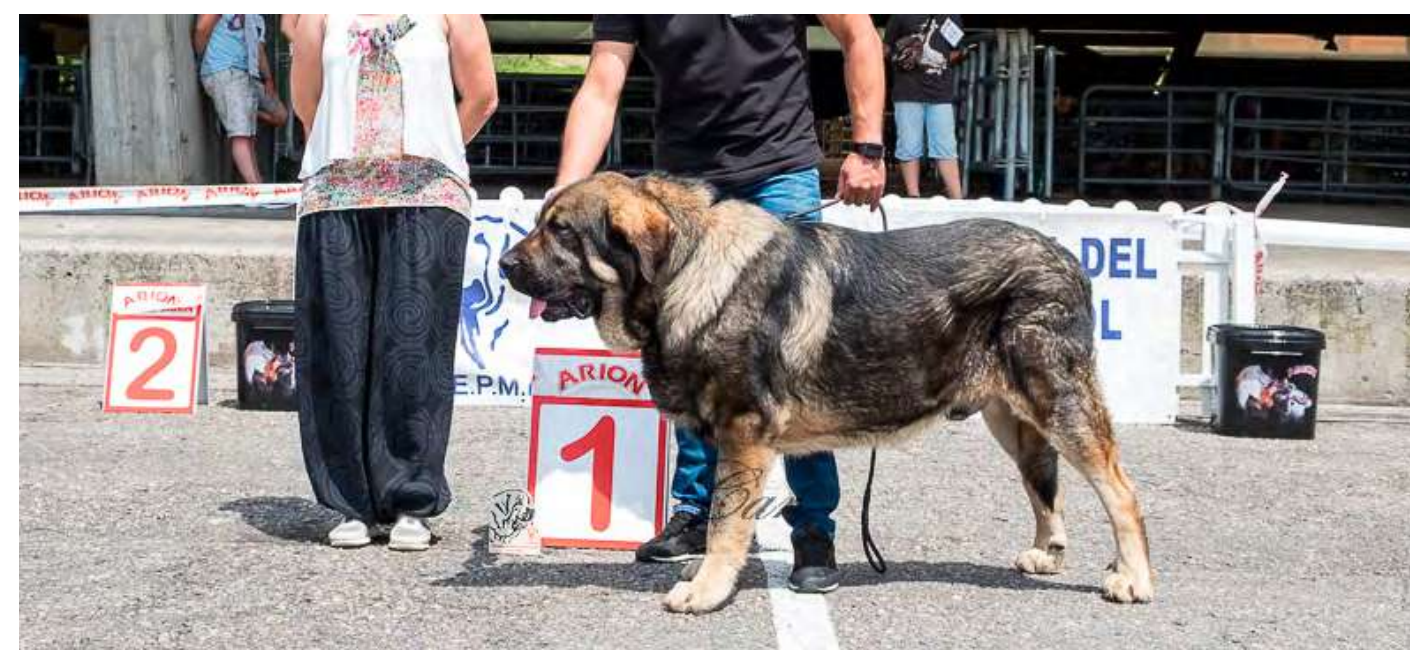
PODIUM MEJOR MACHO