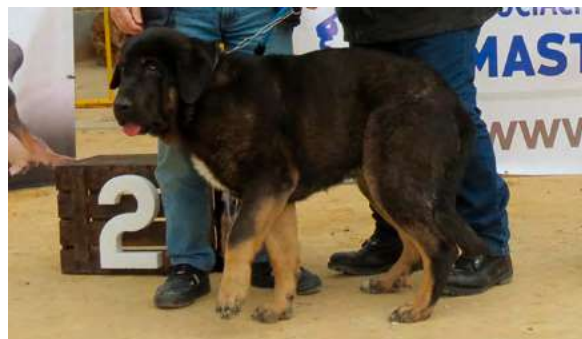
TEO DE PICUXIANA