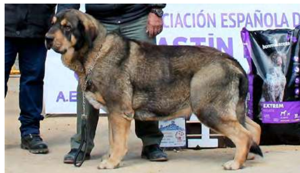
EXC 1º - LUNA DE CASATRONES

19 Meses buena boca cabeza y expresión bonita, buen manto, línea superior, hueso y aplomos, excelente angulaciones, movimiento armonioso debería ser más alegre.