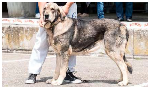
EXC 1° - XENA DEL RAIGUSU

22 meses, alto, ojos color avellana, pinza, EXC. forma y colocación orejas, EXC angulaciones delanteras y traseras, deficiencia en el movimiento por cojera, deseable mejores condiciones físicas, lesión en almohadilla.