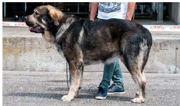
EXC 5º - SOLO DE RECIECHO

3 años, EXC. proporciones generales y cabeza. Pinza incisivos vigilante. Ojo ligeramente claro. EXC. orejas colocación y forma. EXC. Aplomos y angulaciones con manos y pies de gato. EXC. línea dorsal y ventral, EXC. movimiento con gran empuje y amplitud.