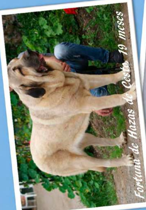
Fortuna de Hazas de Cesto. 19 meses