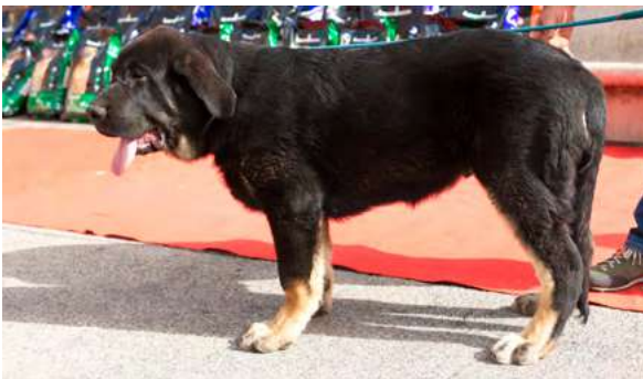
MB 5° - OTELO DE LACIANA

Boca, ojos, oreja, pelo correctos. Perro un poco corto. Cabeza correcta, oreja y poco larga, B. angulaciones, movimiento correcto.