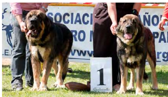
YAKO Y KIMBA DE LA CAMPERONA