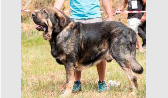
EXC 1º - BROTE DE FILANDÓN

3 años, dentadura ok, muy típico, excelente cabeza, masculino, bien construido, buen color de ojos, orejas ligeramente plegadas hacia atrás, muy buenas líneas superior e inferior; buena grupa; excelente pecho, buenos aplomos, angulaciones y pieles, buen movimiento potente y abarcando terreno.