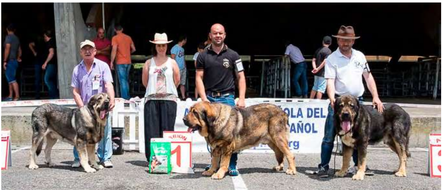
PODIUM ABIERTA MACHOS