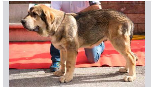
MB 4° - CALECHO DE CASATRONES

Boca, ojos, oreja y pelo correcto. Proporciones correctas, cuello corte, correcta cabeza y expresión, cuerpo un poco cuadrado, MB hueso y angulaciones, movimiento correcto.