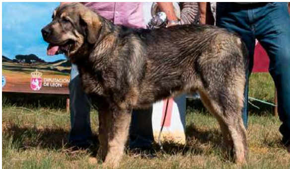
MB 1° - OSO DE AUTOCAN

8 meses, típico, masculino, dentadura correcta y completa, buen color de ojos, buena línea dorsal y grupa; muy buen hueso y aplomos delanteros; buen carácter, angulaciones traseras un poco rectas. Movimiento correcto.