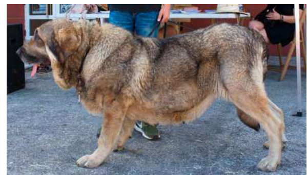
EXC 18° - TROYA DE LOS PISCARDOS

4 años. Boca correcta, ojo un poco claro. Talla correcta, muy larga, buen cuello, línea dorsal ligeramente ensillada. EXC. hocico y angulaciones. Deseable más pecho. MB costillar. Buen movimiento.