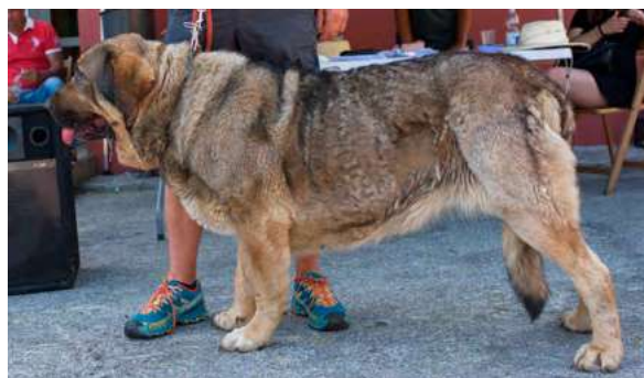
EXC 17° - TURCA DE SALGUEIRON

3 años y 10 meses. Boca correcta, ojo oscuro, oreja un poco alta. EXC. hocico, angulaciones y hueso. MB costillar, movimiento correcto.