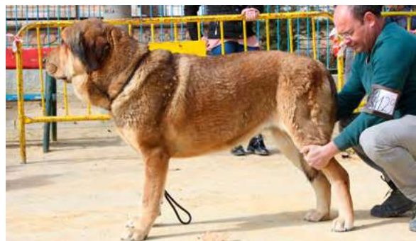
EXC 2º - LLUVIA DE ALZAVARAN

19 Meses buena boca cabeza y expresión bonita, buen manto, línea superior, hueso y aplomos, excelente angulaciones, movimiento armonioso debería ser más alegre.