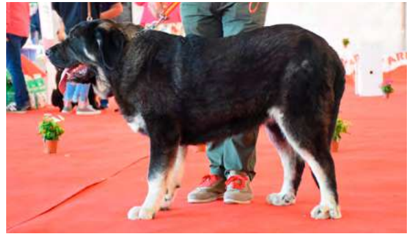
MB 2º - GRINGO DE GUSTAMORES