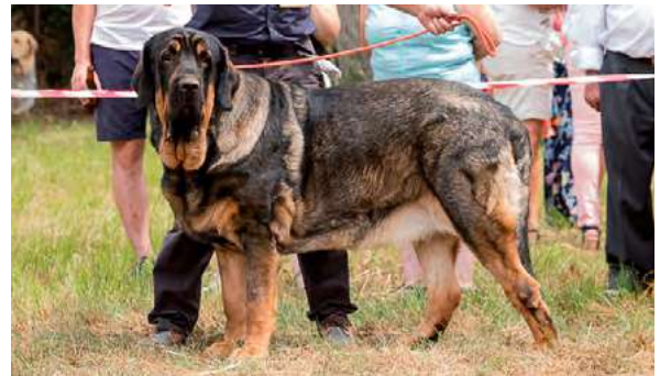
SC - LOLO DE PARAMERAS Y ALCARRIAS

Perro potente y de gran alzada pero con la mordida irregular y deficiente debido a la mala conformación de la mandíbula.