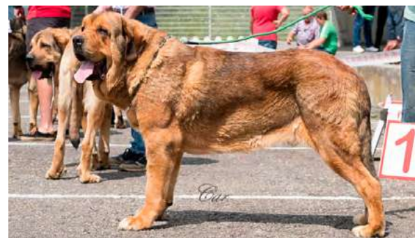
EXC 2° - INDI DEL PICU SAN MARTIN

18 meses, EXC. tamaño y proporción, EXC cráneo y hocico, mordida en tijera, ojos color avellana, vigilar parpado superior, EXC. pelo, línea dorsal y ventral, aplomos, angulaciones, orejas y movimiento con amplitud y empuje.