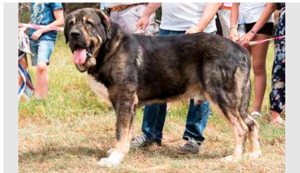
EXC 4º- VALLE DE FILANDÓN

3 años, mordida en pinza. Típico, masculino, solido, muy buena cabeza, buena caña nasal, orejas algo plegadas y de inserción algo baja; buena línea superior e inferior, angulaciones compensadas, buena grupa; movimiento correcto.