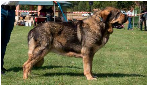
EXC 1º C.A.C. - BRUJA I DE FILANDÓN

Boca, ojos, oreja y pelo correctos. Proporciones óptimas. Cabeza y expresión óptimas, muy típicas