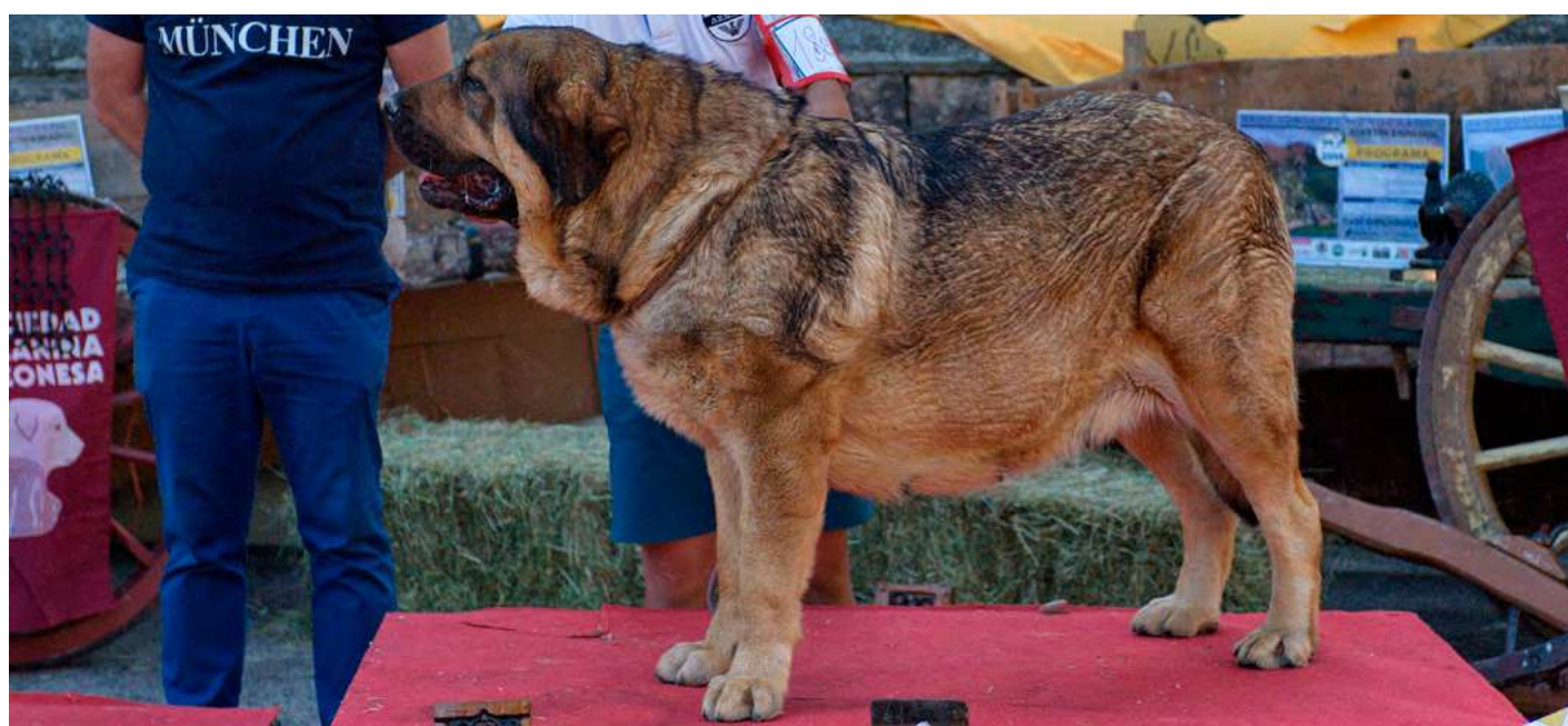
PODIUM MEJOR HEMBRA