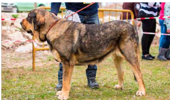
EXC 3° - LOLA DE PANAMERAS Y ALCARRIAS

16 meses. Excelente talla, hueso suficiente para la estructura, larga, la línea dorsal debería ser más firme y el costillar un poco más abierto, muy buenas las angulaciones delanteras y un poco justas las traseras. Cabeza con buenas proporciones, ojos oscuros y mordida en tijera, movimiento flojo.