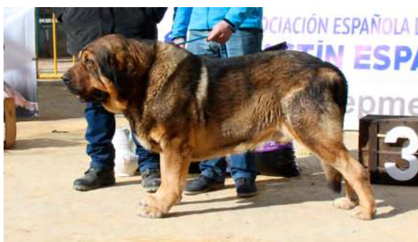
TRECHO DE FILANDÓN