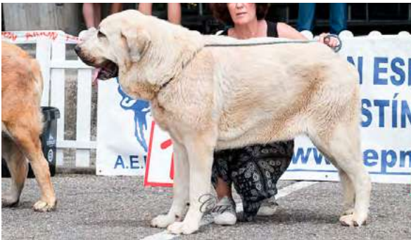
EXC6° - DEVA DE BASILLON

21 meses, grande, EXC. construcción, grupa ligeramente descendente, proporción cráneo/hocico EXC, tijera, ojo avellana, EXC. oreja, forma tamaño e implantación. EXC., cuello, pieles y pelo, Exc. angulación delantera y Trasera. Movimiento presenta cojera con lesión en almohadilla.