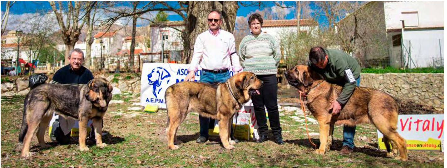
PODIUM JÓVENES HEMBRAS