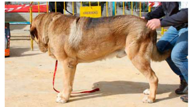
EXC 4º - PIORNO DE LA REGUERA

26 Meses, tijera, muy buena talla cabeza fuerte, muy buen hueso y angulaciones, excelente manto, movimiento deseable mas empuje trasero.