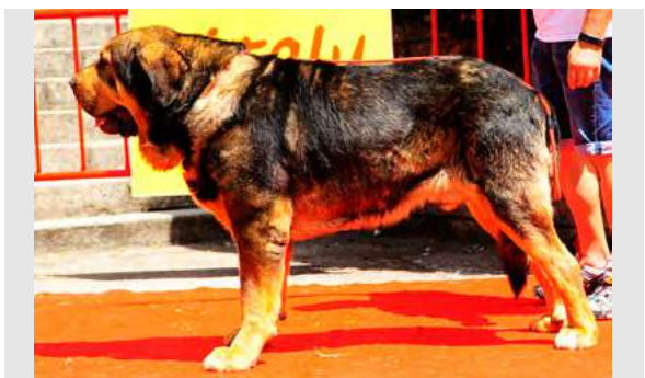
EXC 13º - GIRON DE LA PORTIECHA

5 años. EXC. talla, cuadrado. EXC. pigmentación ojos oscuros, costilla algo plana, Deseable más pecho. Angulaciones justas, grupa derribada. Movimiento correcto.