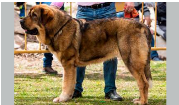
EXC 1° M.J.- JARA DE LOS ARÁNDANOS

9 meses. Excelente talla, excelente estructura, excelentes proporciones de cabeza. Orejas buen tamaño y bien implantadas, ojos suficientemente oscuros aunque me gustaría más oscuros, mordida en tijera, excelente angulaciones delanteras, justas las traseras.