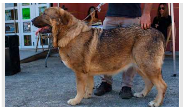
EXC 21° - PERLA DEL SALGUEIRON

2,5 años. Boca correcta, ojo oscuro, oreja un poco retrasada, buena talla. EXC: hocico, línea dorsal y ventral. angulaciones un poco escasas. Movimiento correcto.