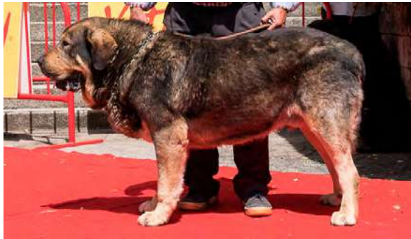
EXC 19° - MAURA DE MONTAÑAS DE LEON

2,5 años. Boca, ojos y orejas correctos, MB hueso, B cabeza y expresión, grupa derribada, EXC. angulaciones delanteras, justas las traseras. Saca codos y junta corvejones.