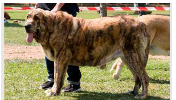
YERBA TIGRE TORNADO ERBEN