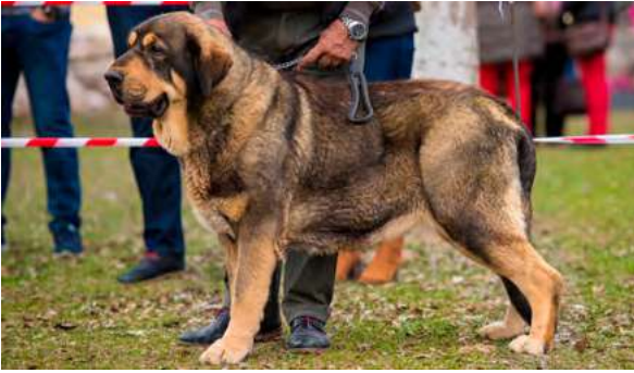
EXC 1º - LUNA DE CASATRONES

2 años. Excelente talla, hueso suficiente, le falta abrir costillar, peso y volumen. Cabeza con buenas proporciones, ojos en el límite, orejas grandes, buenas angulaciones delanteras, traseras justas, movimiento trasero flojo.