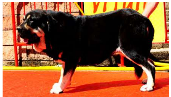
EXC 14° - TUNA DE FILANDÓN

3,5 años. Boca correcta, oreja bien implantada pero un poco grande. EXC. talla, y línea dorsal y ventral. B expresión y cabeza con cráneo un poco estrecho, B angulaciones. Movimiento correcto.