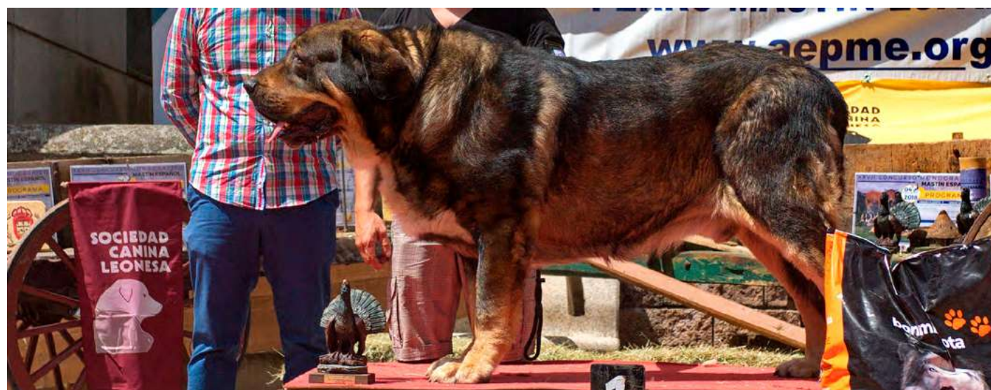
PODIUM MEJOR MACHO