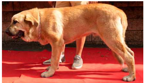
MB 4° - DUERO DE LA CAMPERONA

6 meses, Boca, ojos, oreja y pelo correcto, MB proporciones, y movimiento, oreja un poco alta, MB hocico, ojo un poco claro, cuello corto.