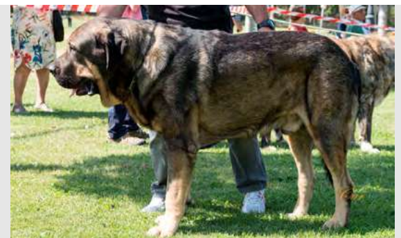
EXC 5° - LUKA DE VALDEJERA

Boca, ojos, oreja y pelo correctos. Proporciones óptimas. Cabeza y expresión óptimas. Cuerpo óptimo. Extremidades correctas. Movimiento correcto.