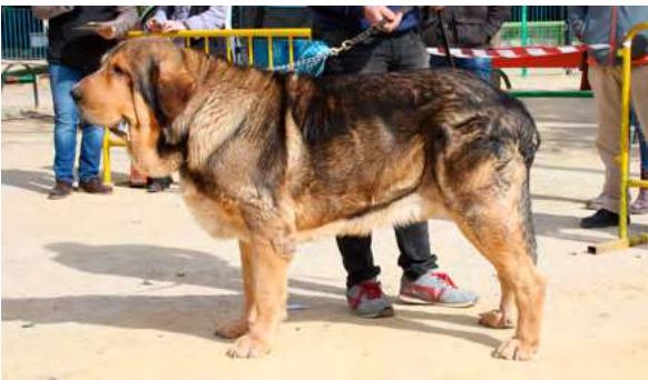
EXC 3º - NEVERO DE FILANDON

Buena boca, cabeza típica, manto bueno, y hueso fuerte, angulaciones muy buenas y movimiento bueno.