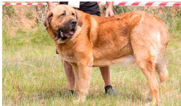
EXC 8° - CAISER

3 años, dentadura ok, muy buena cabeza, masculino, potente, armónico y bien proporcionado; buena cruz, línea superior, grupa, hueso, pecho, aplomos y piel. Ligeramente cojera.