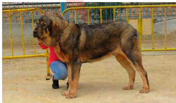
EXC 2° - CUPER DE TOSSAL GROS

16 Meses dentadura correcta cabeza típica buen pelo, rectangular angulaciones y movimiento muy bueno.