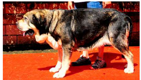
EXC 16° - IRINA DE LA PORTIECHA

6 años. Boca completa, ojos oscuros, oreja un poco alta. Masiva, talla correcta, MB hueso. EXC. costilla y angulaciones. Falta empuje posterior y falta de peso.