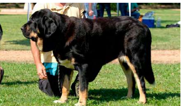
EXC 7º - KONGA DEL PICU SAN MARTÍN

Boca correcta, ojo claro, oreja y pelo correctos. Proporciones, deseable línea dorsal más recta. Cabeza correcta. Expresión no típica por ojo claro. Extremidades correctas. Movimiento correcto.