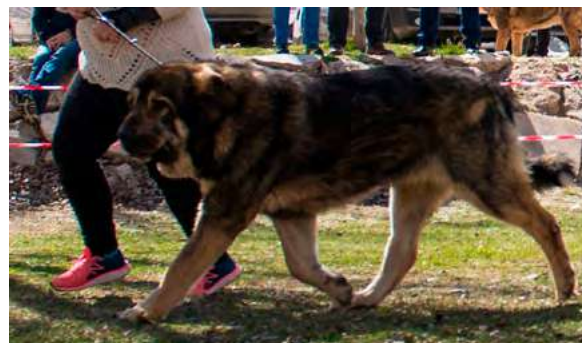
KIMBA DE LA CAMPERONA