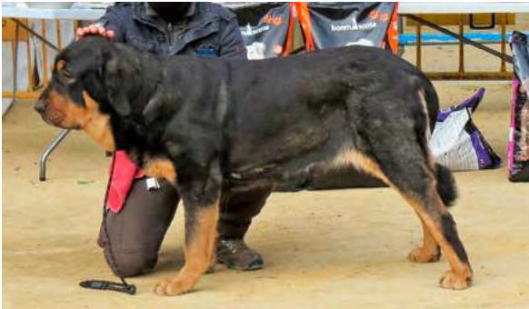
EXC 1° - DUNA DE PARAMERAS Y ALCARRIAS

15 Meses, dentadura correcta, buena talla, femenina rectangular, muy buenos aplomos y angulaciones, exc. Movimiento.