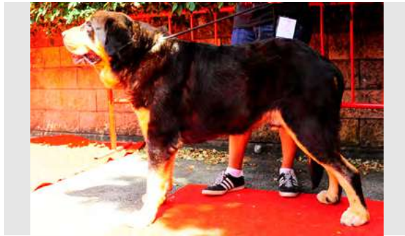
EXC 20° - SIRO DEL MECHAL

4 años, boca en pinza, ojos y orejas óptimos, ejemplar típico, B talla y hueso. Cabeza correcta. EXC. angulaciones, grupa ligeramente derribada. B movimiento.