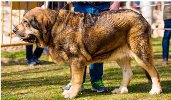
EXC 4° - SOLDADO DE SIERRA DE ENMEDIO

16 meses. Excelente talla y hueso, suficientemente largo, excelentes angulaciones delanteras, muy justas las traseras, cabeza con buenas proporciones, cráneo y hocico potentes. Las orejas un poco grandes y el párpado podría ser más pegado al ojo, la trasera un poco floja en movimiento.