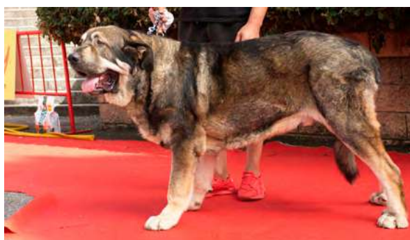
MB 9° - VALLE DE SALGUEIRON

16 meses, boca completa, ojo un poco claro. EXC. talla, cráneo ancho y poco plano, exc. línea dorsal y ventral, MB angulaciones delanteras, EXC. angulación trasera. Movimiento correcto