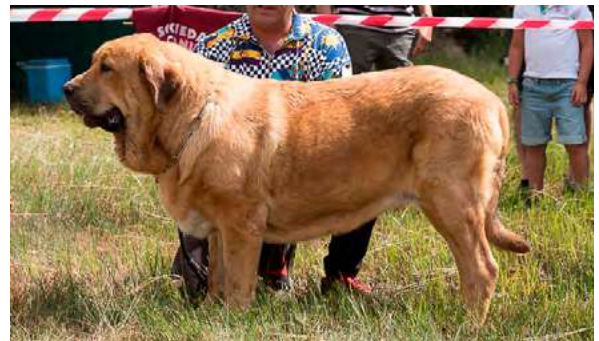
EXC 1° - JULIE DE SERYLU

12 meses, boca ok. típica, femenina, armónica, muy buena cabeza, cruz, grupa, línea superior e inferior, y angulaciones delanteras; excelente pecho, buen pelo y pieles, excelente movimiento abarcando terreno.