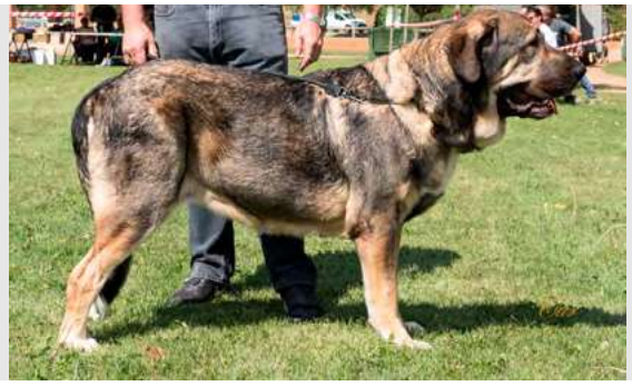
EXC 9º - DAMA DE LA CAMPERONA

Boca con diente incisivo inferior atrasado. Ojo, oreja y pelo correcto. Proporciones óptimas. Cabeza y expresión típicas. Cuerpo óptimo. Extremidades óptimas. Movimiento fluido pero con debilidad de carpos.