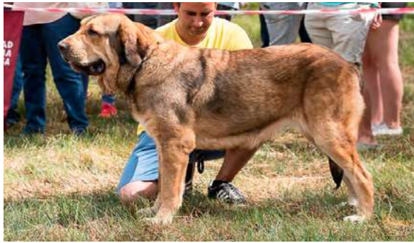
EXC 6° - JADE DE FONTE XUNQUERA

11 meses, típica, muy buena cabeza, ojos claros, muy buena línea dorsal, buenos aplomos, buen pecho, buenas angulaciones, buenas pieles y calidad de pelo, movimiento correcto.