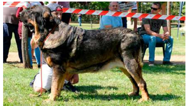
EXC 2° - LOLO DE PARAMERAS Y ALCARRIAS

Boca, ojos, orejas y pelo correctos. Proporciones óptimas. Cabeza y expresión muy típicas. Cuerpo óptimo. Extremidades óptimas. Movimiento óptimo.