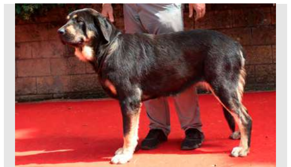
EXC 4° - LIBERTAD DE LA PORTIECHA

11 meses, boca completa, MB aspecto general. Muy correcta, perra muy equilibrada. EXC hueso, MB línea dorsal y ventral. MB angulaciones. MB movimiento.