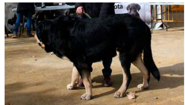
B - BARRENO DE ANAISE

3 Años buena boca, talla pequeña, cabeza típica, buen cuello, manto, muy buena línea dorsal, en parado abre manos, en movimiento podría tener mas impulso.