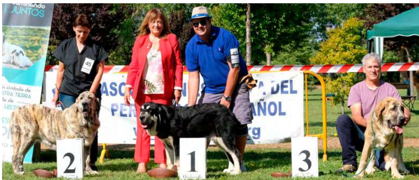
PODIUM CACHORRO HEMBRA