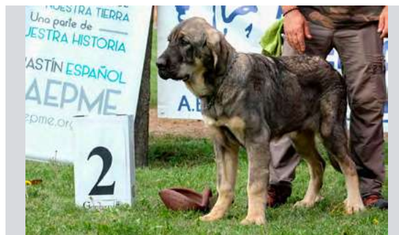
MB 2° - LEAL DE TIERRA DE ÓRBIGO

Boca correcta. Ojos correctos. Oreja correcta. Pelo correcto. Proporciones correctas. Cabeza y expresión típica. Cuerpo correcto. Extremidades correctas. Movimiento correcto.