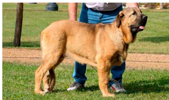
MB 2° - CALA DE AUTOCÁN

Boca correcta. Ojos correctos. Oreja correcta. Pelo correcto. Proporciones correctas. Cabeza y expresión típica. Cuerpo correcto. Extremidades correctas. Movimiento correcto.