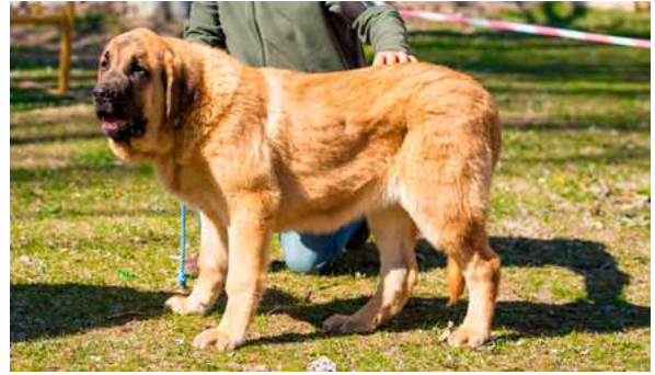
MB 2º - HALCÓN DE MONTE VIZCAYO

4 meses. Muy buena talla, muy buen hueso y aplomos, cabeza con muy buen cráneo y hocico, boca correcta, ojos suficientemente oscuros, orejas con buena forma y tamaño.