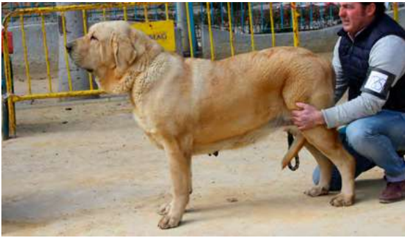
EXC - RELENTE DE TRASUMANCIA

24 Meses, buena boca, tamaño cabeza típica, hueso, masa y rectangular, movimiento debería tener mas fuerza atrás.