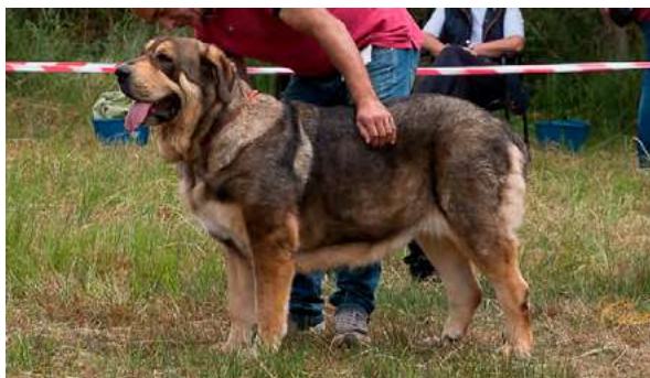
EXC 1° - ADA DE CUATRO ELEMENTOS

4 años. Pinza. Muy típica, femenina, armónica, muy buena cabeza y líneas cráneo-faciales; oreja algo plegada hacia atrás; muy buena línea superior e inferior, buena grupa, excelente pecho, hueso y aplomos, buen pelo y pieles, muy buen movimiento.