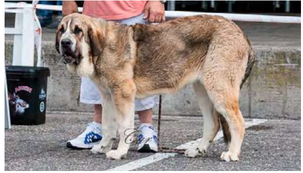
MB 2º- MARTINA DE LOS ARÁNDANOS

8 meses, MB construcción, talla, proporciones cráneo/hocico, línea dorsal y pieles, ojos avellana, tijera, B angulación delantera y trasera, oreja ligeramente grande, MB movimiento con gran amplitud.