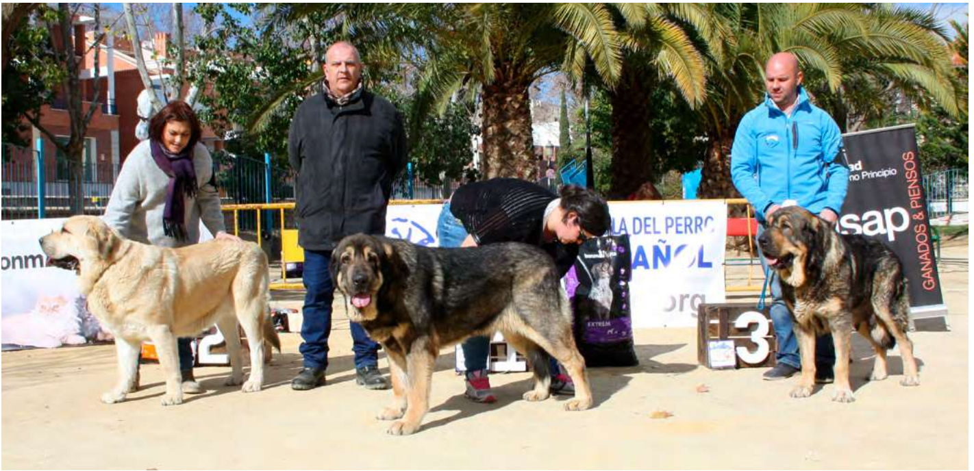
PODIUM ABIERTA HEMBRAS