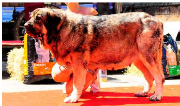
EXC 4° - BROZA DE FILANDÓN

2,5 AÑOS. Boca correcta, ojo claro. MB aspecto y construcción. EXC. cabeza y movimiento. MB angulación delantera y muy justa la trasera.