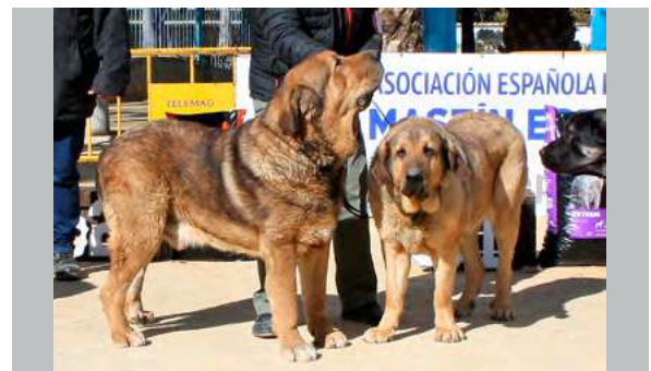
ZARPAS DE LA VICHERIZA Y LUNA DE CASATRONES