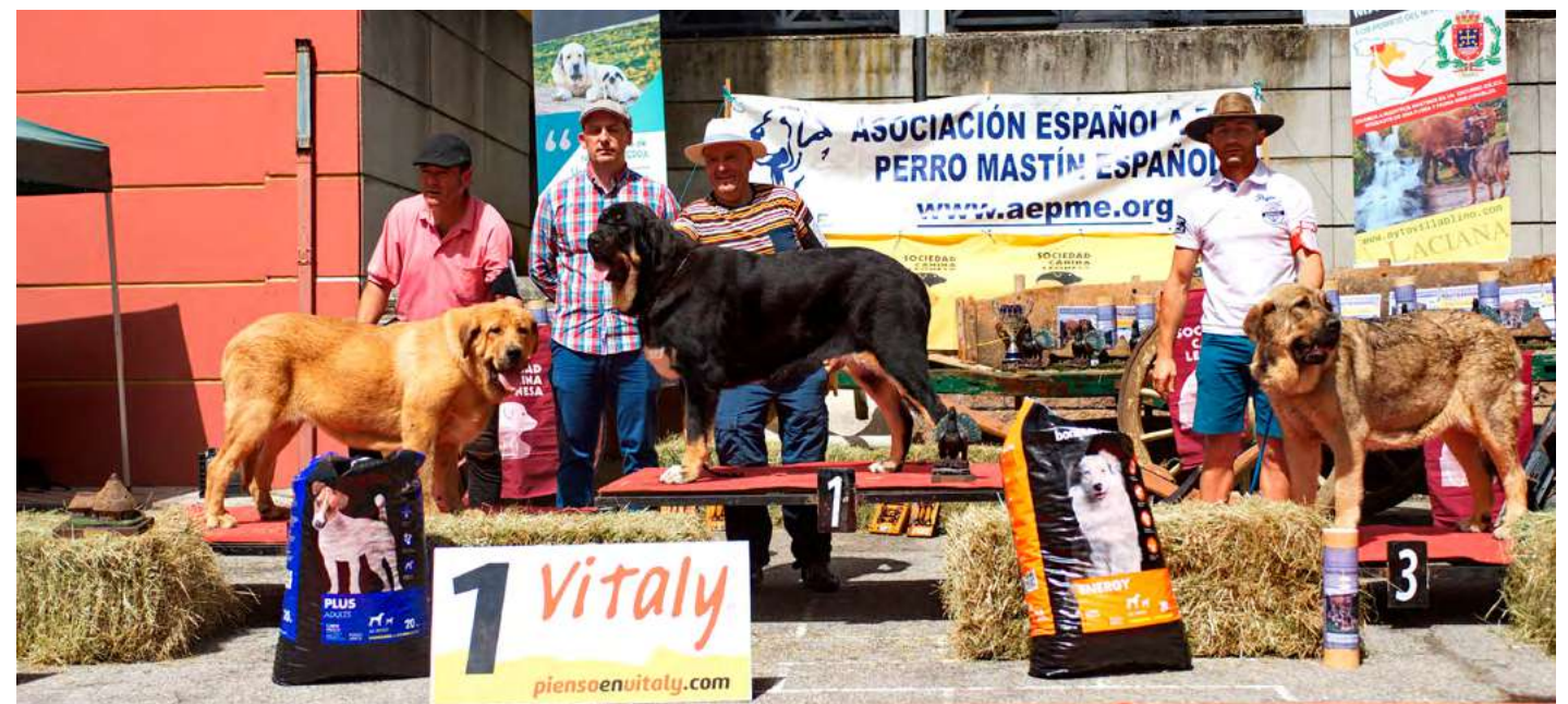
PODIUM JOVENES HEMBRAS