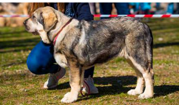
MB 1º - SACHA DE FINCA NOBLE

4 meses. Muy buen tamaño, hueso, estructura, muy buena cabeza con buenas proporciones, el ojo podría ser más oscuro, boca cambiando.