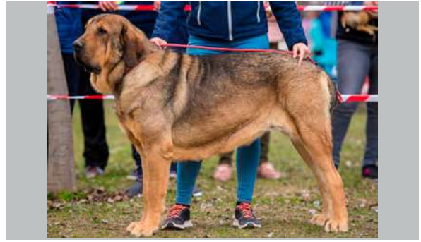
EXC 2º - CAMELIA DE CAMPOLLANO

2 años. Excelente talla, hueso suficiente, le falta abrir costillar, peso y volumen. Cabeza con buenas proporciones, ojos en el límite, orejas grandes, buenas angulaciones delanteras, traseras justas, movimiento trasero flojo.