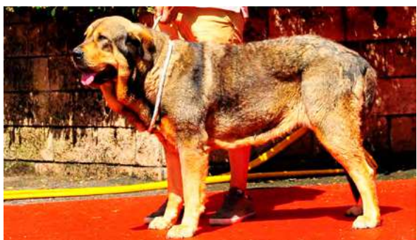
EXC 5° - SENA DE FILANDÓN

18 meses. Boca completa, ojos y orejas óptimos. B aspecto general, larga, típica B expresión. MB angulación delantera y movimiento. Angulación trasera justa.