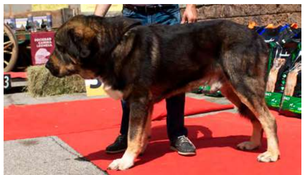
EXC 8º - VALLE DE FILANDON

2 años. EXC. talla y huesos. Grupa derribada. Cráneo plano, hocico un poco estrecho. Costilla algo plana. EXC. angulación delantera, . falta empuje en tren posterior.