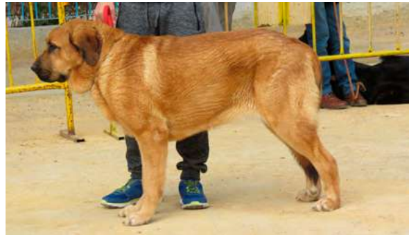
EXC 4° - LEONA DE LA VIEJA ERMITA

15 Meses buena boca, tamaño masa, formato rectangular, muy buen pecho, buenas angulaciones, exc movimiento.