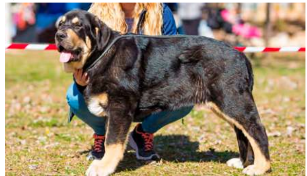
MB 4º - NERÓN DE FICA NOBLE

4 meses. Buen tamaño, buena estructura general, los aplomos un poco blandos, muy buen hueso, buenas proporciones de cabeza, ojos oscuros, la boca cambiando de momento correcta y las orejas me gustaría un poco más cortas.