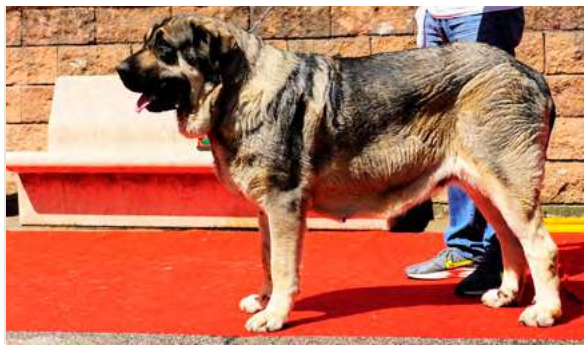
EXC 11° - GRAVA DE FILANDON

3 años, boca completa, óptimos ojos y oreja. Hocico un poco largo en proporción al cráneo. MB expresión, pecho y costilla. B angulaciones, grupa ligeramente derribada en movimiento.