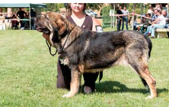
EXC 8º - KIMBA DE LA CAMPERONA

Boca, ojos, oreja y pelo correctos. Proporciones óptimas. Cabeza y expresión óptimas. Cuerpo óptimo. Extremidades óptimas. Movimiento correcto