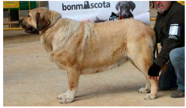
EXC - SELVA MONTES DEL PARDRO

24 Meses, buena boca, tamaño cabeza típica, hueso, masa y rectangular, movimiento debería tener mas fuerza atrás.