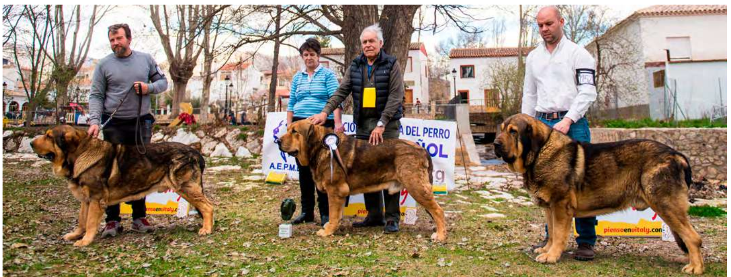
PODIUM ABIERTA MACHOS