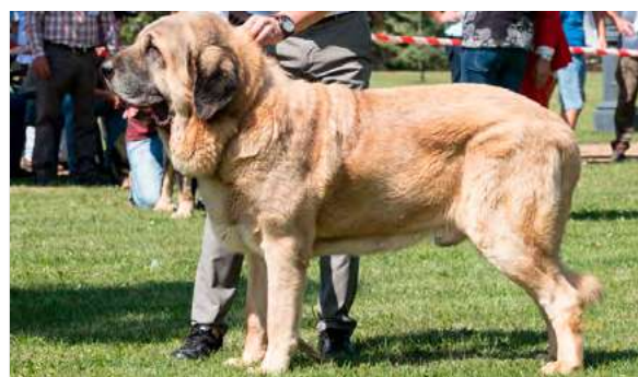
EXC 2° R.C.C. - KRISO DE HAZAS DE CESTO

Boca, ojos, oreja y expresión correctos. Proporciones óptimas. Cabeza y expresión correctas. Cuerpo óptimo. Extremidades óptimas. Movimiento óptimo