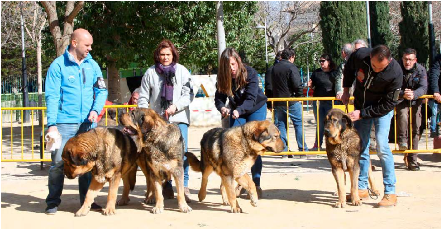
MASTINES DE FILANDÓN