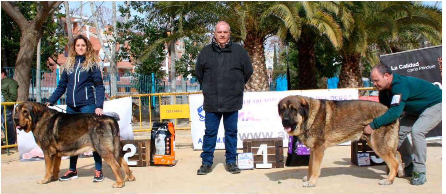
PODIUM INTERMEDIA MACHOS