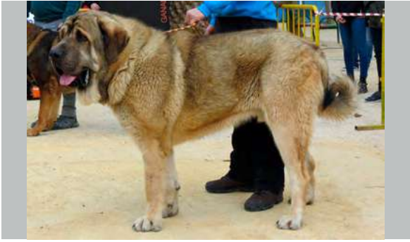
MB - CORSARIO DE MONTE VIZCAYO

12 Meses, buena boca, cabeza pesada, buen pelo, buena línea superior, desvia metacarpos en parado, angulaciones moderadas traseras, movimiento justo y rosca rabo.