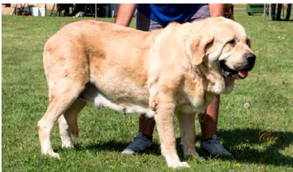
EXC 5º - ANÍS DE ARASANZ

Boca, ojos, oreja y pelo correctos. Proporciones óptimas. Cabeza y expresión muy típicas. Cuerpo óptimo. Extremidades óptimas. Movimiento correcto