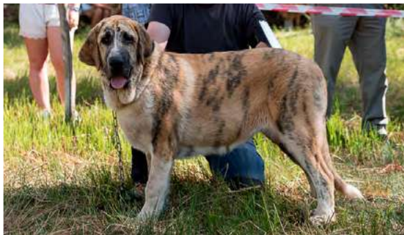
MB 2° - AMARANTA

8 meses, femenina, típica; buena cabeza, línea dorsal, grupa y angulaciones; excelentes proporciones, excelente movimiento.