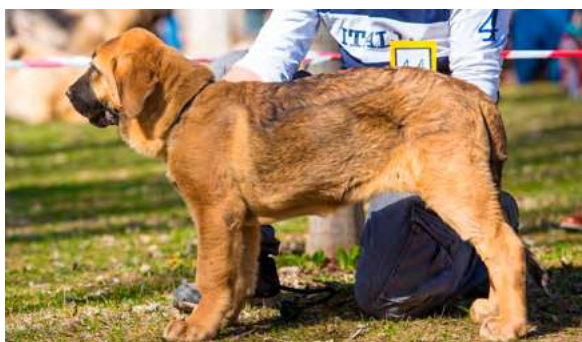
MB 6° - LOBA DE MOMATTI

4 meses. Muy buen hueso y estructura general, cabeza con buenas proporciones, oreja muy grande, ojos oscuros, mordida cambiando.