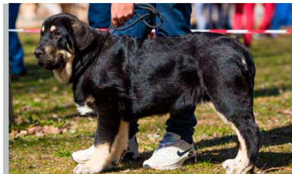
MB 4° - LUNA DE FINCA NOBLE

5 meses. Muy buen tamaño y estructura general, cabeza con buenas proporciones aunque me gustaría cráneo un poco más ancho y la oreja más pequeña, ojos suficientemente oscuros y buena pigmentación de nariz.