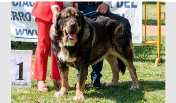
BRIO DE FILANDÓN