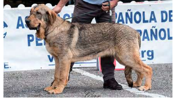
MB 4º - KIRA

7 meses, MB construcción, proporciones cráneo-hocico, pieles, angulación delantera y trasera. Pinza, vigilar posición dientes, línea dorsal blanda conforme edad, MB movimiento con gran empuje.