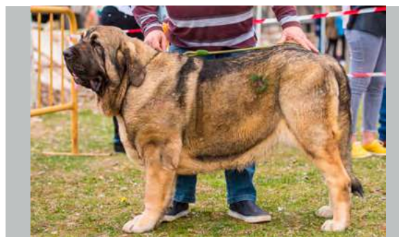
EXC 4° - ALCAZABA DE FUENTE GRAJERO

16 meses. Excelente talla, hueso suficiente para la estructura, larga, la línea dorsal debería ser más firme y el costillar un poco más abierto, muy buenas las angulaciones delanteras y un poco justas las traseras. Cabeza con buenas proporciones, ojos oscuros y mordida en tijera, movimiento flojo.