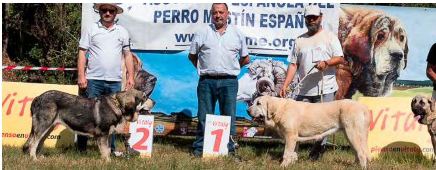
PODIUM CACHORRO HEMBRA