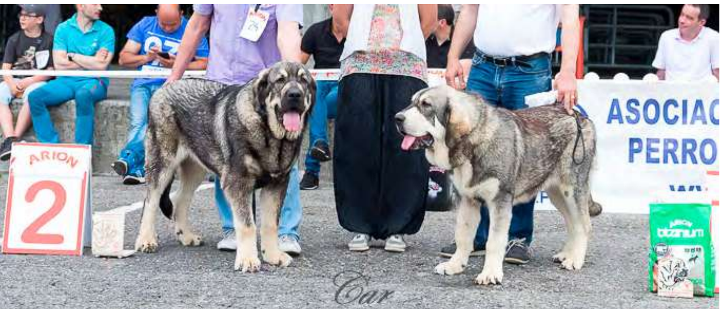
PODIUM CACHORRO ABSOLUTO