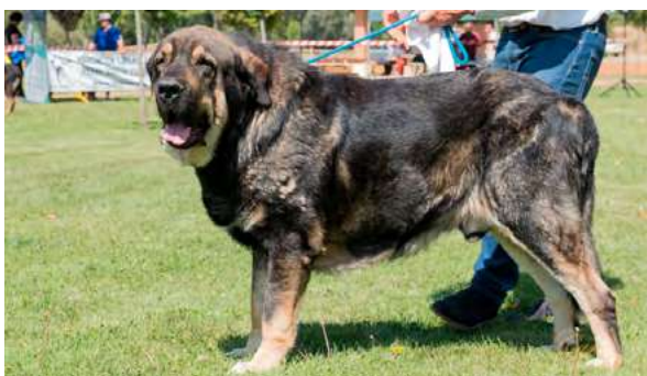
EXC 3° - BROTE DE FILANDÓN

Boca correcta. Ojo correcto con muy buena pigmentación y color. Proporciones correctas. Cabeza y expresión muy típica. Cuerpo correcto. Extremidades correctas. Movimiento correcto