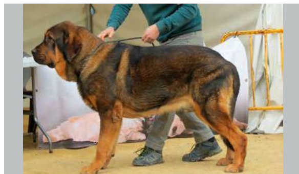
EXC 4° - RAMÓN DE ALZAVARÁN

13 Meses buena boca, talla, masa, hueso fuertes angulaciones posteriores moderadas movimiento muy bueno.