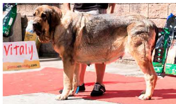
EXC 8° - BREVA DE FILANDON

Óptima boca y ojos, orejas y pelo correctos. Perra larga, con muy buen cuello y aspecto general. Cabeza muy bonita, con oreja un poco grande y baja. EXC. Construcción y angulaciones, MB movimiento.