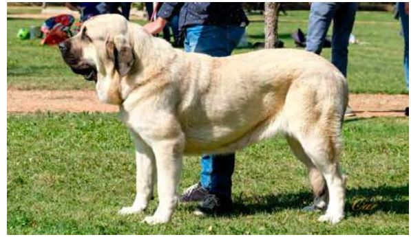
MB 10° - NOA DEL PICU MORU

Boca, ojos, oreja y pelo correctos. Proporciones óptimas. Cabeza y expresión correcta. Cuerpo óptimo. Deseable más angulación trasera. Movimiento correcto.