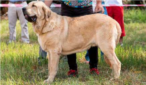
EXC 1° - JORGITO DE SERYLU

12 meses, dentadura OK, ojos claros, masculino; muy buena cabeza, línea dorsal y grupa; aplomos traseros correctos, muy buen pecho, excelente pelo y pieles, excelente movimiento.