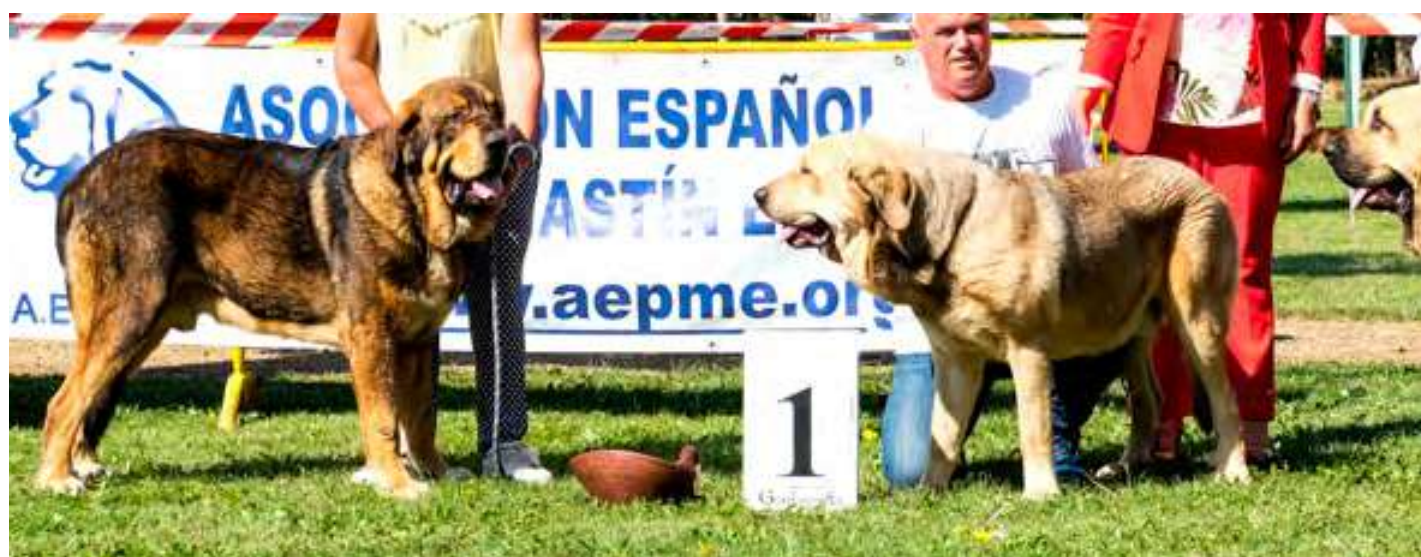
PODIUM JOVEN MACHO