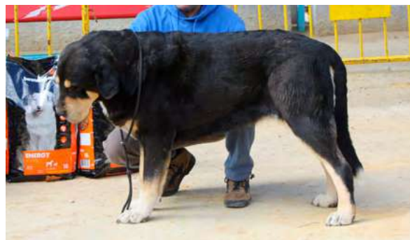
EXC 4º - CARBONERA DE LA RABIZA

28 Meses, buena boca, muy buen tamaño, hueso masa, aplomos, diseño de cabeza, línea dorsal, muy buen movimiento y angulaciones.