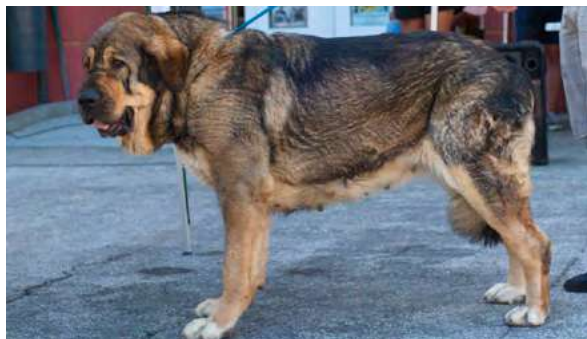
EXC 2° - BRUJA I DE FILANDÓN

Boca y ojos correctos, óptima oreja, EXC. aspecto general, perra típica, bien construida, Masiva. EXC. hueso, costillar, línea superior e inferior, angulaciones y movimiento. MB cabeza y proporciones cráneo-hocico.