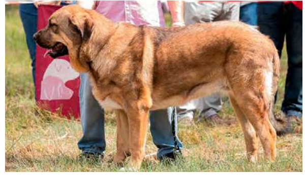
EXC 5° - XENA DE PICU SAN MARTÍN

9 meses, femenina, típica, buen color de ojos, boca ok, cabeza correcta, línea superior ligeramente hundida, angulaciones OK, aplomos delanteros correctos, no así los traseros; , movimiento correcto.