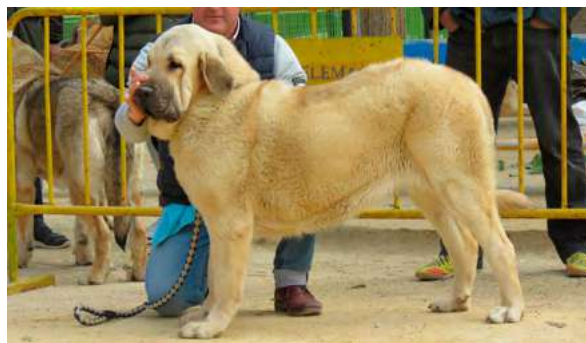
EXC - ESLA DE FUENTE DE GRAGERO

15 Meses, buena boca, masa tamaño, cabeza pecho y angulaciones. Excelente línea dorsal, movimiento muy bueno.