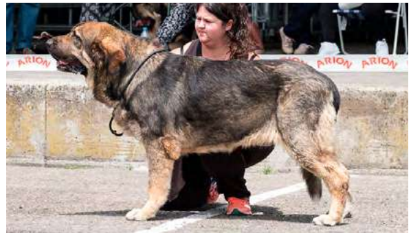
EXC 6° - TUNA DE AUTOCAN

2 años, masiva, EXC. proporciones cuerpo, EXC. proporciones cráneo hocico, pinza, ojo ligeramente claro, EXC. orejas, pelo, angulaciones y pieles. Hocico ligeramente acarnerado.