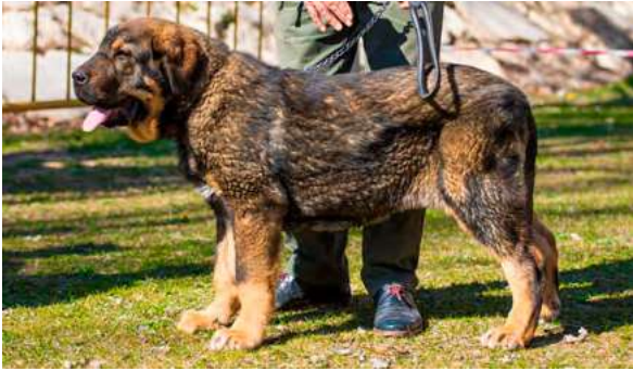
MB 1º M.M.C. - CHANO DE CASATRONES

4 meses. Muy buena talla, muy buen hueso y aplomos, cabeza con muy buen cráneo y hocico, boca correcta, ojos suficientemente oscuros, orejas con buena forma y tamaño.