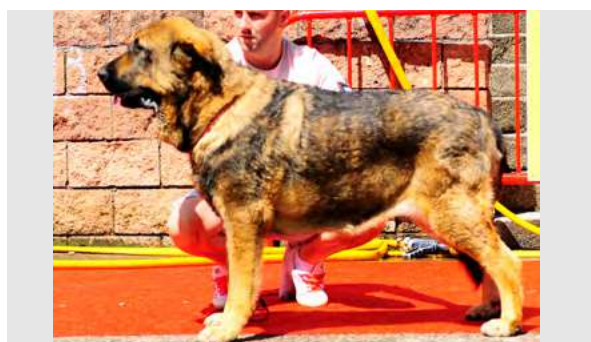
EXC 3° - ASIA DE LA GRITSANDANA

20 meses. Boca completa, ojo oscuro. Típica, talla correcta. MB cabeza, EXC hocico. B hueso, EXC angulaciones, B movimiento.