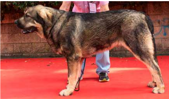
MB 1° - OSO DE AUTOCÁN

Boca, ojos, oreja y pelo correcto. Cachorro muy masivo, MB cráneo, costillar y angulaciones, B hocico, stop un poco marcado. B movimiento.