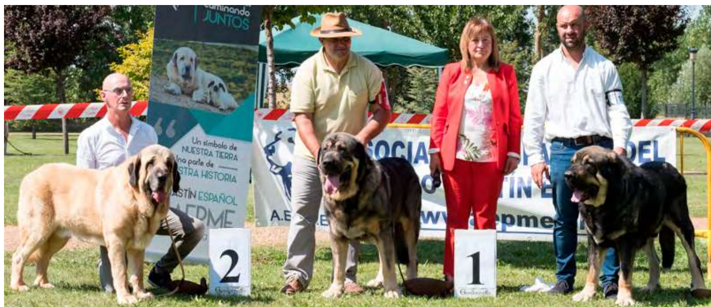
PODIUM ABIERTA MACHO