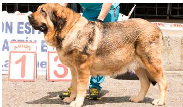
EXC 1º M.H B.I.S. - LUPE DE FILANDÓN

4 años, armónica, típica. EXC. pelo, EXC. proporciones cráneo/hocico, pinza, cabeza potente, ojos casi avellana, EXC. orejas, construcción, línea dorsal, pieles, hueso y angulaciones. EXC. movimiento con gran amplitud.