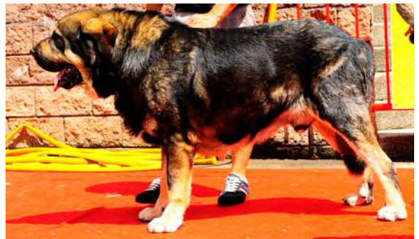
EXC 4º- BROTE DE FILANDÓN

4,5 años. Típico. EXC. cabeza y expresión. B línea dorsal y ventral, MB angulaciones y movimiento, EXC. calidad de pelo.