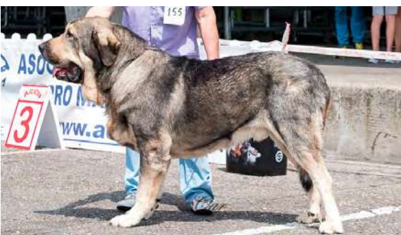
EXC 2° - TUNO DE AUTOCAN

4 años, masivo, EXC. proporciones cráneo/hocico, expresión típica, ojos color avellana, fuerte osamenta. EXC. angulación delantera y trasera un poco justa. EXC. anchura y EXC. movimiento. Desearía algo más de altura.