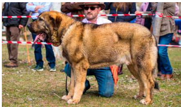
EXC 1° - JAKO DE LOS ARÁNDANOS

9 meses. Excelente talla y estructura para la edad, muy buena cabeza y expresión, el color de los ojos es suficiente, mordida en pinza los dos centrales, cráneo y hocico potentes, excelente angulación delantera y un poco justa la trasera, movimiento trasero flojo.