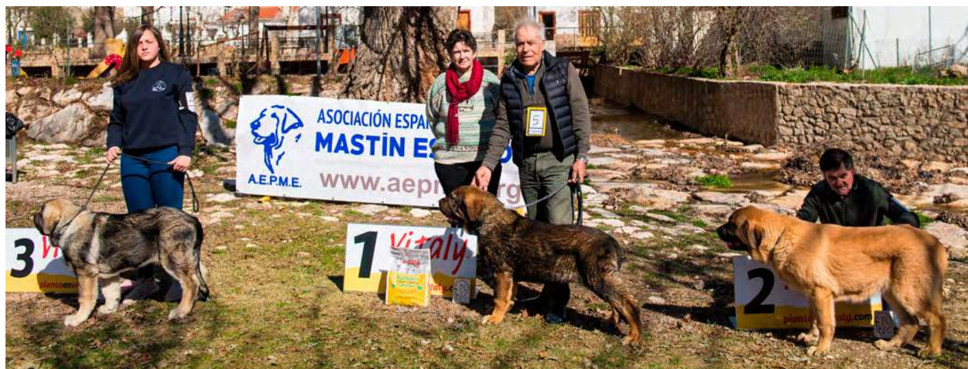
PODIUM MUY CACHORROS MACHOS