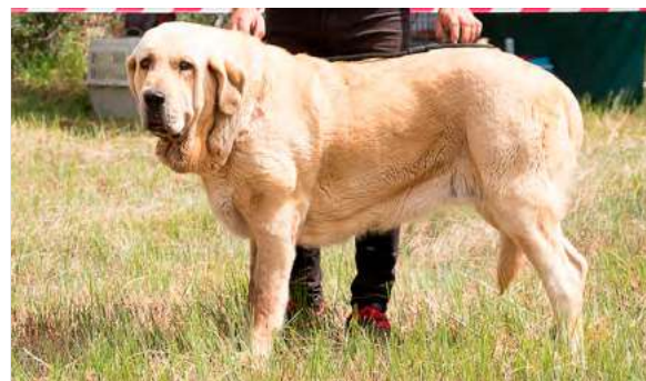
EXC 2° - FABIOLA DE SERYLU

4 años. Pinza. Muy típica, femenina, armónica, muy buena cabeza y líneas cráneo-faciales; oreja algo plegada hacia atrás; muy buena línea superior e inferior, buena grupa, excelente pecho, hueso y aplomos, buen pelo y pieles, muy buen movimiento.