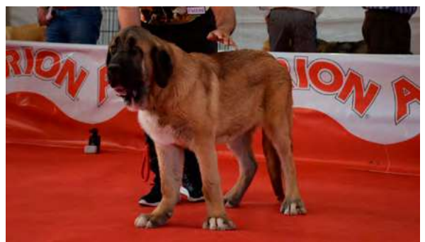
MB 2º - GORRIÓN DE MOMATTI