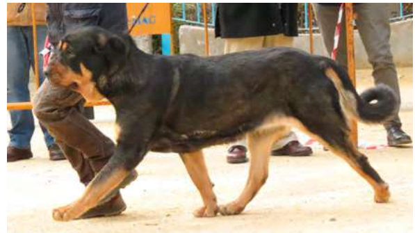
DUNA DE PARAMERAS Y ALCARRIAS