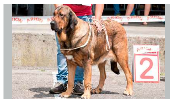
EXC 3° - ELLA DE PICUXIANA

18 meses, armoniosa, pinza, ojos casi avellana, EXC. orejas, angulaciones delanteras y traseras, pieles. Sería deseable algo más de osamenta, carácter tímido, buen movimiento.