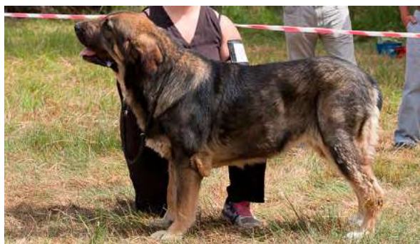
EXC 3° - KIMBA DE LA CAMPERONA

3 años. Típica, armónica, ojos algo claros, buena cabeza y belfos, línea superior correcta, grupa correcta, buen pecho, buenas angulaciones delanteras y traseras compensadas, buena calidad de pelo y pieles, buen movimiento abarcando terreno.