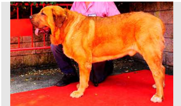
EXC 5º - HIGH T BONG DE TIERRA DE ORBIGO

Masivo, EXC. hueso, hocico, costillar y movimiento. MB angulaciones y pecho.