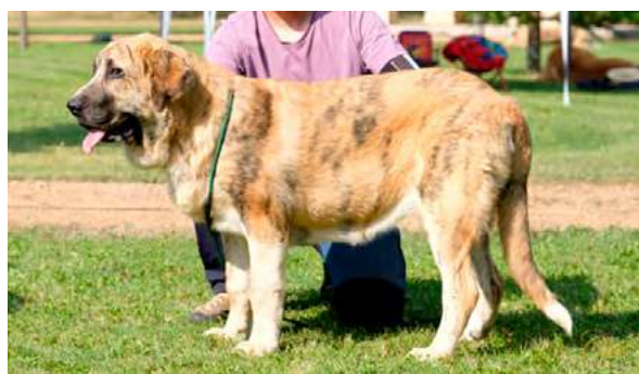
MB 3º - AMARANTA

Boca, ojos, oreja y pelo correctos. Proporciones óptimas. Cabeza y expresión típica. Cuerpo correcto. Extremidades: Deseable más angulación trasera. Movimiento óptimo