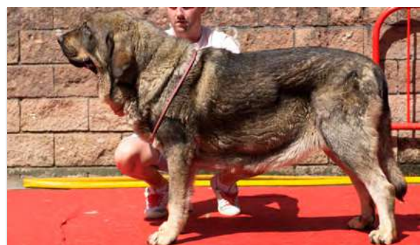
EXC 7° - CHOUSA DE CASATRONES

3 años. Boca correcta, oreja grande de inserción baja. Típica, buen tamaño. EXC. hueso, líneas dorsal y ventral. Y EXC. Angulaciones. Buen pecho y movimiento.