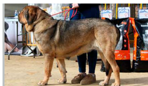
EXC - CAMELIA DE CAMPOLLANO

23 Meses buena boca, cabeza, muy buen frente y angulaciones, excelente línea dorsal, movimiento muy bueno.