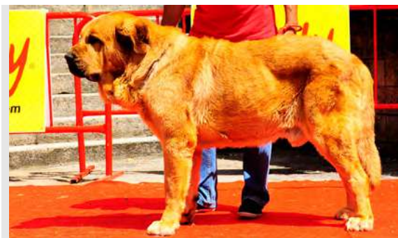
EXC 12º - DUQUE DE LA GRITSANDANA

2,5 años. Boca completa, ojo un poco claro, exc. alzada, cabeza correcta, EXC. línea superior y ventral, correctas angulaciones, MB movimiento.