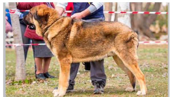
EXC 4º - HIELO DE ALZAVARÁN

3 años. Excelente talla y hueso, los aplomos delanteros me gustaría más verticales, perro largo con cabeza excelente cráneo y hocico. Orejas buen tamaño e inserción, ojos suficientemente oscuros, párpados superiores un poco metidos, mordida en tijera, movimiento marca aplomos delanteros blando.