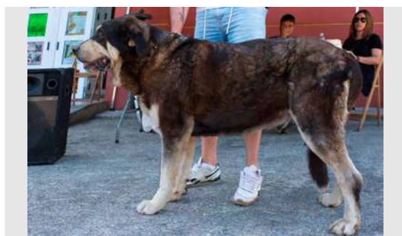
EXC 22° - KENIA DE SALGUEIRON

5 años. Boca correcta, ojo un poco claro, perra bien construida, cráneo un poco plano. MB costillar y pecho. EXC. angulaciones y movimiento