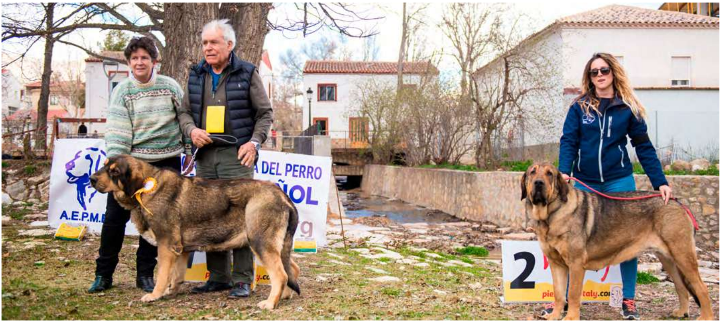
PODIUM INTERMEDIA HEMBRAS