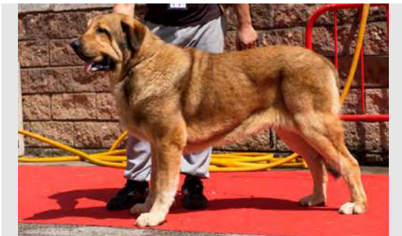
EXC 3° - CRISTU DE RAIGUSU

Boca pinza, oreja un poco baja. Perro compacto con EXC. hueso, cráneo y hocico. Expresión un poco dura. EXC. angulaciones, MB pieles.