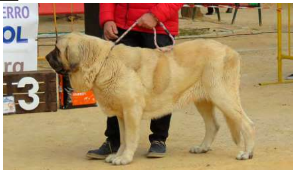
EXC - CONDESA DE SIERRAENMEDIO

15 Meses, buena boca, masa tamaño, cabeza pecho y angulaciones. Excelente línea dorsal, movimiento muy bueno.