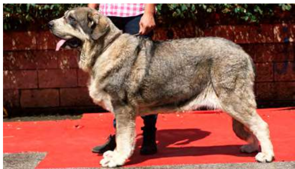
EXC 1° - HABANA DE LA FILTROSOSA

20 meses. Boca completa, oreja un poco grande. Masiva, mucho hueso, típica, exc hocico, costilla, línea superior e inferior, pecho y angulaciones. Carpo un poco corto. MB movimiento, mete manos.