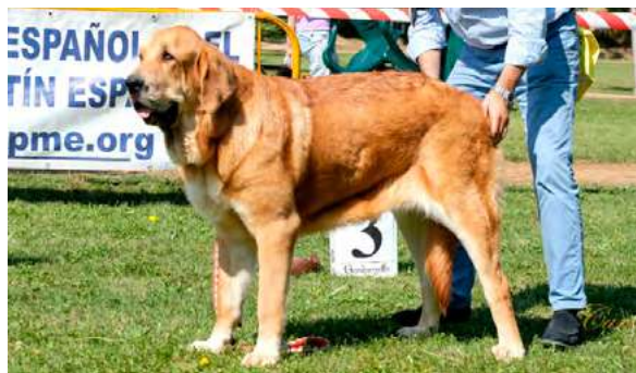
EXC 2º R.C.C.J. - LUNA DE LA RABIZA

Boca, ojos, oreja y pelo correctos. Proporciones óptimas. Cabeza y expresión muy típicas. Cuerpo óptimo. Extremidades óptimas. Movimiento óptimo