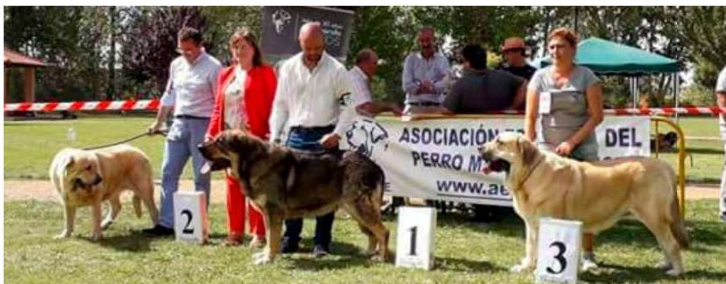
PODIUM ABIERTA HEMBRAS