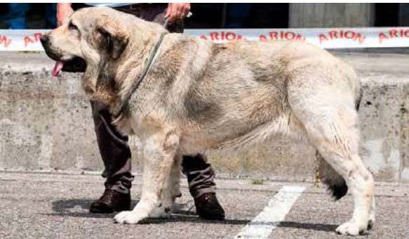
EXC 5° - FARRUCA DE BUZIONALE

4 años, armónica, EXC. construcción, pelo, proporciones, oreja, angulaciones y pieles. Boca en tijera, dientes desgastados, vigilar parpado superior, EXC. movimiento con buen empuje.