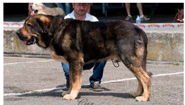
EXC 3° - VALLE DE FILANDON

3 años. EXC. cabeza, tijera, avellana, EXC. orejas en implantación y forma, EXC. angulaciones delanteras, MB angulación trasera, EXC. pieles, MB movimiento. Deseable más alzada.