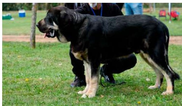
MB 2º- TRASTU DEL RAIGASU

Boca correcta, ojos óptimo, oreja óptimo, pelo óptimo. Proporciones correctas. Cabeza y expresión Óptima, óptima pigmentación. Cuerpo correcto. Extremidades óptimas, movimiento óptimo.