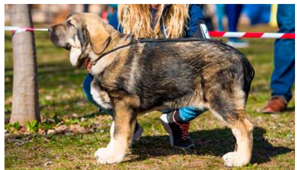
MB 2º - HERA DE FINCA NOBLE

4 meses. Muy buen tamaño, hueso, estructura, muy buena cabeza con buenas proporciones, el ojo podría ser más oscuro, boca cambiando.