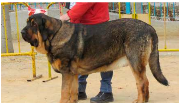
EXC 5° - LOLO DE PARAMERAS Y ALCARRIAS

13 Meses buena boca, cabeza, movimiento, línea superior buena, excelentes angulaciones y movimiento.