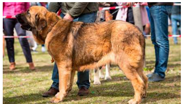
EXC 2° - SIMA DE MONTE VIZCAYO

9 meses. Excelente talla, excelente estructura, excelentes proporciones de cabeza. Orejas buen tamaño y bien implantadas, ojos suficientemente oscuros aunque me gustaría más oscuros, mordida en tijera, excelente angulaciones delanteras, justas las traseras.