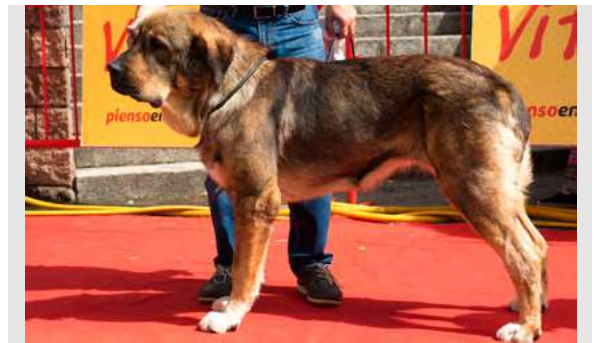
EXC 6° - JARA DE LOS ARANDANOS

16 meses. Boca completa. Ojo un poco claro. Perra típica, muy larga. MB cabeza con oreja en rosa. EXC línea dorsal y ventral. Hueso correcto. Movimiento correcto., le falta empuje tren posterior.