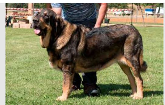
EXC 4º - DIANA DE LA RABIZA

Boca correcta. Ojos oreja y pelo óptimos. Proporciones óptimas. Cabeza y expresión muy típicas. Cuerpo óptimo. Extremidades óptimas. Movimiento óptimo