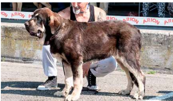
MB 3º - TRASTU DEL RAIGUSU

6 meses, pinza, proporciones ajustadas al estándar, MB hueso, optimas proporciones cabeza, MB calidad de pelo, MB pieles, MB sustancia, manos ligeramente blandas, desearía ojo más oscuro, buen movimiento con buen empuje.