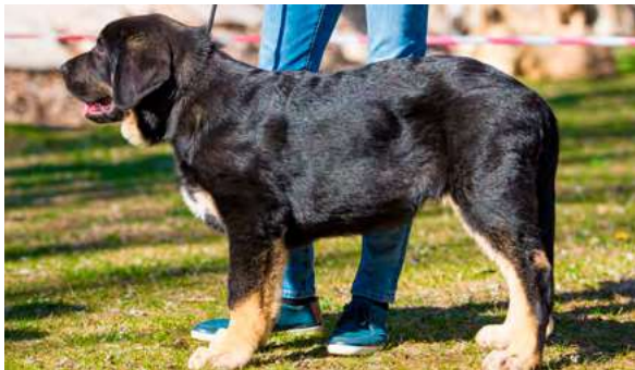
MB 5º - HUGO DE FINCA NOBLE

4 meses. Muy buena estructura general, aplomos y hueso. Cabeza con buenas proporciones, ojos oscuros, boca correcta, oreja me gustaría más pequeña, movimiento libre típico de cachorro.