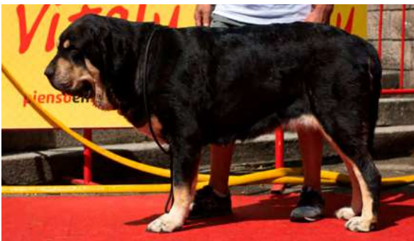
EXC 13° - CARBONERA DE LA RABIZA

4 años. Boca correcta, ojos oscuros, oreja un poco alta, EXC. hocico, aspecto general, línea dorsal y ventral, costilla y hueso. MB angulaciones y movimiento. Falta empuje tren posterior.