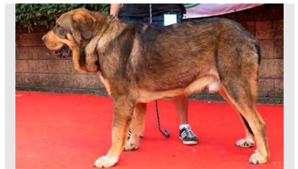
EXC 4º - MILTON DE FONTEXUNQUERA

Boca correcta, ojo un poco claro, buena talla, típico, MB cabeza, oreja implantación un poco baja, EXC. costillar, pecho, angulación delantera. MB angulación trasera y movimiento.