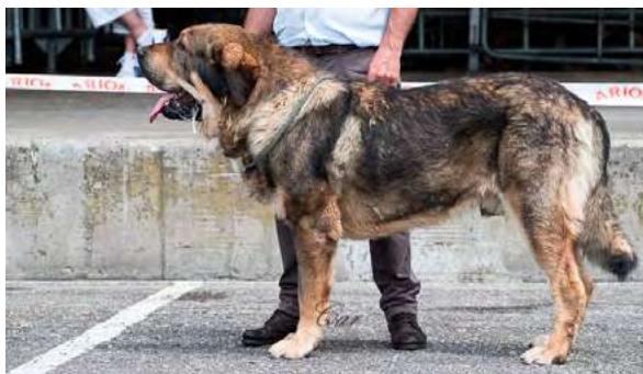
EXC 6º - CESTO DE FILANDON

2 años. EXC. proporciones y armonía. EXC. proporciones cráneo/hocico, y hocico potente, tijera, ojos color avellana. EXC. oreja en implantación, forma y tamaño. EXC. angulación delantera, MB angulación trasera. EXC. movimiento y aplomos.