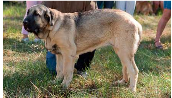
MB 2° - COPA DE AUTOCAN

4 meses, típica, femenina, bien estructurada, buena línea dorsal y grupa, buena cabeza, buena calidad de pieles, buen hueso. Movimiento correcto.