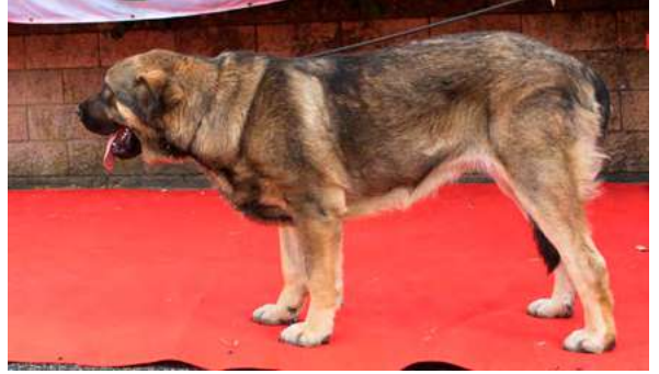
MB 2º - CASCADA DE LOS PISCARDOS

8,5 meses. Boca correcta y completa, Buena talla, cabeza muy típica, MB línea dorsal y ventral, MB angulaciones, MB movimiento.