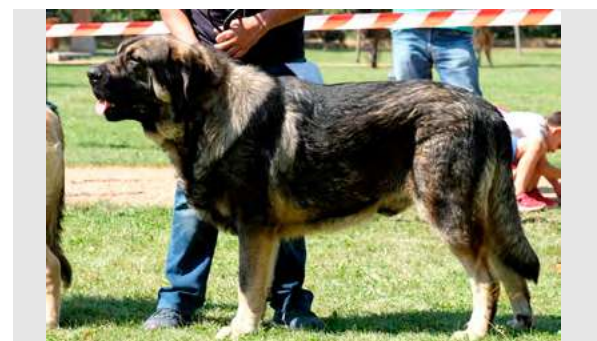
EXC 6° - BARRO DE LOS PISCARDOS

Boca correcta. Ojos ligeramente claros. Oreja y pelo correctos. Proporciones adecuadas. Cabeza y expresión típicas. Cuerpo correcto. Extremidades correctas. Movimiento correcto.