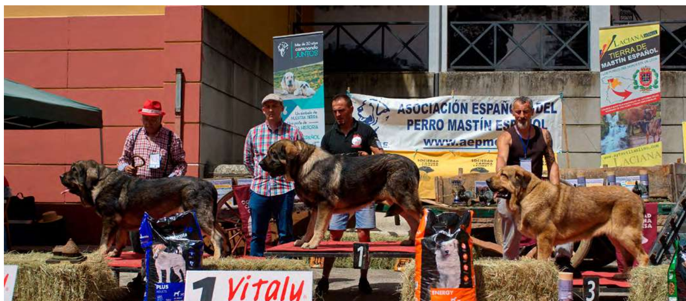
PODIUM INTERMEDIA MACHOS