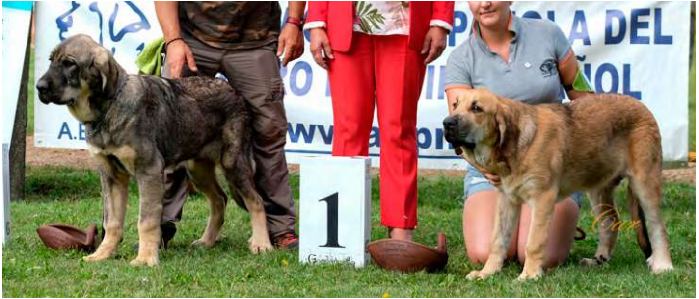
PODIUM MUY CACHORRO HEMBRA