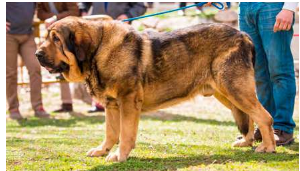
EXC 2º - TRECHO DE FILANDÓN

2 años. Buena talla, excelente hueso, excelente estructura general, buenas angulaciones delanteras, un poco justas las traseras, cabeza con excelentes proporciones, excelente cráneo, ojos correctos, mordida pinza los dos centrales, orejas correctas un poco grandes.