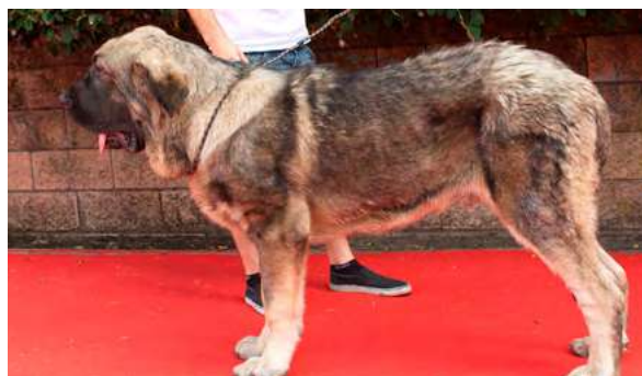
EXC 6° - ATILA DE LOS TINTALES

9 meses, boca completa, prolapso 3° parpado ojo izquierdo, típico, largo, delgado, MB cráneo, hocico, hueso, oreja algo retrasada, cuello largo. MB angulaciones.