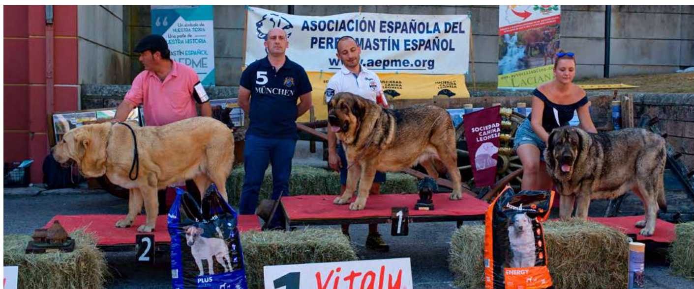
PODIUM ABIERTA HEMBRAS