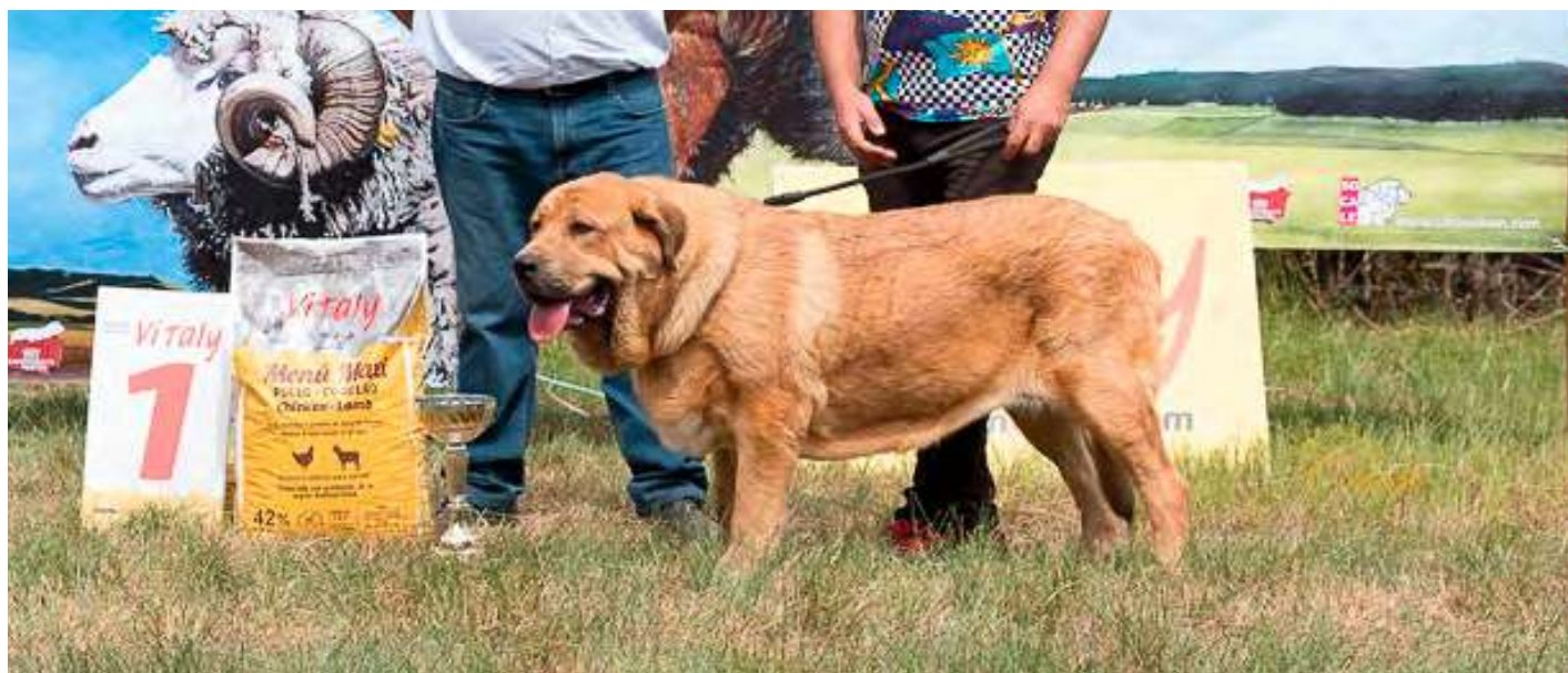
PODIUM JOVEN ABSOLUTO