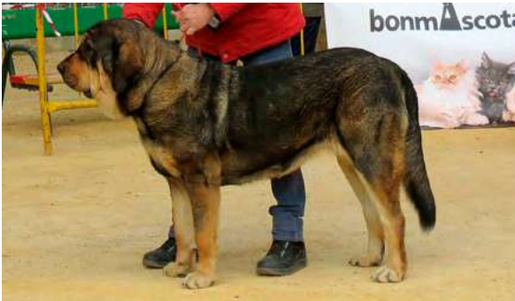
EXC 3° - LOLA DE PARAMERAS Y ALCARRIAS

14 Meses, buena boca, masa y hueso, cabeza típica, ojos y orejas muy buenos movimiento excelente.