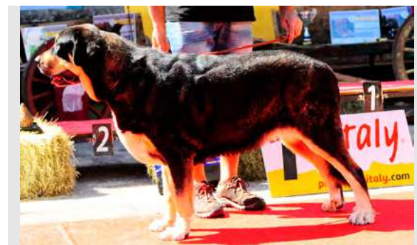
EXC 26° - ADA DEL VIEJO PARAMO

3 años. Boca correcta, ojo oscuro, inserción un poco baja. Cuello largo, buena proporción cráneo/hocico. Buena línea dorsal y pecho. EXC. angulación trasera. Movimiento correcto