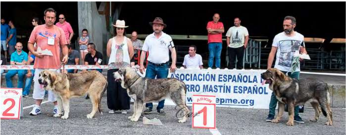
PODIUM CACHORROS HEMBRAS