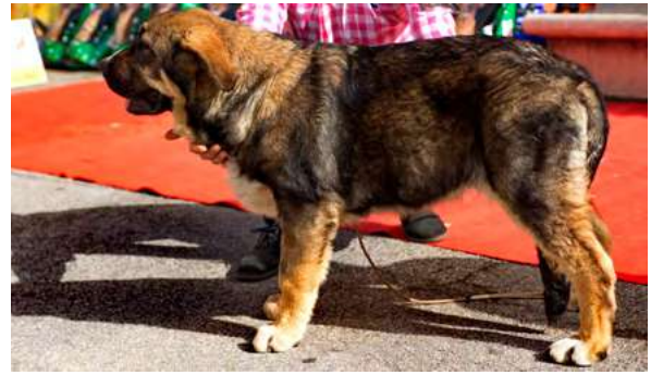
MB 2° - MIRO DE LA FILTROSOSA

Boca, ojos, oreja y pelo CORRECTO, MB proporciones, cabeza y expresión, cuerpo, extremidades y angulaciones, y MB movimiento.