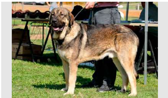
EXC 5º- VALLE DE SALGUEIRÓN

Boca en pinza. Ojos, oreja y pelo correctos. Proporciones correctas. Cabeza y expresión correctas. Cuerpo correcto. Extremidades correctas. Movimiento óptimo.