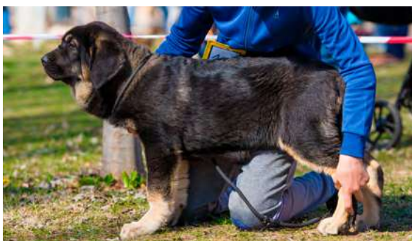
MB 5° - SERRANA DE MOMATTI

4 meses. Buen tamaño y estructura general, aplomos un poco flojos, bonita cabeza, bonita expresión, ojos oscuros, el hocico podría ser más corto y la oreja más pequeña.