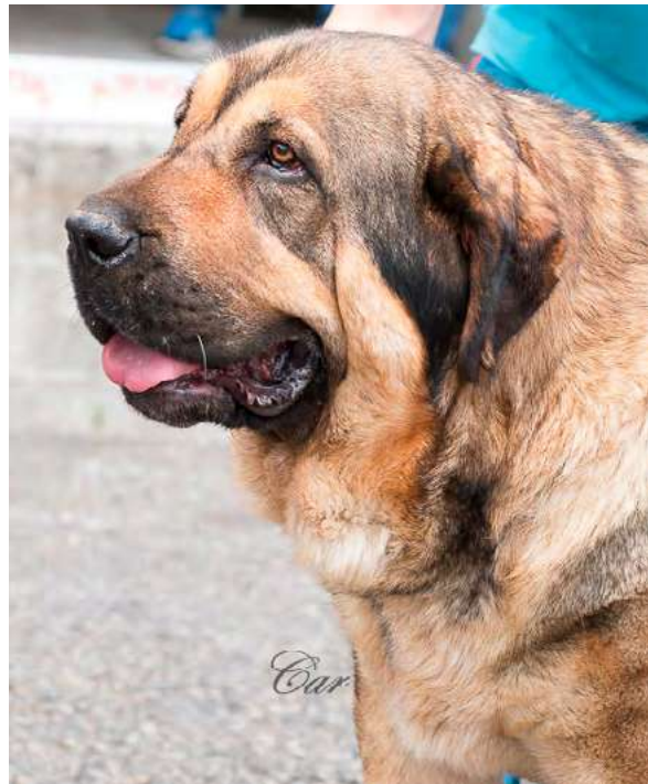
LUPE DE FILANDON