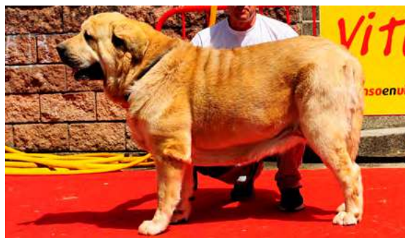
EXC 10º - FENIX DE MONTES DEL PARDO

3 años. Muy masivo, bien construido, EXC pieles. MB cráneo y hocico. MB angulaciones, movimiento correcto. Callo de bursitis, perro en mala condición física.