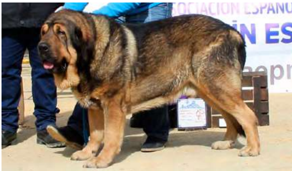
EXC 1º M.M. BIS - TRECHO DE FILANDÓN

42 Meses, boca tijera, dos dientes en pinza, muy fuerte buena talla, cabeza y hocico típico, buenas pieles y pelo, excelente angulaciones, movimiento muy bueno.