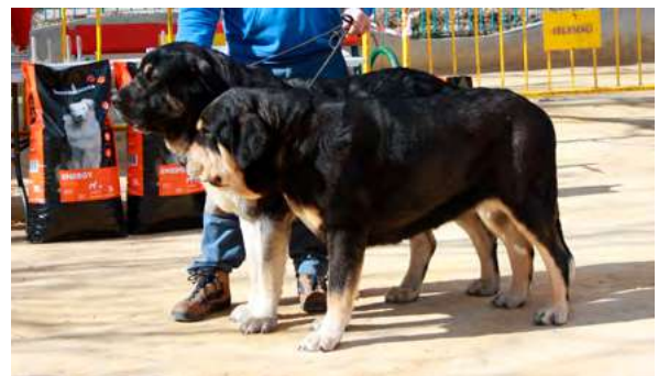
SANSON DE LA PORTIECHA Y CARBONERA DE LA RABIZA