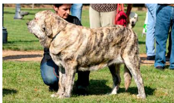
MB 2º- GALAXIA TORNADO ERBEN

Boca, ojos, oreja y pelo correctos. Proporciones óptimas. Cabeza y expresión óptimas. Cuerpo óptimo. Extremidades óptimas. Carpos débiles