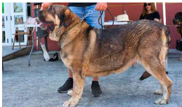
EXC 19° - MONTAÑA DE LOPS PISCARDOS

4 años. Boca correcta, ojos oscuros, EXC. hocico, y angulaciones, cráneo un poco estrecho. Línea dorsal ensilla en movimiento y debilidad de carpos.