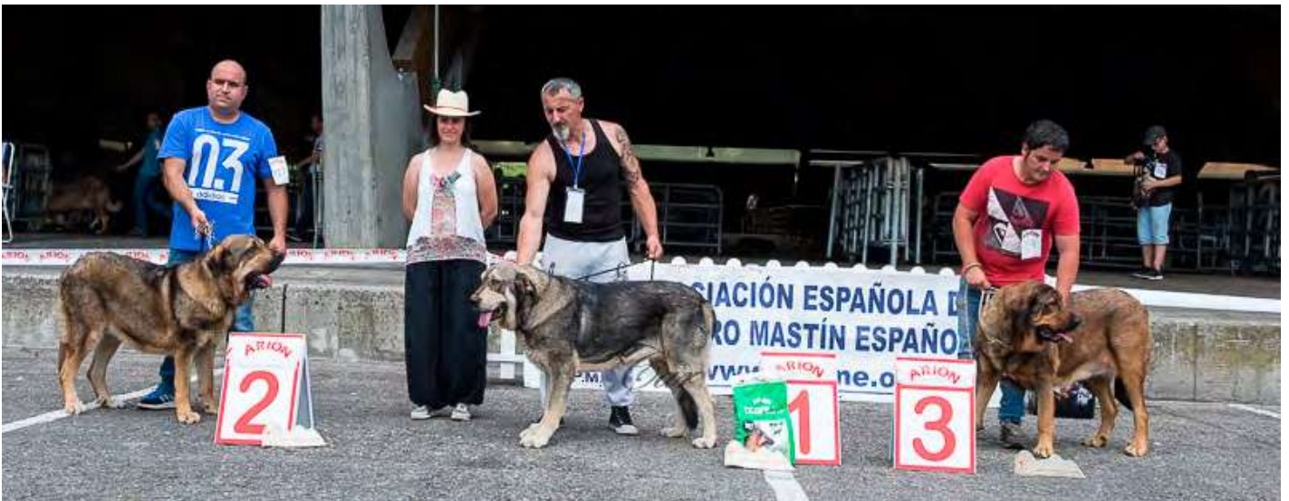
PODIUM INTERMEDIA HEMBRAS