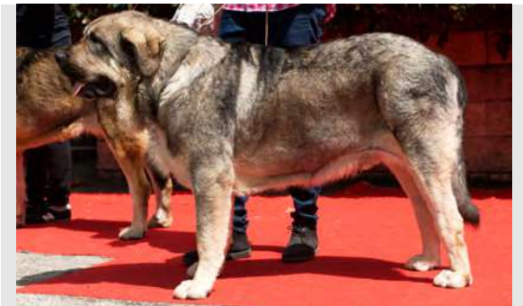
EXC 5° - HERMITAÑO DE LA FILTROSIA

Boca completa, ojos un poco claros. EXC. talla, hueso, cráneo y hocico. Exceso de belfo. MB angulaciones delanteras justa la trasera. B movimiento con tendencia a sacar codos. EXC. pigmentación.