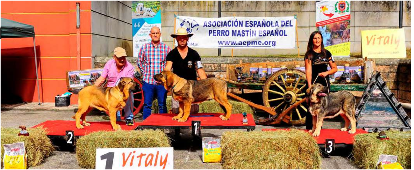
PODIUM CACHORROS HEMBRAS