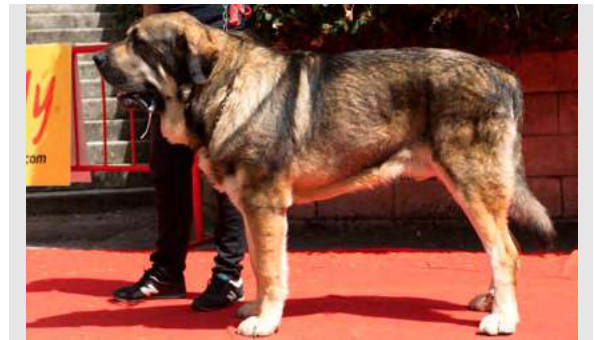
EXC 6° - CAMPORRO DE LOS PISCARDOS

20 meses. Boca completa, ojos oscuros, MB oreja. EXC. talla, muy masivo. EXC. hocico, cráneo un poco plano. EXC. línea dorsal y ventral, MB costilla. Justo de angulaciones. B movimiento.