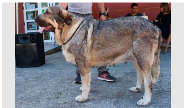
EXC 20° - NOA DE LOS PISCARDOS

4 años. Boca correcta, ojos oscuros, EXC. hocico, y angulaciones, cráneo un poco estrecho. Línea dorsal ensilla en movimiento y debilidad de carpos.