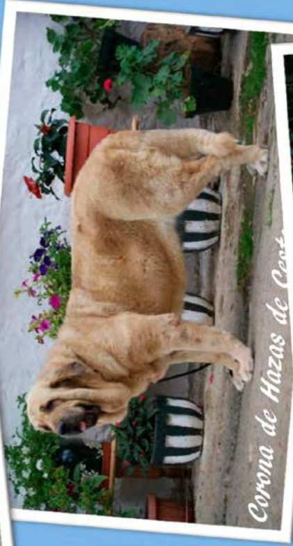
Corona de Hazas de Cesto