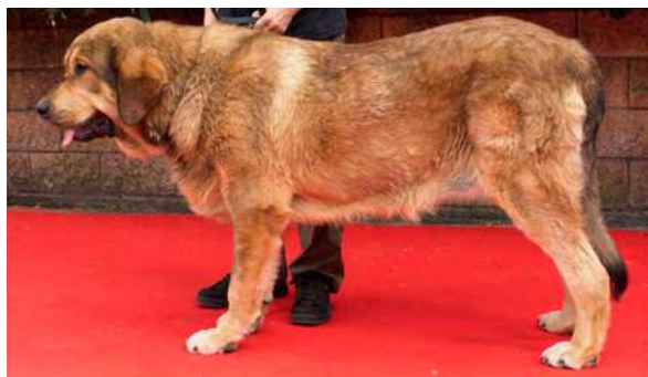
EXC 3º - ARCO DE LOS TINTALES

13 meses, boca correcta y completa, MB aspecto general, ojos un poco claros, exc. línea dorsal, angulaciones traseras y calidad de pelo, MB angulación delantera y movimiento.