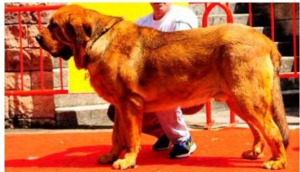
EXC 4° - CAZURRO DE AMDECE DE NAVA

18 meses. Boca completa, ojo un poco claro. MB aspecto general, hueso, talla y cabeza. EXC. línea dorsal y venta, angulaciones y movimiento.