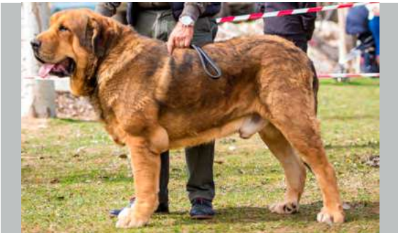
EXC 1º M.C - ZARPAS DE LA VICHERIZA

2 años. Buena talla, excelente hueso, excelente estructura general, buenas angulaciones delanteras, un poco justas las traseras, cabeza con excelentes proporciones, excelente cráneo, ojos correctos, mordida pinza los dos centrales, orejas correctas un poco grandes.