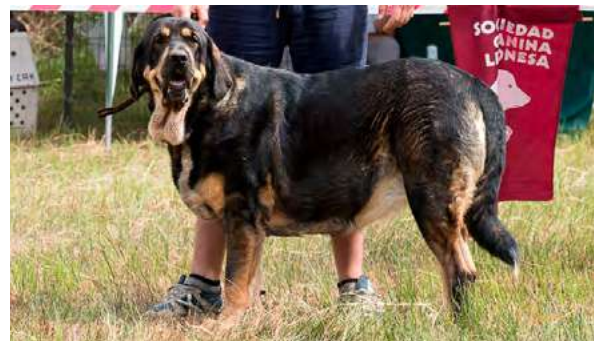
MB 2° - XENA DE LOS TINTALES

21 meses, deseable expresión más típica y líneas cráneo-faciales más divergentes, inserción oreja ligeramente trasera; grupa algo elevada; buen pecho, hueso y angulación delantera; buenas pieles. Movimiento correcto.