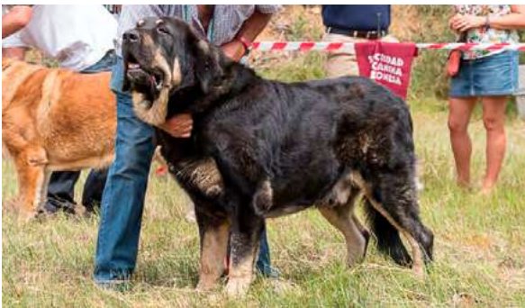
EXC 3º - CAÍN

Dentadura OK, ojos OK, masculino, muy buena cabeza; muy buena línea superior e inferior, pecho correcto, buena grupa, buenos aplomos delanteros y traseros; buenas angulaciones, buen movimiento.