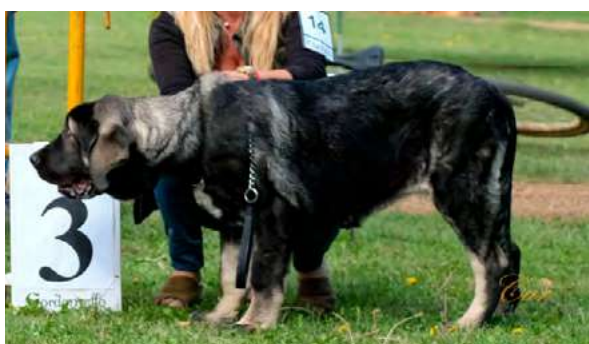
MB 3° - DIANA

Boca correcta. Ojos correctos. Oreja deseable mejor implantación. Pelo correcto. Proporciones correctas. Cabeza y expresión típica, bonita expresión. Cuerpo correcto. Extremidades correctas, deseable línea dorsolumbar más recta. Movimiento correcto.