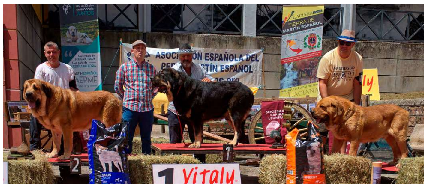
PODIUM ABIERTA MACHOS