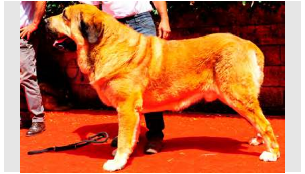
EXC 2º - LEÓN I DE LA VENGA DEL PORMA

3 años. Boca correcta, muy típico, MB construido. EXC cabeza y expresión. EXC. línea dorsal y ventral, EXC. angulaciones, movimiento correcto.