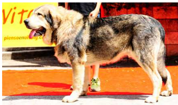
EXC 14º - HECHICERO DE LOS PISCARDOS

3,5 AÑOS, Boca completa, oreja ligeramente hacia atrás, EXC. hueso, pecho, hocico y cráneo. Angulaciones correctas, grupa ligeramente derribada. Cojera mano izquierda.