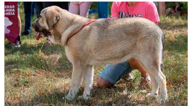
MB 3° - CHELSEA

6 meses, cabeza correcta, buena línea superior, buen hueso y angulaciones, buena calidad de pelo y pieles, movimiento correcto.