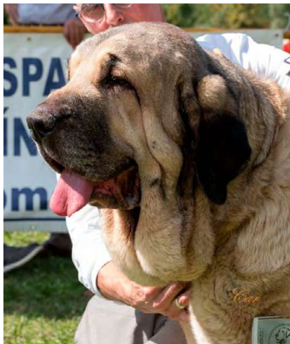
FORTUNA DE HAZAS DE CESTO