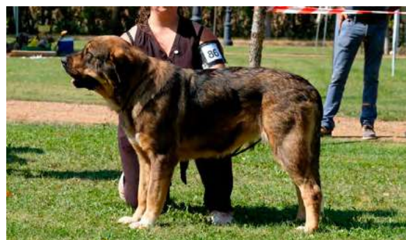
EXC 8º - JARA DE ARÁNDANOS

Boca, ojos, oreja y pelo correcto. Párpado inferior caído. Proporciones correctas. Expresión no típica por párpado caído. Cuerpo correcto. Deseable más angulación trasera. Movimiento: Metatarso izquierdo débil.