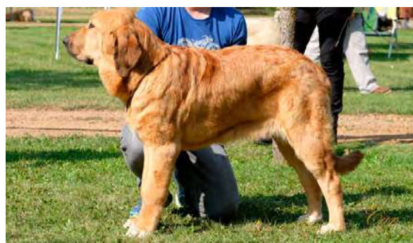
MB 4º - HULLA DE LA REGUERA

Boca, ojos, oreja y pelo correctos. Proporciones óptimas. Cabeza y expresión correctas. Cuerpo óptimo. Extremidades óptimas. Movimiento correcto.