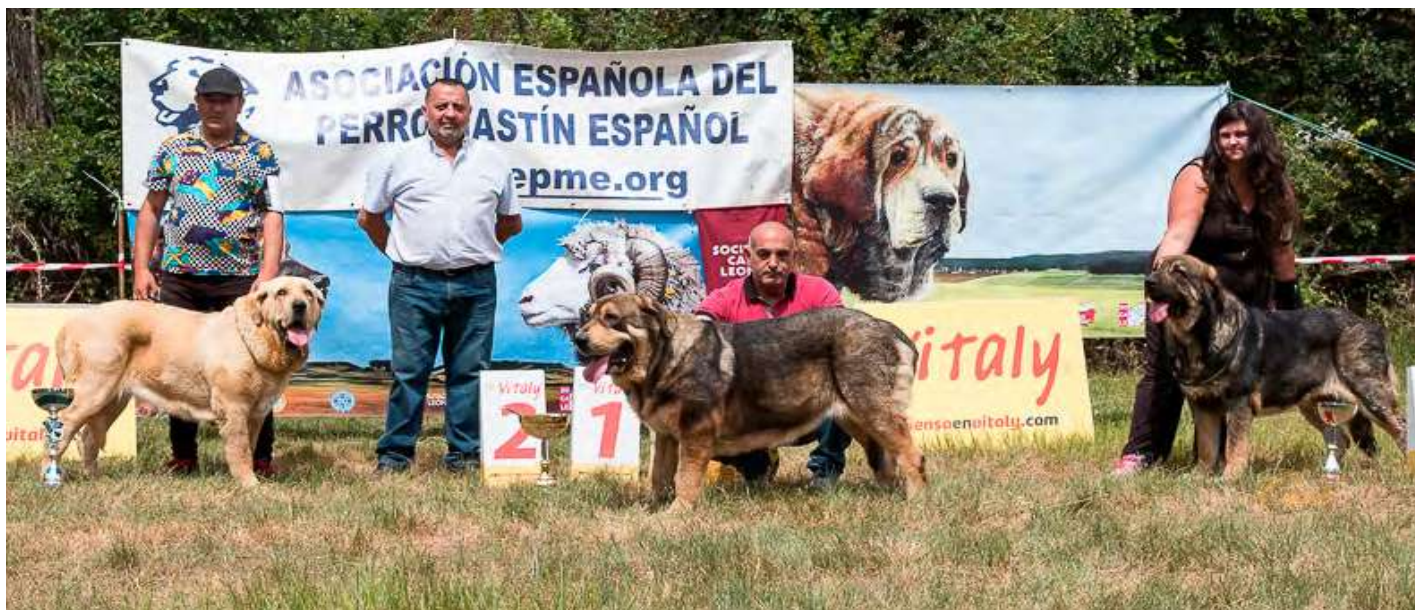
PODIUM ABIERTA HEMBRAS