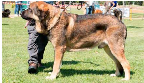
EXC 9° - HIELO DE ALZAVARÁN

Boca, ojos, oreja y pelo correctos. Proporciones óptimas. Cabeza y expresión típicas. Cuerpo óptimo. Extremidades óptimas. Debilidad de carpo.