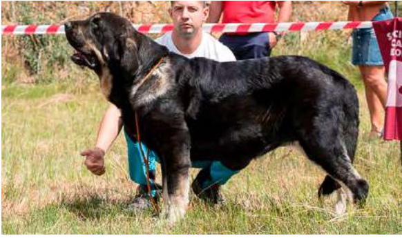
EXC 5° - ROCA DE GRITSANDANA

3 años, dentadura correcta, muy típica, femenina, buena expresión, preferible cráneo más ancho, buena cruz y buenas angulaciones y buen pecho descendido. Bracea y saca codos.