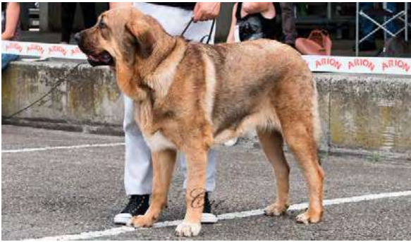
EXC 2° - XENA DEL PICU SAN MARTIN

10 meses, EXC. Tamaño y aspecto general, EXC proporciones cráneo/hocico, tijera, desearía ojo más oscuro, EXC. Oreja, línea dorsal ventral, angulaciones delanteras y traseras, aplomos y movimiento.