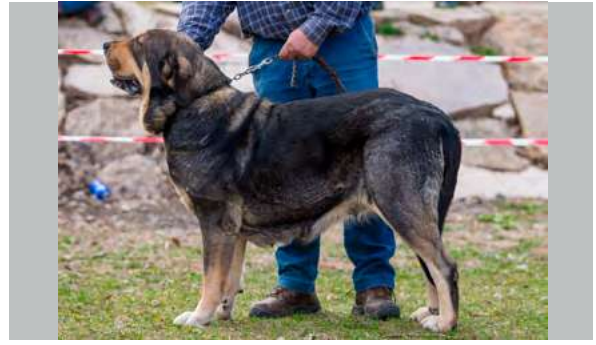
EXC - ROCA DE LA RIBERA DEL PAS

4 años. Un poco justa de talla, excelente hueso, cabeza con buenas proporciones aunque me gustaría un poco más limpia de arruga en los ojos, ojos de excelente color y mordida en pinza, la oreja podría ser un poco más pequeña.