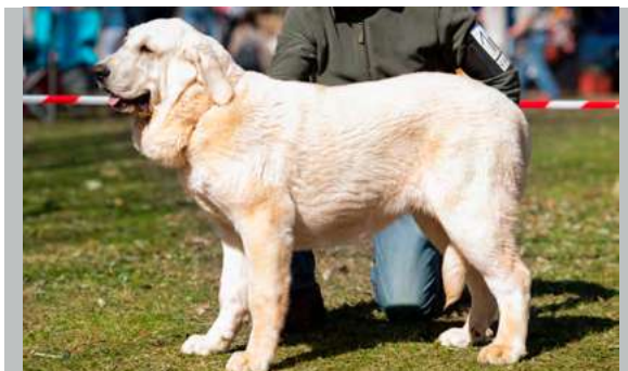
MB 3° - NIEVE DE MONTE VIZCAYO

5 meses. Muy buen tamaño y estructura general, cabeza con buenas proporciones aunque me gustaría cráneo un poco más ancho y la oreja más pequeña, ojos suficientemente oscuros y buena pigmentación de nariz.