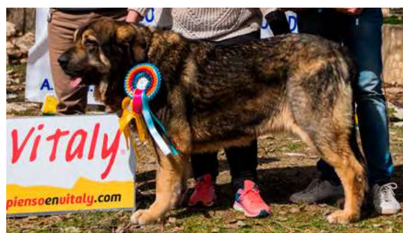
KIMBA DE LA CAMPERONA