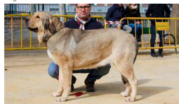
EXC 3º - BRUMA DEL TOSSAL GROS

23 Meses, buena boca, talla orejas pieles y línea frontal, muy buenas angulaciones excelente movimiento, deseable un poco más de hueso.