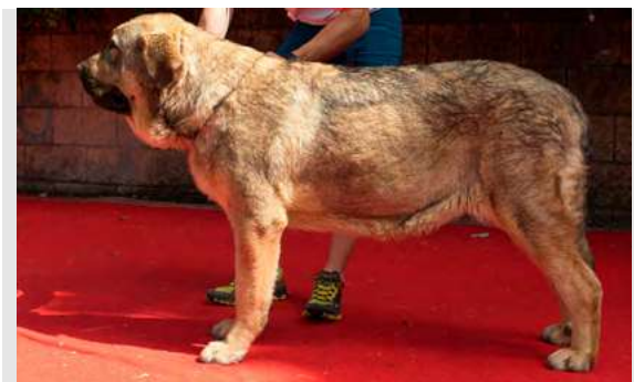
EXC 3° - BRIZNA DE FILANDÓN

11 meses. Ojos claros. Buen aspecto general, MB construida, MB pieles. MB cabeza, cráneo algo plano, planos faciales casi paralelos. Angulaciones correctas. MB movimiento.