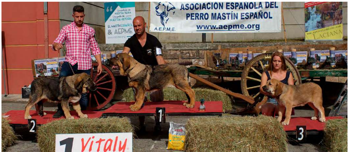
PODIUM MUY CACHORROS MACHOS