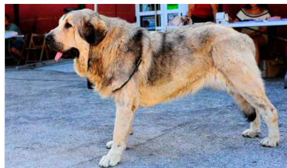
EXC 23° - FARRUCA DE BUXIONTE

4 años. Boca correcta, ojo un poco claro., larga, bien construida, cuello largo, cráneo ligeramente estrecho, buen hocico. EXC. angulaciones y líneas dorsal y ventral. MB aplomos. Movimiento correcto.