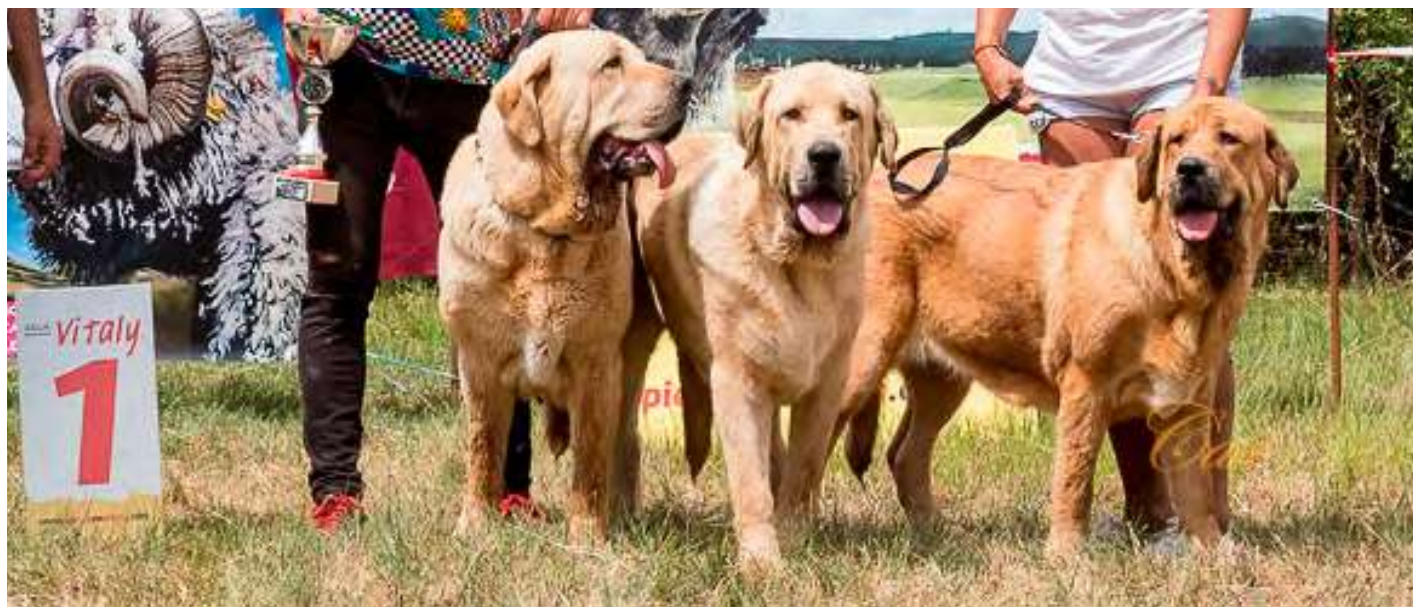
MASTINES DE SERYLU