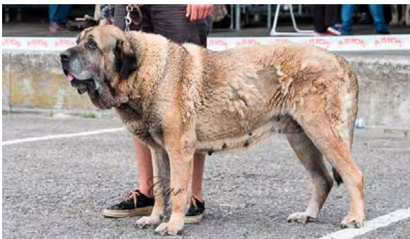
EXC 1° - BRUTA I DE AUTOCAN

10,5 AÑOS, EXC. proporciones, desearía más hueso, EXC. proporciones cráneo/hocico, EXC. oreja, ojos color avellana, tijera, dentadura algo gastada, EXC. angulaciones.