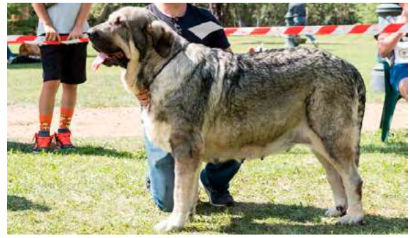
EXC 10º - NOA DE LOS PISCARDOS

Boca con diente incisivo inferior atrasado. Ojo, oreja y pelo correcto. Proporciones óptimas. Cabeza y expresión típicas. Cuerpo óptimo. Extremidades óptimas. Movimiento fluido pero con debilidad de carpos.