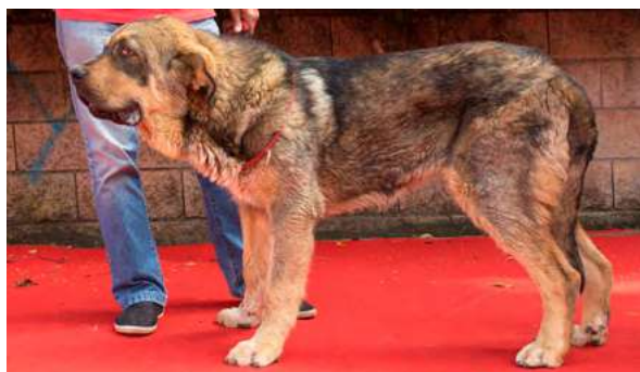
EXC 5° - SEVIL DE LOS PISCARDOS

9 meses, boca completa, prolapso 3° parpado ojo izquierdo, típico, largo, delgado, MB cráneo, hocico, hueso, oreja algo retrasada, cuello largo. MB angulaciones.