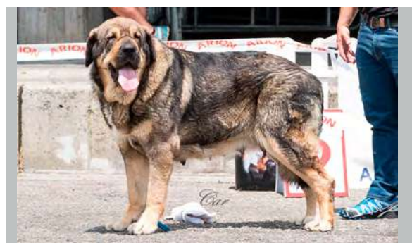
EXC 2º - BRUJA I DE FILANDÓN

4 años, armónica, típica. EXC. pelo, EXC. proporciones cráneo/hocico, pinza, cabeza potente, ojos casi avellana, EXC. orejas, construcción, línea dorsal, pieles, hueso y angulaciones. EXC. movimiento con gran amplitud.