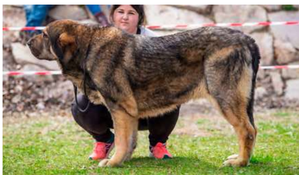
EXC 1° M.M. B.I.S - KIMBA DE LA CAMPERONA

Casi 3 años. Excelente talla y hueso, perra larga bien construida, excelente pelo, excelente color y colocación de ojos, cráneo y hocico potentes, oreja bien implantada pero podría ser más pequeña, angulaciones justas, excelente movimiento.