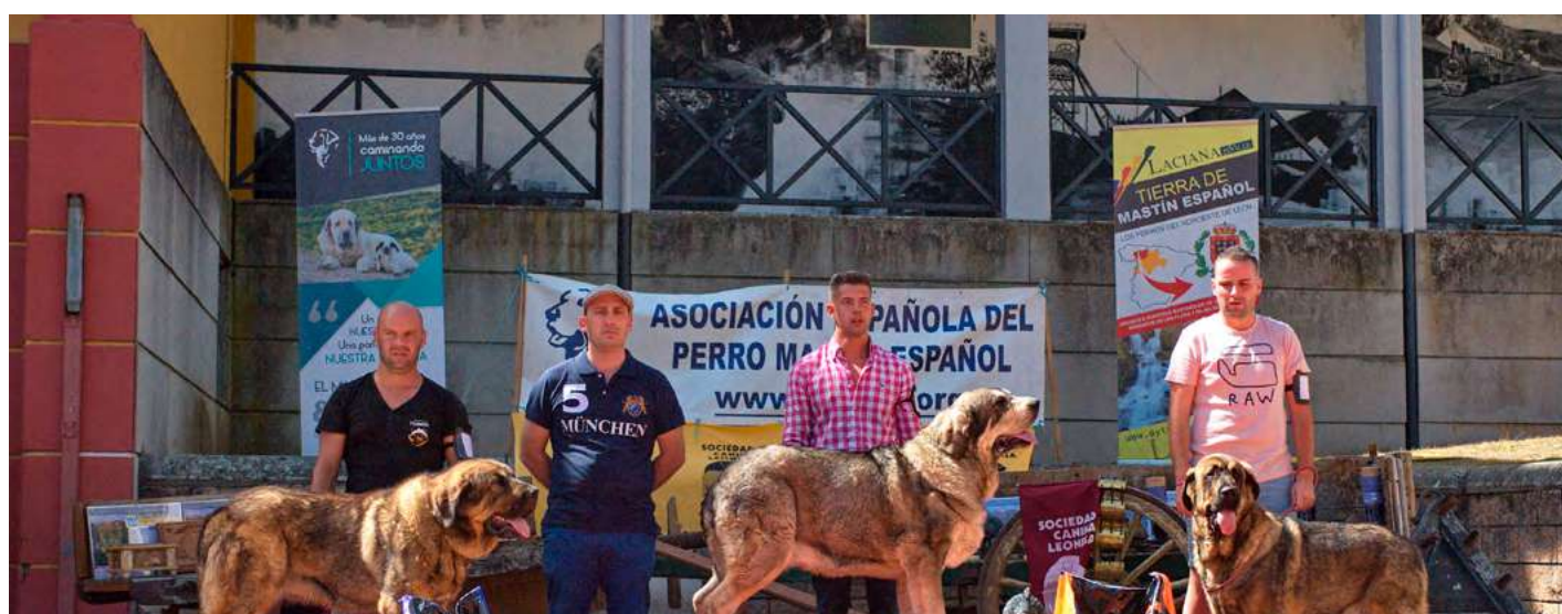
PODIUM INTERMEDIA HEMBRAS