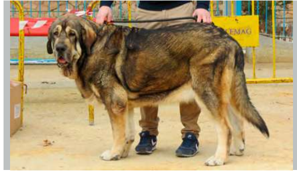
MB - SOLDADO DE SIERRA ENMEDIO

12 Meses, buena boca, cabeza pesada, buen pelo, buena línea superior, desvia metacarpos en parado, angulaciones moderadas traseras, movimiento justo y rosca rabo.