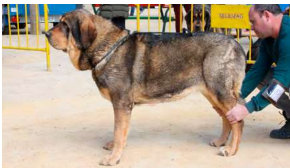
EXC 5º - DIANA DE LA RABIZA

35 Meses buena boca, cabeza típica, muy buen color de ojos, hocico fuerte, buenas orejas, línea dorsal muy buena y angulaciones.