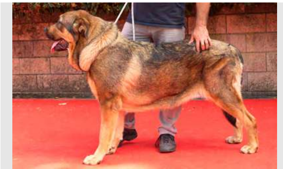
EXC 5° - NATA DE SALGUEIRÓN

13 meses. Boca completa, ojo oscuro. B aspecto general. B oreja un poco grande, costilla plana, EXC, angulación delantera y trasera. B movimiento.