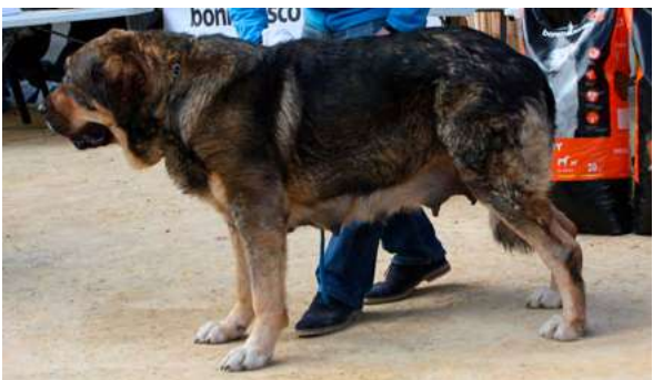
EXC 3º - BRUJA I DE FILANDON

32 Meses buena boca, buen tamaño, hueso, cabeza, pieles frente y angulaciones, hembra fuerte, excelente línea dorsal movimiento muy bueno.