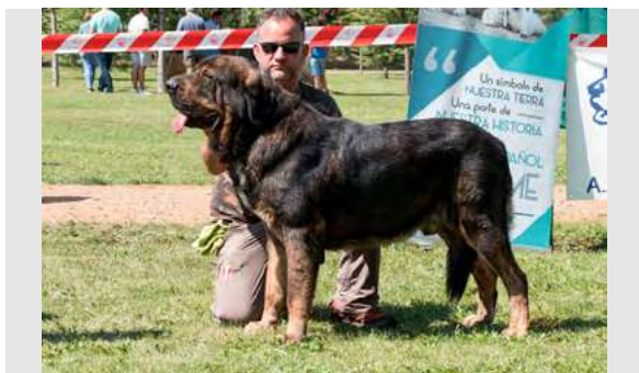
EXC 12° - JAGGER DE TIERRA DE ORBIGO

Boca, ojos, oreja y pelo correctos. Proporciones correctas. Cabeza y expresión típica. Cuerpo correcto. Extremidades correctas. En movimiento, tren trasero correcto, el delantero cruza manos.