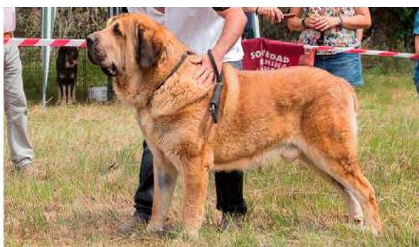
EXC 7° - LEÓN I DE LA VEGA DEL PORMA

3 años, dentadura ok, muy buena cabeza, masculino, potente, armónico y bien proporcionado; buena cruz, línea superior, grupa, hueso, pecho, aplomos y piel. Ligeramente cojera.