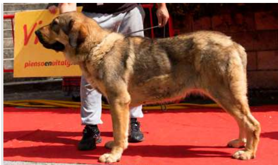
EXC 7° - CUMBRE DE FILANDÓN

15 MESES. Boca y oreja correcta. Cabeza y expresión típica. Costilla algo plana. MB angulación delantera y justa la trasera. Movimiento correcto.