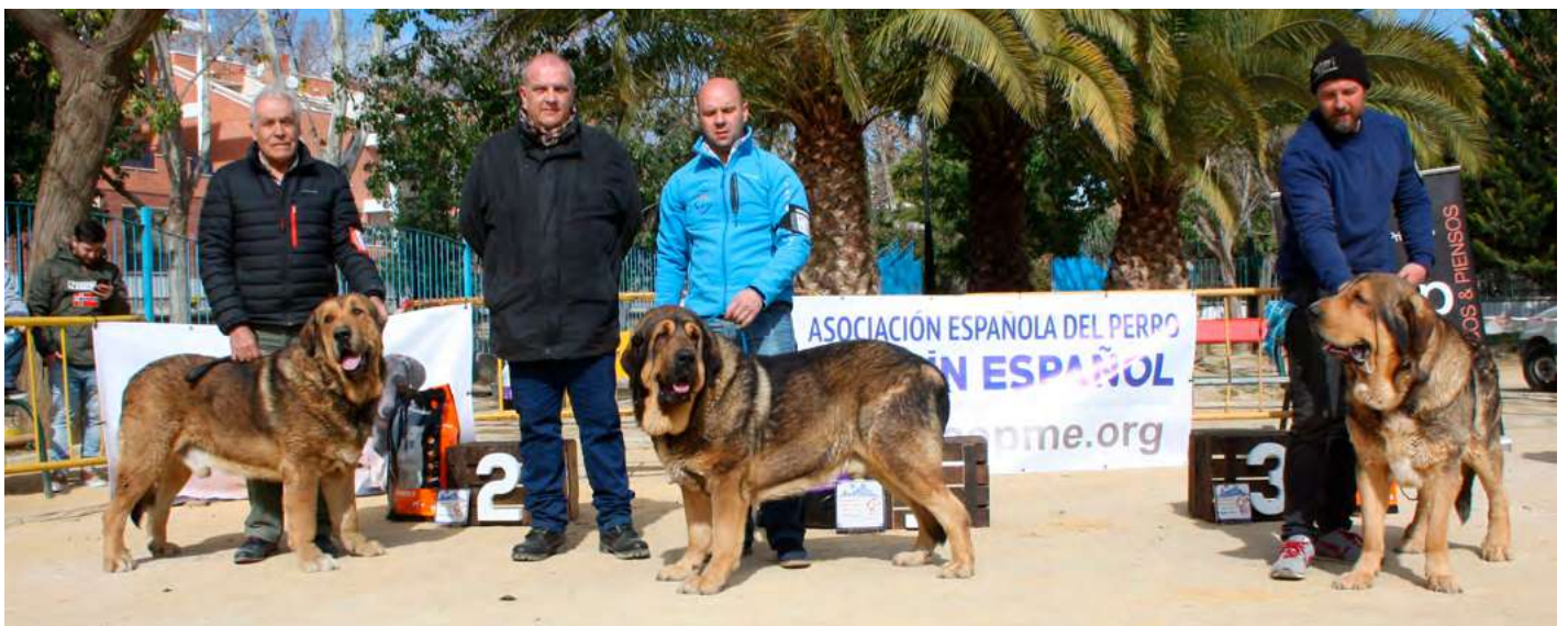
PODIUM ABIERTA MACHOS