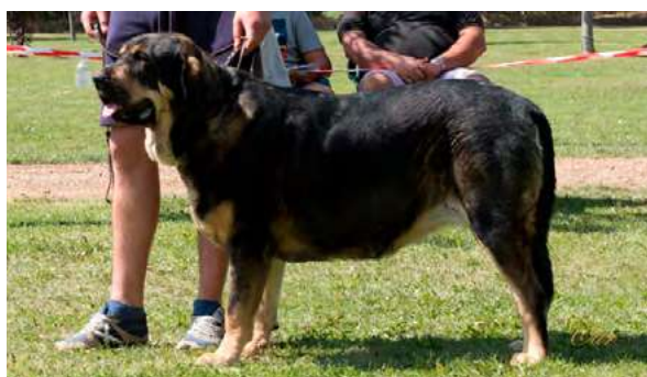
EXC 3° - XENA DE LOS TINTALES

Boca, ojos, oreja y pelo óptimo. Proporciones óptimas. Cabeza y expresión muy típicas. Cuerpo óptimo. Extremidades óptimas. Movimiento óptimo