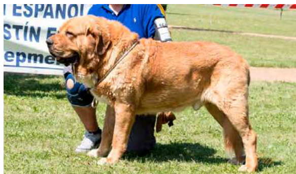
EXC 8° - CARDENAL DE ARASANZ

Boca, ojos, oreja y pelo correctos. Proporciones óptimas. Cabeza y expresión típicas. Cuerpo correcto. Extremidades correctas. Movimiento correcto