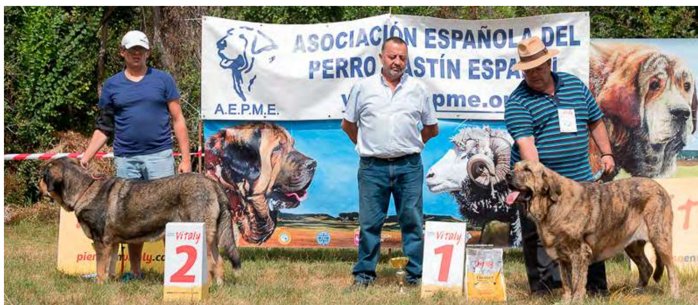
PODIUM INTERMEDIA HEMBRAS