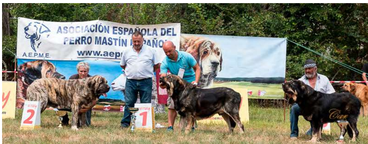
PODIUM ABIERTA MACHOS