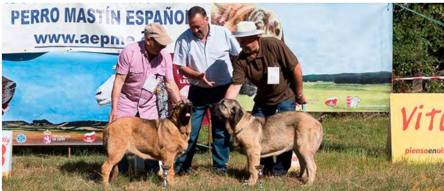
PODIUM MUY CACHORRO HEMBRA