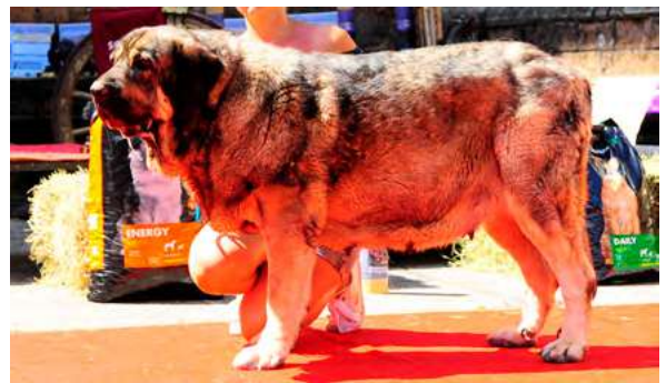
EXC 12°- BROZA DE FILANDÓN

3 años, boca completa, óptimos ojos y oreja. Hocico un poco largo en proporción al cráneo. MB expresión, pecho y costilla. B angulaciones, grupa ligeramente derribada en movimiento.