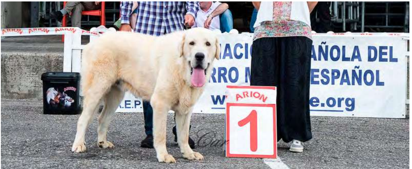
PODIUM JOVENES MACHOS