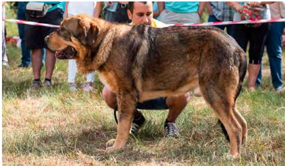
EXC 3° - MILTON DE FONTEXUNQUERA

13 meses, típico, ojo claro, preferible oreja más pequeña, línea superior OK, buen hueso; buenos aplomos delanteros, pieles y pelo. Movimiento correcto.