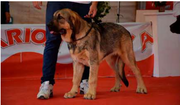
MB 3º - JUNO DE FINCA NOBLE