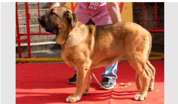
MB 2° - CALA DE AUTOCÁN

Boca, ojos, oreja, pelo y proporciones generales correctas. Cabeza y expresión B, Cuerpo B, saca carpo y junta corvejones, movimiento flojo.