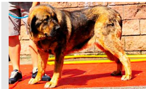
EXC 2° - BREA DE FILANDÓN

20 meses. Boca completa, oreja un poco grande. Masiva, mucho hueso, típica, exc hocico, costilla, línea superior e inferior, pecho y angulaciones. Carpo un poco corto. MB movimiento, mete manos.