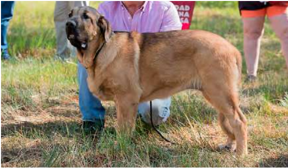
MB 1° - CALA DE AUTOCAN

4 meses, típica, femenina, bien estructurada, buena línea dorsal y grupa, buena cabeza, buena calidad de pieles, buen hueso. Movimiento correcto.