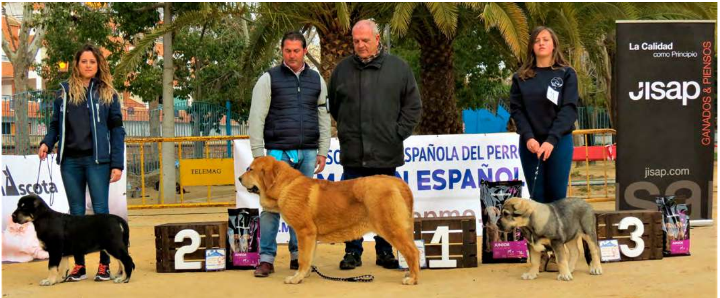
PODIUM MUY CACHORROS HEMBRAS